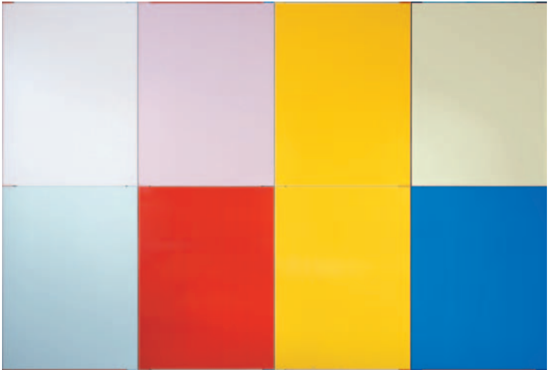
Imi Knoebel , Bright Vision, 2001, Acryl auf Aluminium, 343,7 x 504 x 4,5 cm