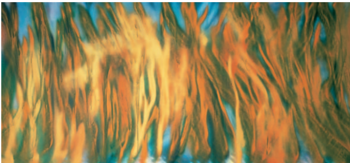
Katharina Grosse , Ohne Titel, 2002, Acryl auf Leinwand, 310 x 650 cm