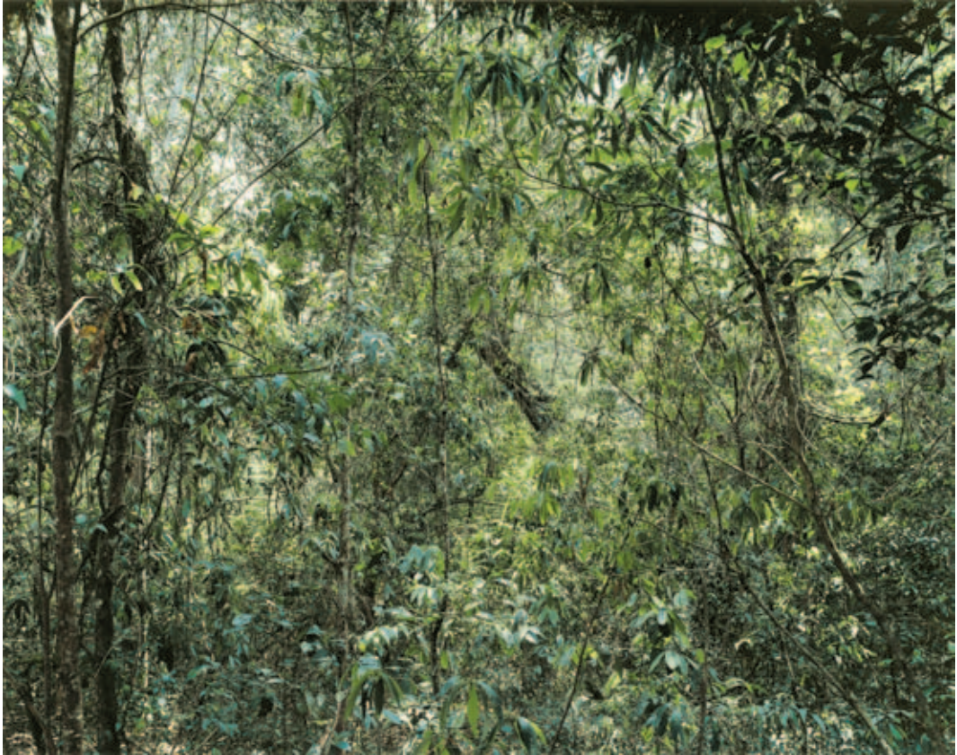
Thomas Struth , Paradise 9 (Xi Shuang Banna), Provinz Yunann / China, 1999, C-Print, 269,4 x 339,4 cm