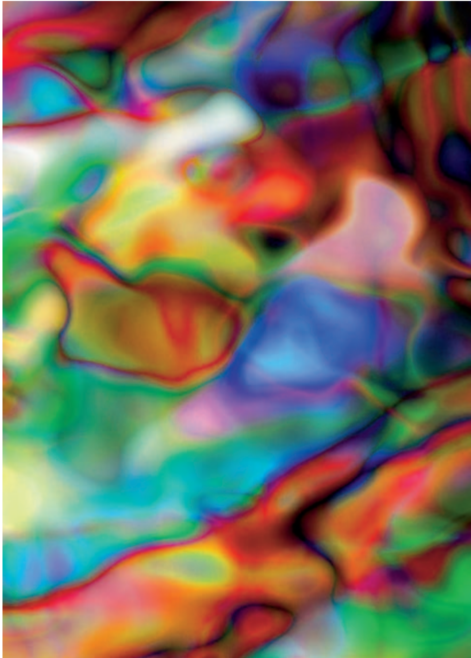
Thomas Ruff , Substrat 2 I, 2002, Inkjet auf Papier, 240 x 190 cm