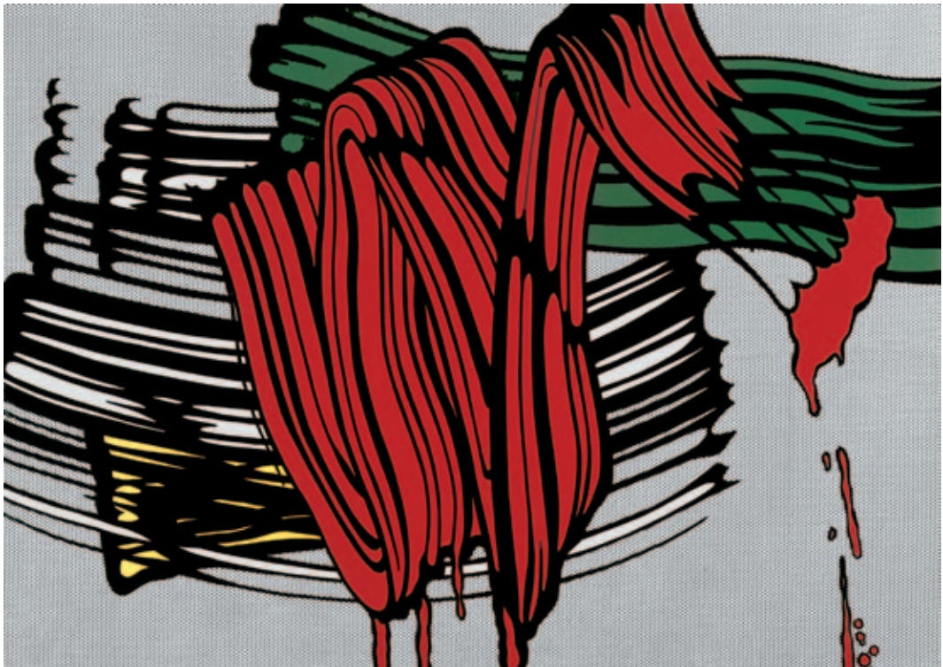
Roy Lichtenstein , Big Painting No. 6, 1965, Öl und Magna auf Leinwand, 233 x 328 cm