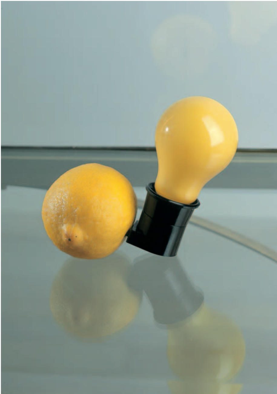
Joseph Beuys , Capri-Batterie, 1985, Vitrine aus Messing und Glas, gelbe Glühbirne, Fassung mit Stecker, Zitrone, 131 x 82 x 45 cm