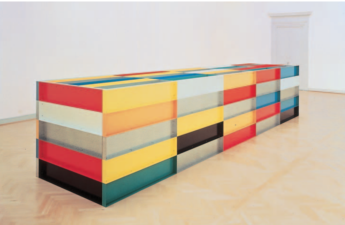
Donald Judd, Untitled, 1989, Aluminium, gebogen, verzinkt und farbig gespritzt, Eisen, galvanisiert, 150 x 165 x 750 cm