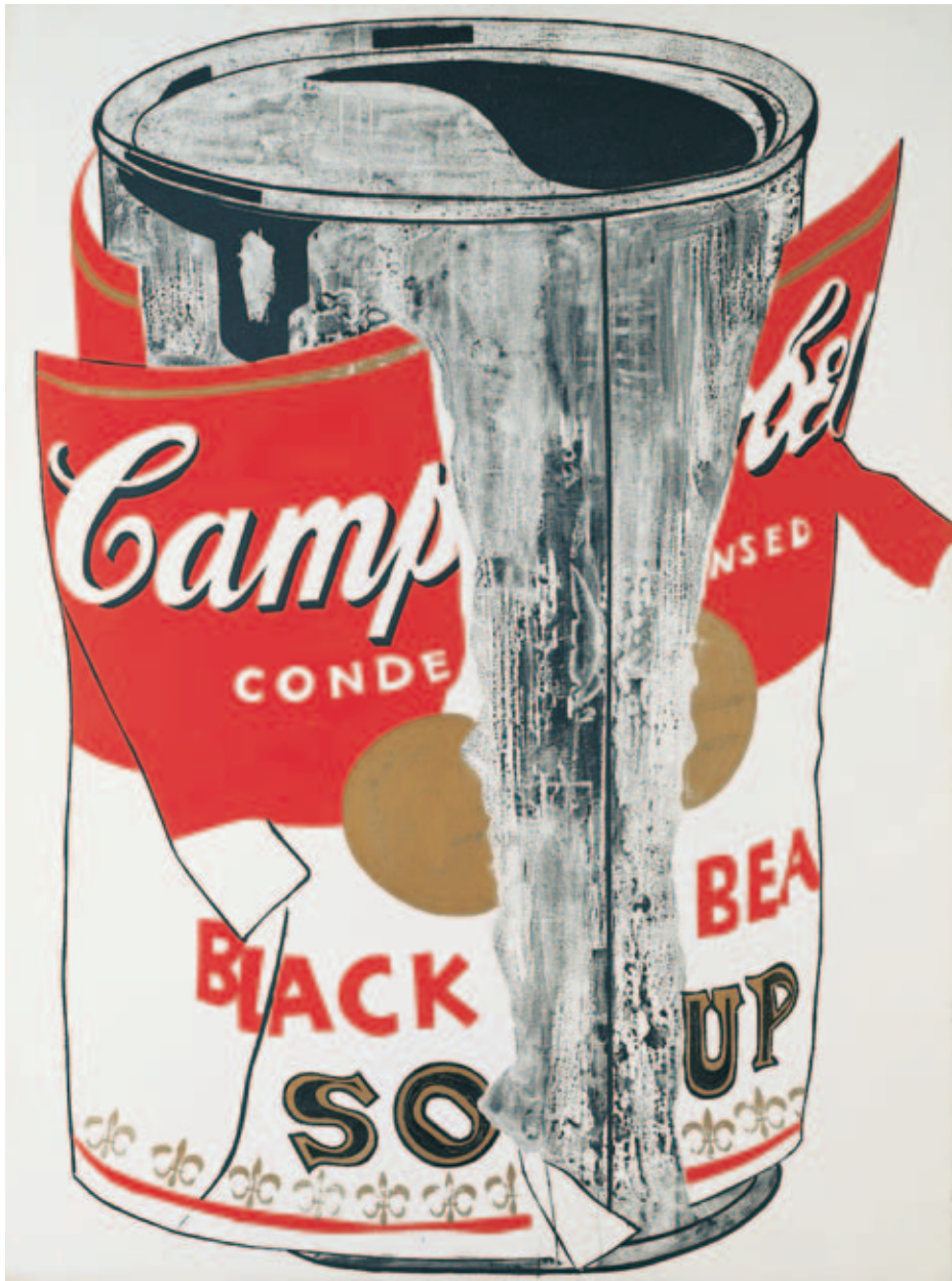
Andy Warhol , Big Torn Campbell's Soup Can (Black Bean), 1962. Acryl auf Leinwand, 183 x 137 cm