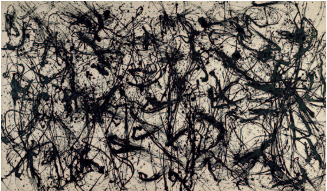
Jackson Pollock , Number 32, 1950, Duco auf Leinwand, 269 x 457,5 cm