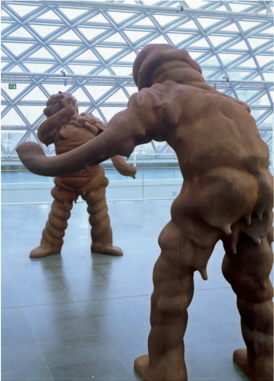
Thomas Schütte , Große Geister (Nr. 15, Nr. 4), 1999/1998, Gussstahl, Höhe je 250 cm