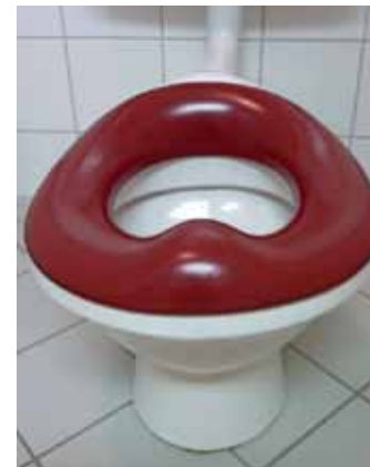
Kleinkindgerechte Toilette, 26 cm hoch mit ergonomischer Sitzbrille, die ein Abrutschen verhindert

Um Kleinkindern so früh wie möglich den selbständigen Toilettengang zu ermöglichen, bietet sich der Einbau von kleinkindgerechten Toiletten an. Wenn die WC-Becken so niedrig sind, dass sich Kinder alleine darauf setzen können (26 cm), fördert das die Sauberkeitserziehung. Die jüngeren lernen von den älteren Kindern viel schneller durch Nachahmung.