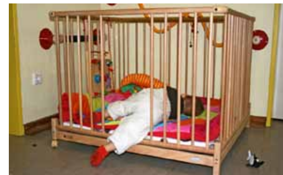
Ideal für mobile Kleinkinder: Selbständig und selbstbestimmt den gewünschten Schlafplatz aufsuchen

einschlafen können“ (Franz & Vollmert, 2009 S. 31). Legt sich ein Kind aus eigenem Antrieb schlafen, kann das als guter Indikator für eine gelungene Eingewöhnung und damit gewonnene Sicherheit angesehen werden.