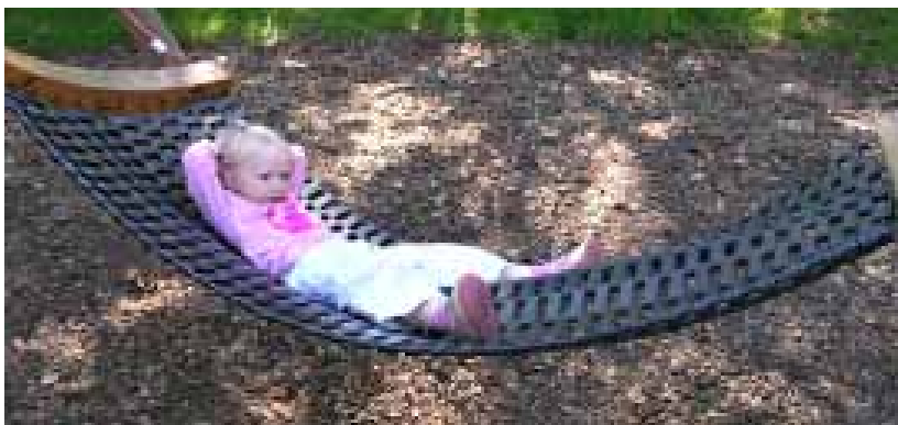
Eine gute Alternative zu Vogelnestschaukeln sind witterungsbeständige Hängematten

Schaukeln ist ein elementares Bedürfnis aller Kinder. Sie aktivieren und stimulieren sich damit oder nutzen die sanften Wiegebewegungen, um zur Ruhe zu kommen. Daher sollten im Außenbereich Schaukelmöglichkeiten in ausreichender Anzahl und unterschiedlicher Variation für alle Altersgruppen von Kindern zur Verfügung stehen.