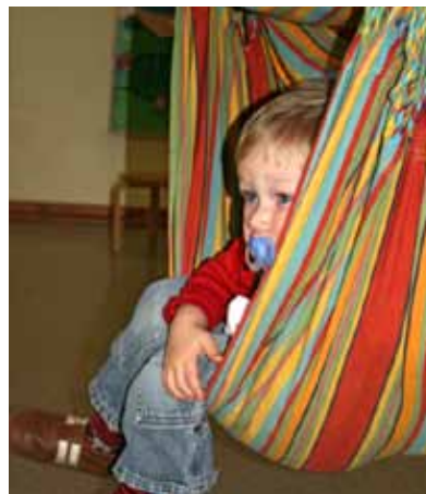
Die Hängematte als Rückzugsort, in der sich Kinder geschützt und geborgen fühlen