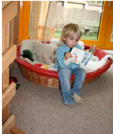
Ein Rückzugsort auf einem Podest mit direktem Blick nach draußen