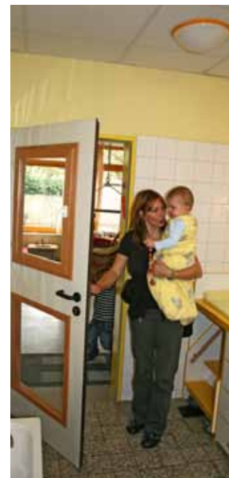
Der Sanitärbereich kann unmittelbar vom Gruppenraum erreichbar und von dort aus einsehbar sein. Das erleichtert die Aufsicht und vermindert die Gefahr durch aufschlagende Türen