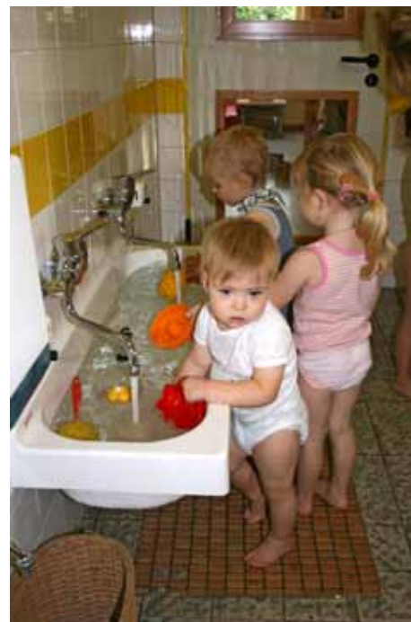
Waschrinnen bieten mehr als herkömmliche Waschbecken die Möglichkeit zum experimentieren und zum Zusammenspiel. Holzstab- oder Gummimatten schützen vor kalten Fliesenböden

Grundsätzlich gilt bei Neuplanungen: Je großzügiger der Sanitärraum konzipiert wird, desto größer der Erfahrungsspielraum durch Gestaltungselemente.