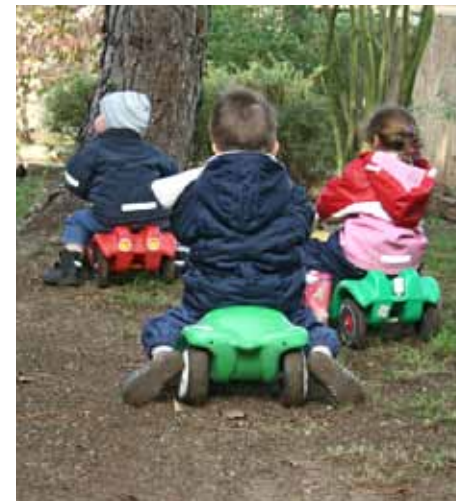
Kinderfahrzeuge im Einsatz

Kinder brauchen „Rennstrecken“, damit sie vielfältige Bewegungserfahrungen machen können. Denn nach den ersten sicheren Lauferfolgen werden Fahrzeuge in ihren unterschiedlichen Nutzungsvariationen interessant. Damit trainieren die Kinder auf spielerische Weise ihre Koordination, ihr Gleichgewicht sowie ihre Ausdauer. Ein Außengelände sollte daher auch Bereiche mit asphaltierter oder gepflasteter Oberfläche besitzen.