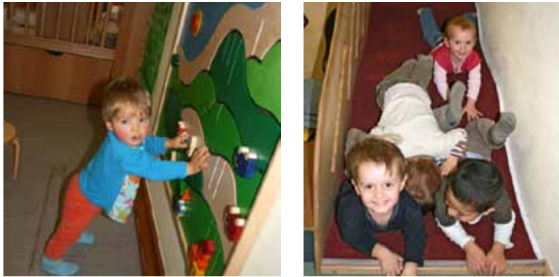
Der Gewinn an Bewegungssicherheit im Verlauf der ersten Lebensmonate und -jahre vermittelt dem Kind Selbstsicherheit und Selbständigkeit.

Fortbewegung bedeutet Ortsungebundenheit, was wiederum den Aktionsradius vergrößert und neue Erfahrungen ermöglicht. Umgebende Räume können erkundet und in Besitz genommen werden.