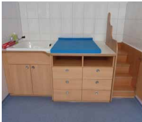
Beispiel für einen gut ausgestatteten Wickelbereich. Die Treppe kann bei Bedarf verschlossen werden.

Ausziehbare Aufstiegshilfen sollten leicht ausziehbar und feststellbar sein sowie Setzstufen haben. Aufstiegshilfen sind keine Treppen im Sinne der UVV Kindertageseinrichtungen und der DIN 18065 „Gebäudetreppen“.