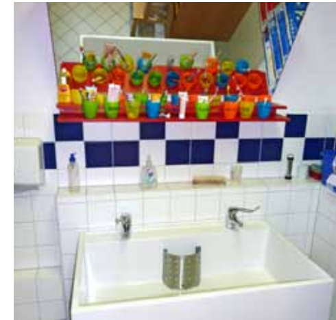
Über einer Waschrinne installierter, geneigter Spiegel