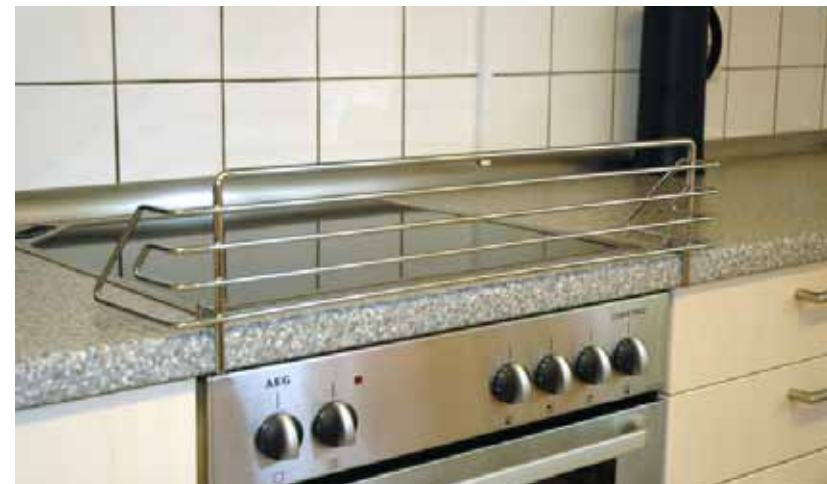
Schutzgitter zur Vermeidung von Verbrühungs- und Verbrennungsgefahren

Sofern sich in mehrgruppigen Einrichtungen Speiseaufzüge befinden, sind diese gegen unbefugtes Benutzen durch Kinder zu sichern. Dies kann z.B. durch einen Schlüsselschalter erreicht werden.