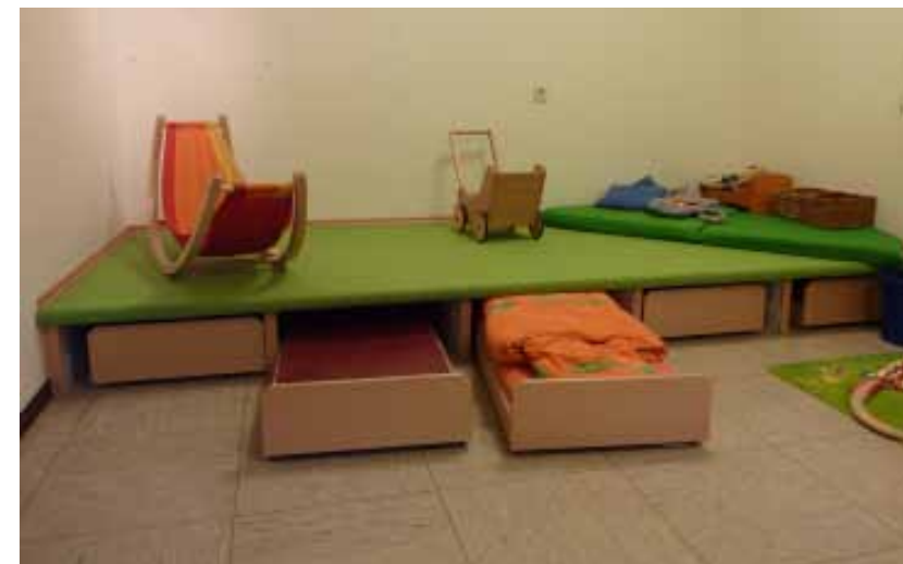
Unterschiebbare Betten unter Podeste bieten platzsparende und alternative Möglichkeiten. Es kann vor oder auf dem Podest geschlafen werden