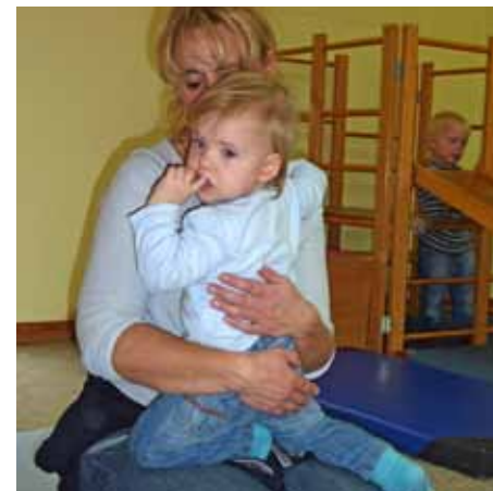
Sicherheit ist ohne Vertrauens- beziehung nicht möglich

Aufgeschlossenheit, Neugierde und Selbstvertrauen in die eigenen Fähigkeiten kennzeichnen Kinder, die sich in ihren Bindungen zu Bezugspersonen sicher fühlen. Je sicherer sich Kinder ihrer Beziehungen sind, je weniger sie befürchten müssen, nicht „gehalten“ zu sein, desto leichter machen sie Entwicklungsschritte. Eine sichere Bindung schafft Raum für Autonomie und Exploration.