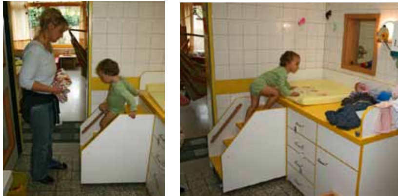
Eine ausziehbare Treppe oder Aufstiegshilfe bietet sich an, wenn nicht ausreichend Platz für eine fest installierte Treppe vorhanden ist. Sie verhindert, dass Kinder ohne Aufsicht den Wickeltisch erobern und evtl. herunterfallen

Ausziehbare Aufstiegshilfen sollten leicht ausziehbar und feststellbar sein sowie Setzstufen haben. Aufstiegshilfen sind keine Treppen im Sinne der UVV Kindertageseinrichtungen und der DIN 18065 „Gebäudetreppen“.