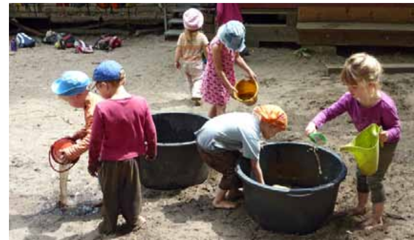
Offene Wasserbehältnisse (auch Planschbecken) dürfen von Kleinkindern nur unter Aufsicht genutzt werden