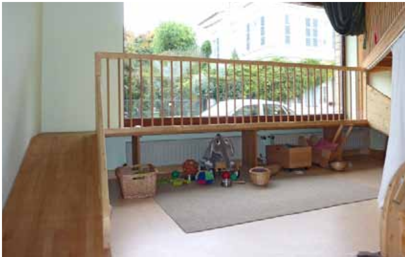
Beispiel für eine zweite Ebene, die auch noch nicht lauffähigen Kindern die Möglichkeit bietet, eine andere Perspektive einzunehmen und die Geschehnisse draußen zu beobachten. Rechts daneben kann eine weitere Ebene erreicht werden