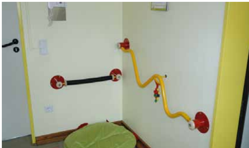
Gruppenräume benötigen Dinge, an denen sich Kinder hochziehen und festhalten können, wenn sie noch nicht selbständig laufen. Das ermöglicht andere Perspektiven