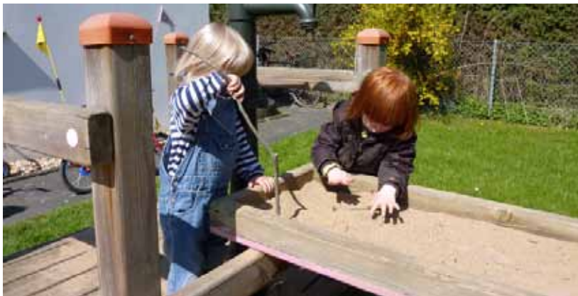
Wasserläufe, in der kalten Jahreszeit auch ohne Wasser verwendbar

Auf dem Außengelände einer Kindertageseinrichtung sollte für alle Kinder grundsätzlich die Möglichkeit bestehen mit den Elementen Wasser und Sand spielen und experimentieren zu können. Beide Elemente bieten vielfältige (Sinnes-) Erfahrungen und Variationsmöglichkeiten und üben – vor allem in Kombination – eine große Faszination auf die Kinder aus.