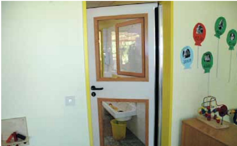
Beispiel: Die Durchsicht auf kleinere Kinder reduziert die Gefährdung durch aufschlagende Türen (hier die Tür vom Gruppenraum zum Sanitärbereich)