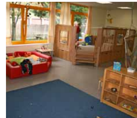
Beispiel eines Gruppenraums für Kleinkinder: Charakteristisch ist die Reduzierung der Möblierung und Materialien, infolge dessen steht viel Freifläche zur Verfügung. Eine erhöhte Spielebene sowie Podeste, die auch für Krabbelkinder erreichbar sind und die Sicht nach draußen ermöglichen sowie eine Hängevorrichtung zum Schaukeln bilden eine geeignete Raumausstattung

Räume, Einrichtungsgegenstände und Spielmaterialien bilden den Rahmen für kindliche Aktivitäten.