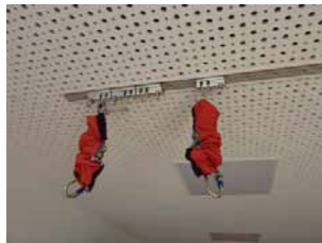
Schienensysteme bieten variable Nutzungsmöglichkeiten