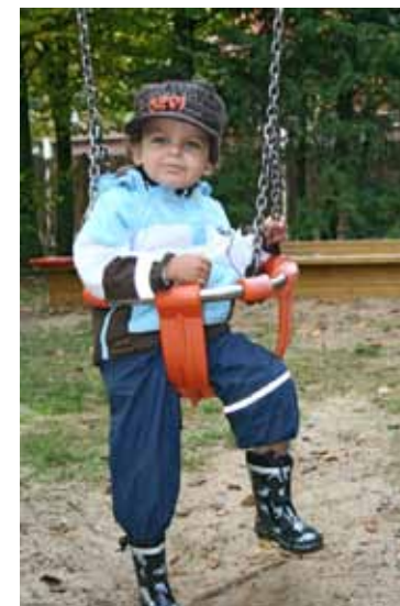
Geschlossene Schaukelsitze eignen sich besonders für Kleinkinder