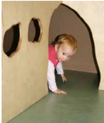
Kinder brauchen Rückzugsorte. Erhöhte Spielebenen bieten z.B. Möglichkeiten