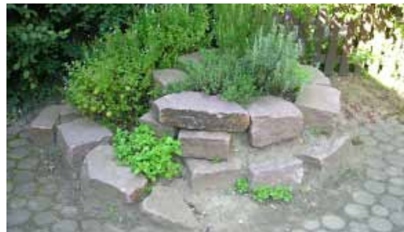
Das Anlegen von Kräutern, Blumen- und Gemüsebeeten ist auch für unter Dreijährige ein spannender Prozess – besonders, wenn man anschließend ernten und essen kann. Dadurch wird Kleinkindern schon früh ein Bezug zur Natur ermöglicht