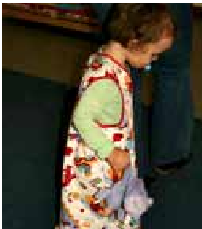
Insbesondere für Säuglinge und Kleinkinder erforderlich: Passende Schlafsäcke verhindern die Erstickengefahr durch Bettdecken