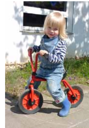
Laufräder eignen sich in besonderer Weise zur Schulung des Gleichgewichts