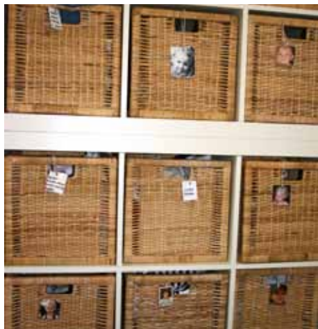
Beispiel für die standsichere Unterbringung von persönlichen Utensilien mit Wiedererkennungswert für die Kinder