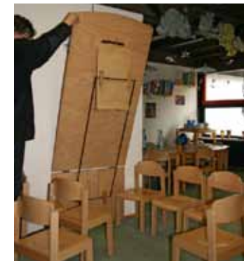
Platzsparend: Klappbare Wandtische, nach Bedarf einsetzbar