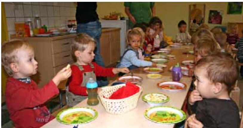
Gemeinsame Mahlzeiten strukturieren den Tagesablauf und fördern die Gemeinschaft

Je früher die Kinder selbständig essen, desto eher werden die Fachkräfte entlastet. Denn die Über-Mittag-Betreuung beinhaltet erst einmal ein erhebliches Maß an Mehrarbeit für die Fachkräfte.