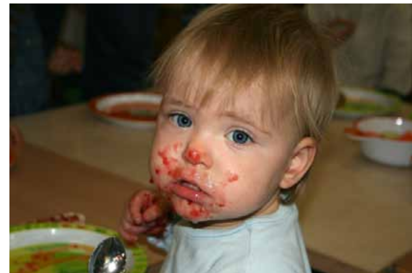
Die Entwicklung des Essverhaltens erfordert viel Geduld und Ruhe. Je selbständiger die Kinder agieren dürfen, desto früher kultiviert sich auch ihr Essverhalten