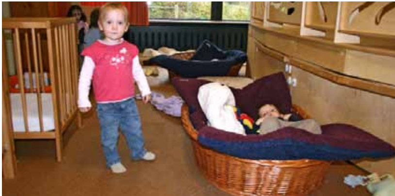
Sogenannte Schlafkörbe, die mit einer Matraze oder ähnlich gepolstert, können auch als Spielraum genutzt werden, wenn keine anderen Kinder dadurch gestört werden