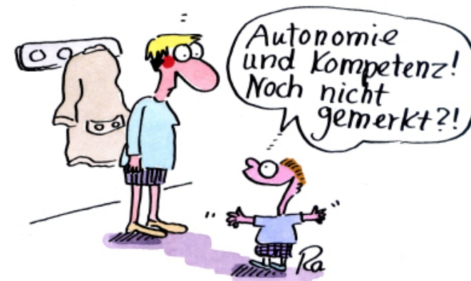
Vermittlung von Autonomie und Kompetenz