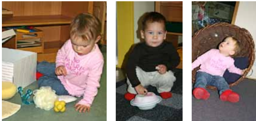
Alltagsmaterialien in Kisten, Kartons und Körben sind gut zugänglich und besitzen einen großen Aufforderungscharakter