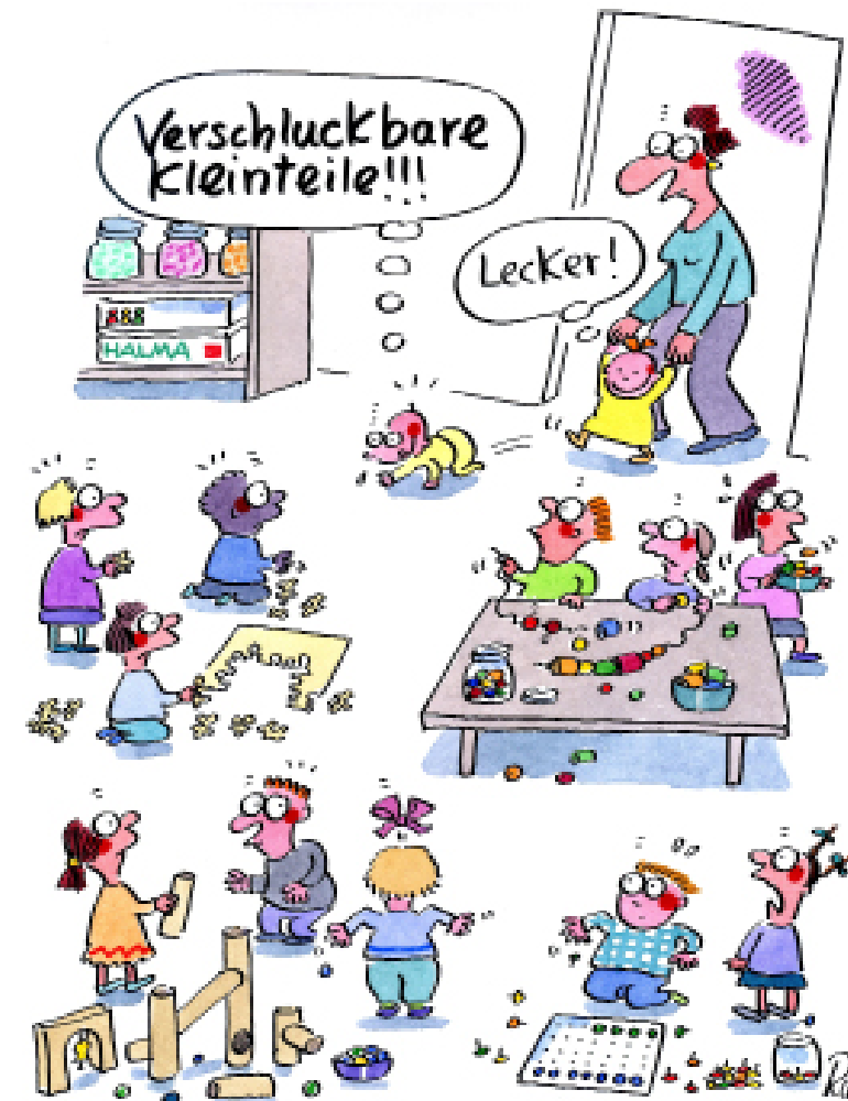
Materialien grundsätzlich dem Spielalter anpassen