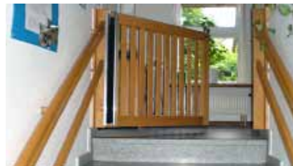
Kinderschutzgitter zur Sicherung einer Treppe

Treppen, die von Kleinkindern noch nicht sicher begangen werden können, dürfen für die Kinder ohne Aufsicht und Begleitung nicht zugänglich sein. Dies kann z.B. durch Kinderschutzgitter oder Türchen mit einer Mindesthöhe von 65 cm erfolgen. Durch das Anbringen eines Entriegelungshebels auf der dem Kind abgewandten Seite kann verhindert werden, dass die Kinder das Schutzgitter selbständig öffnen.