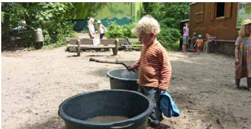
Das Spiel mit Wasser öffnet vielfältige Erfahrungsmöglichkeiten. Offene, große Wasserbehälter sollten von Kleinkindern immer nur unter Aufsicht benutzt werden

Um ungestörte Aktivitäten von Kleinkindern – insbesondere von Kindern unter zwei Jahren – zu ermöglichen, sollte in Abhängigkeit von der Grundstücksgröße ein geschützter und überschaubarer Spielbereich für diese Altersgruppe eingeplant werden. Geschützter Spielbereich heißt in dem Fall aber nicht dessen Einzäunung, sondern dessen räumliche und optische Abtrennung, wie z.B. durch Pflanztröge, kleine Hecken u.ä.. Die eigenständige Nutzung des gesamten Außengeländes sollte dennoch ermöglicht werden.