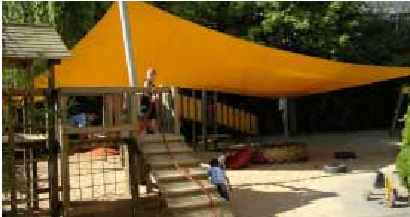
Ausreichende Schattenbereiche sind notwendig, um die Hitzeeinwirkung zu reduzieren und gegen schädigende UV-Bestrahlung zu schützen. Sonnensegel u.ä. machen Teile des Geländes zudem unabhängig vom Wetter nutzbar