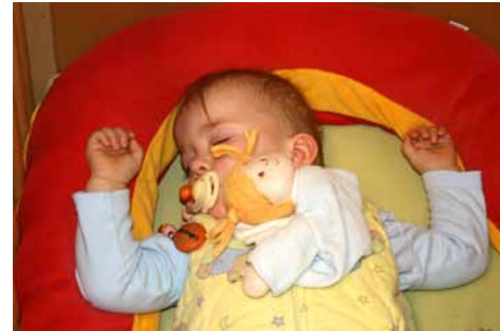
Feste Schlafplätze und -rituale vermitteln das Gefühl von Geborgenheit

Die kindliche Entwicklung benötigt gleichermaßen Bewegung wie Entspannung. Ruhe ist notwendig, damit das Kind die aus der Betriebsamkeit des Alltags gewonnenen Reize und Einflüsse verarbeiten kann. Gemessen an den langen Betreuungszeiten sind Schlaf- und Ruheräume ein notwendiger Standard. Sie bieten Kindern darüber hinaus während des gesamten Tages Rückzugsbereiche und die Möglichkeit an, alleine oder mit anderen Kindern zur Ruhe zu kommen. Kinder, die sich lange in der Einrichtung aufhalten, wollen wissen, wo ihr Platz zum Schlafen ist. Sie brauchen verlässliche Schlafrituale und „müssen sich im Raum wohl und geborgen fühlen, damit sie beruhigt loslassen und entspannt