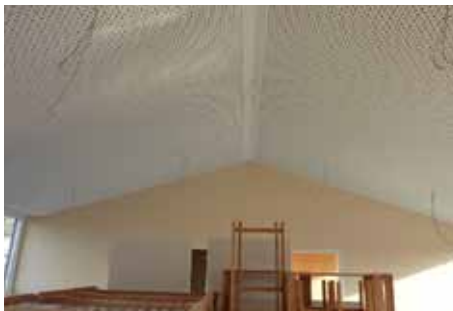
Beispiel für Schall absorbierendes Deckenmaterial in einer nachträglich raumakustisch sanierten Kindertageseinrichtung

Hohe Lärmpegel, in Verbindung mit schlechten raumakustischen Bedingungen in Kindertageseinrichtungen können zu einer überdurchschnittlichen Belastung der Fachkräfte und Kleinkinder führen. Je jünger die Kinder sind, desto störanfälliger sind sie für ungünstige Hörbedingungen und desto sensibler reagieren sie auf laute Geräusche. Zahlreiche Studien weisen darauf hin, dass erhöhte Geräuschpegel und Nachhallzeiten die Sprachentwicklung der Kleinkinder beeinträchtigen, weil die Sprachverständlichkeit leidet. Darüber hinaus ist deren späterer Schriftspracherwerb erschwert. Um unzulässige Lärmbedingungen in innen liegenden Aufenthaltsbereichen von Kindertageseinrichtungen zu vermeiden, sind daher entsprechend der Nutzung raumakustische Maßnahmen einzuhalten. Ruhe- und Rückzugsorte gewinnen in diesem Zusammenhang für die Kinder und Fachkräfte einen hohen Stellenwert.