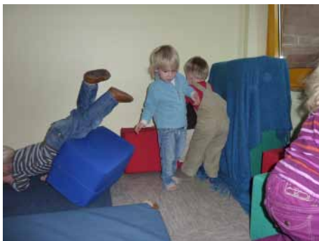
Gestalten und verändern, ein Bedürfnis aller Kinder