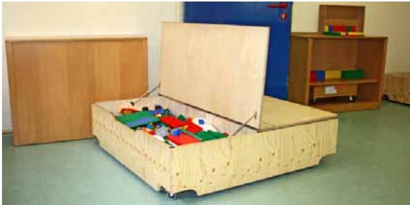
Ein fahrbares Podest mit Stauraum erlaubt Flexibilität in der Gestaltung. Die Rollen müssen feststellbar sein, es dürfen keine Klemmstellen entstehen