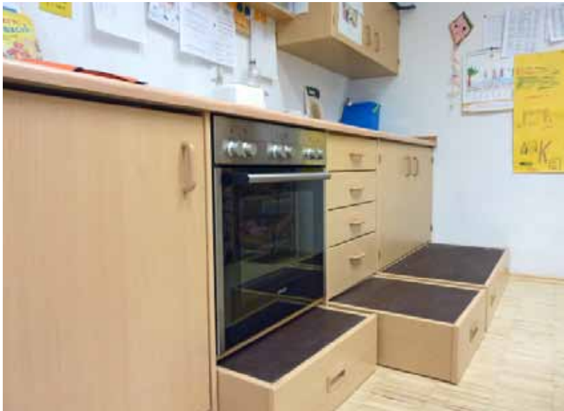
Für Erwachsene gestaltete Kücheneinrichtungen benötigen höhengerechte Standplätze für Kinder. Podeste unterhalb der Küchenzeile ermöglichen ein sicheres Helfen der Kinder