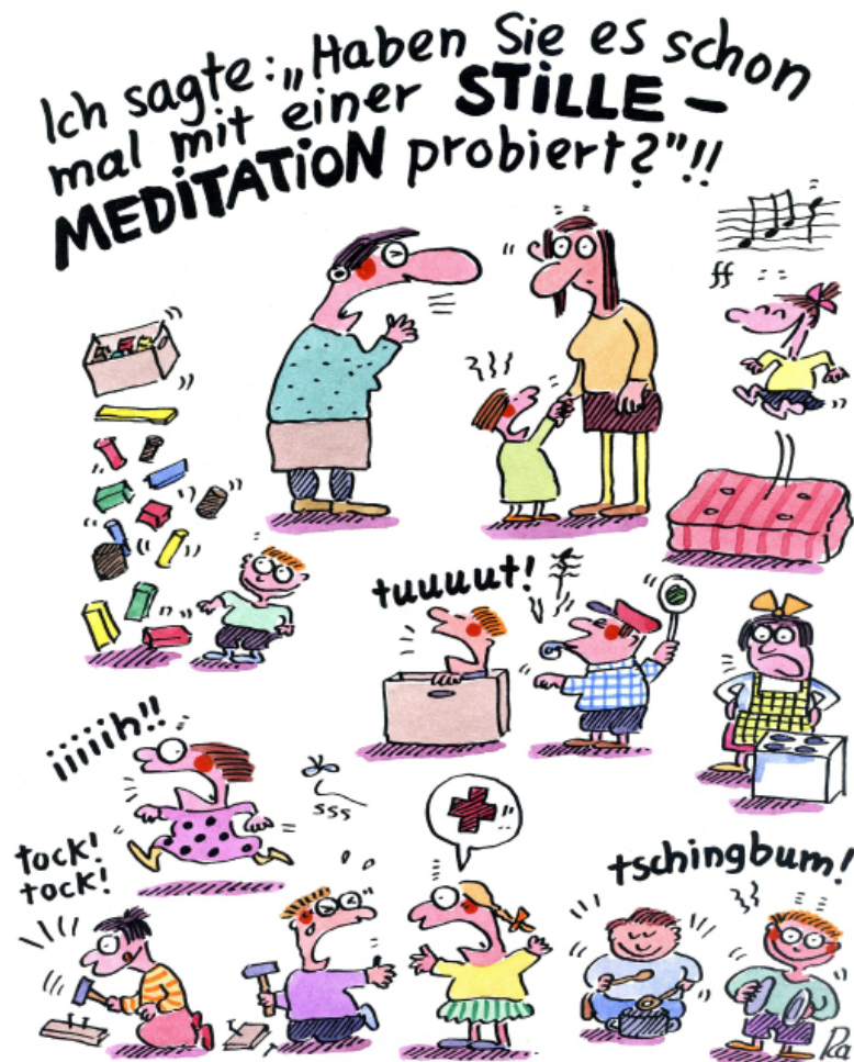
Lärmbelastungen erfordern Intervention

Zur Messung der Nachhallzeit wird der Raum mit einem lauten Geräusch (120 dB) beschallt. Nach Abschalten der Schallquelle wird der Pegelverlauf des Abklingvorganges bewertet. Definiert ist die Nachhallzeit als die Zeit, in der der Schalldruckpegel nach Beenden der Schallanregung um 60 dB abfällt. Bei einer hohen Absorption der Schallenergie im Raum geschieht dies schneller, als bei einer geringen Absorption.