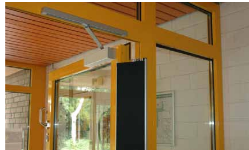
Vermeidung von Quetsch- und Scherstellen an einer Haupteingangstür durch das Anbringen von Klemmschutz an der Nebenschließkante.