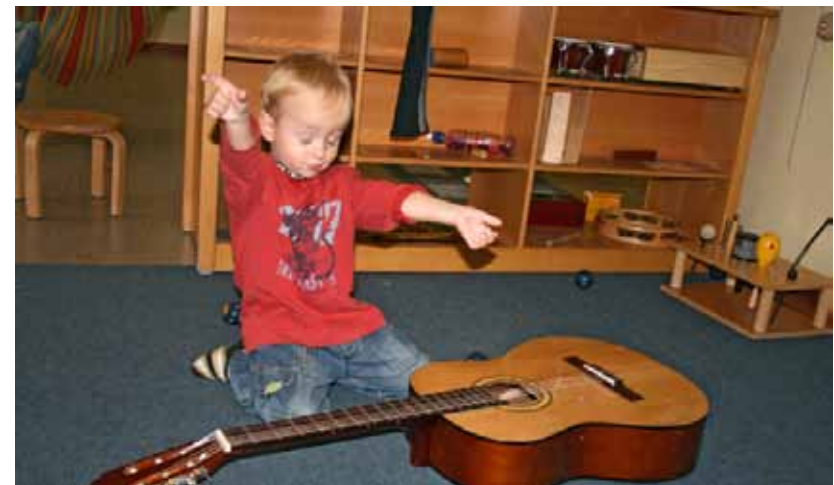
Hier kommt Freude auf: Eine Instrumentenecke bietet einen großen Anreiz für begeisterungsfähige und interessierte Kinder