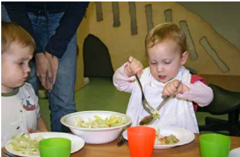
Zur Wertigkeit der Einnahme von Mahlzeiten gehört auch, den Kindern Porzellan, Gläser und Bestecke zur Verfügung zu stellen