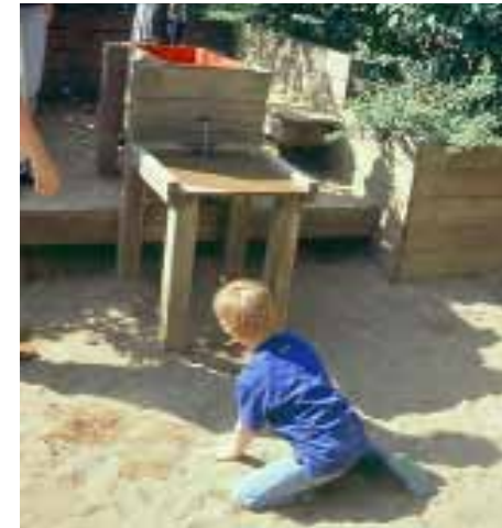
Kinder lernen in diesen Bereichen viel über die physikalischen Eigenschaften der Elemente Wasser und Sand