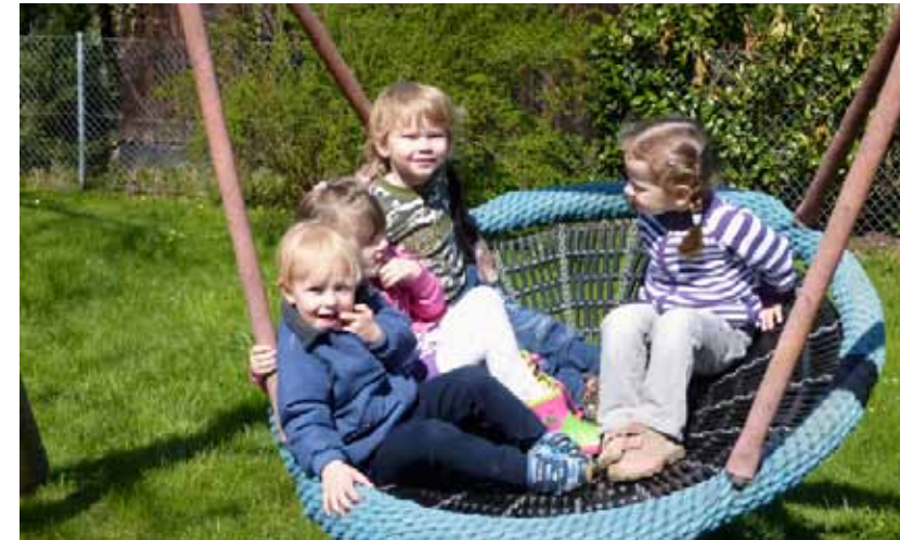
Vogelnestschaukeln ermöglichen gemeinsame Schaukelerlebnisse