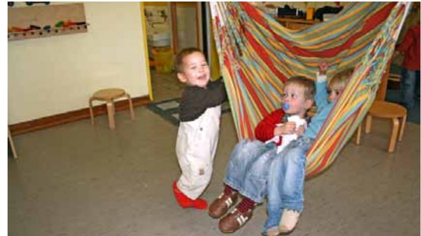
Schaukeln ist ein elementares Bedürfnis aller Kinder. In jedem Gruppenraum sollte nach Möglichkeit eine Vorrichtung für eine Hängematte und ausreichend Platz vorhanden sein