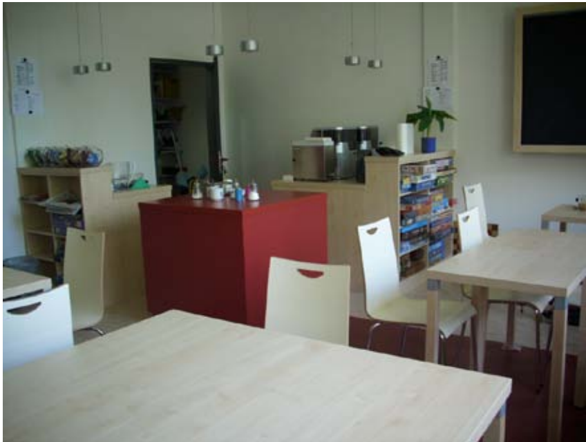
Das Café-Atempause in 25.23.U1.63 (AStA-Gebäude) lädt zum gemütlichen Verweilen ein.