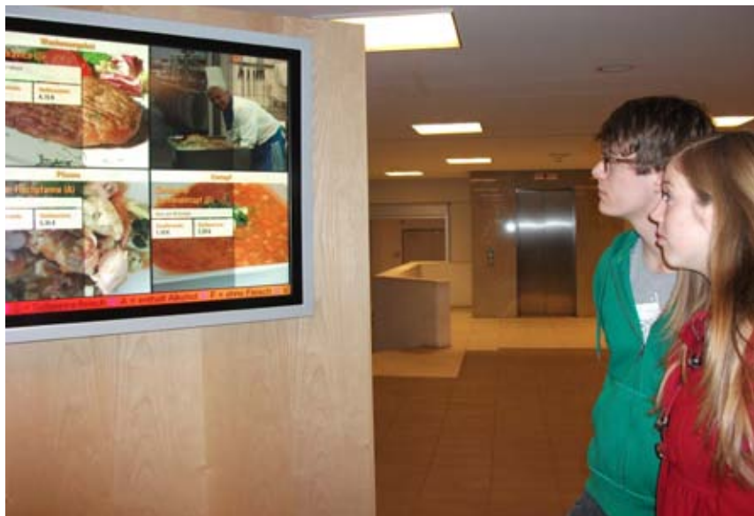
Die neuen Mensapreise sorgen für Unmut unter den Studierenden

Dass die Aktion ohne Ankündigung und Information vorgenommen wurde, macht es außerdem nicht gerade glaubwürdiger und verständlicher. Gerade diese großen Preissprünge erscheinen sehr intransparent. Mein Fazit: Wer nicht informiert muss nun auch mit dem (möglicherweise unberechtigten) Unmut der Studenten rechnen! Welche Gerichte billiger geworden sind, wird übrigens auch nirgendwo erwähnt!“