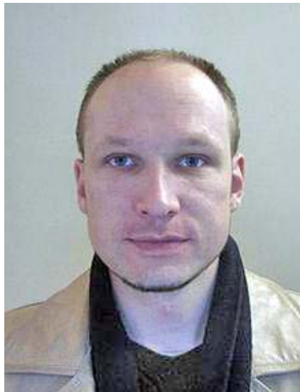
Anders Behring Breivik

Projekten, Parteien, Verbänden oder Jugendorganisationen engagierten und involvierten Jugendlichen - ermorden können. Unabhängig von anderen politischen Unterschieden attackierte er nicht nur uns jugendliche Linke, ob grüner, roter oder dunkelroter Prägung, sondern auch Jugendliche liberaler Gesinnung, die sich für die Selbstverwirklichung jedes Individuums in unserer Gesellschaft einsetzen. Auch wenn wir uns bei anderen politischen oder wirtschaftlichen Themen ewig die Haare raufen mögen, ist in diesem Punkt, egal welcher politischen Jugendorganisation wir uns auch verbunden fühlen, unsere Einheit wichtig. Menschen dort starben, wegen der Überzeugungen für die wir leben - und jetzt erst recht leben müssen. Sie starben, aufgrund ihres Engagements, für eine bessere Welt.