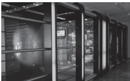
Technik, wie hier „Brennstoffzellen“, wird erlebbar gemacht.

Dialog ist Trumpf beim IdeenPark: Meinungsbildung und offener Austausch mit Führungspersonlichkeiten aus Bildung, Politik und Wirtschaft spielen eine zentrale Rolle. Mehrere hundert Wissenschaftler, Forscher, Ingenieure und Pädagogen kümmern sich beim IdeenPark um die Besucher, zeigen Experimente und erklären ihre Projekte.