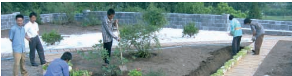
Küstners in China