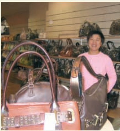
Firma Dong Xing