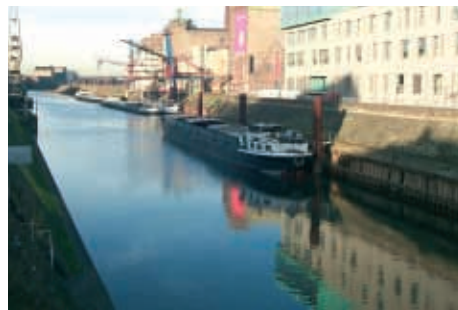
Neuss Düsseldorf Hafen