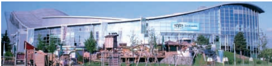
Jever Skihalle NEUSS