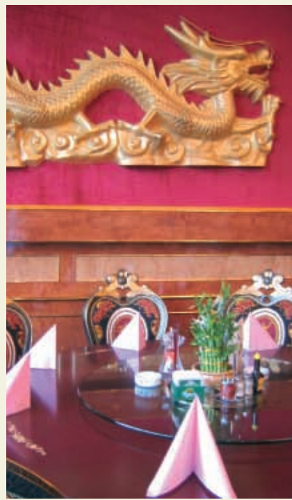
China Restaurant Shanghai

诺伊斯市中餐馆的名字: 北京花园酒家 Peking Garden 中国城酒家 Chinatown 翡翠花园酒家 Chinarestaurant Jade Garten 中国香港酒家 China Hongkong 中国酒楼 Restaurant China 新上海酒家 Neu Shanghai.