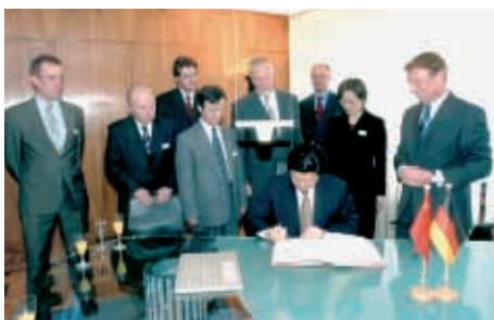
Gründungstag 2002 in Bochum