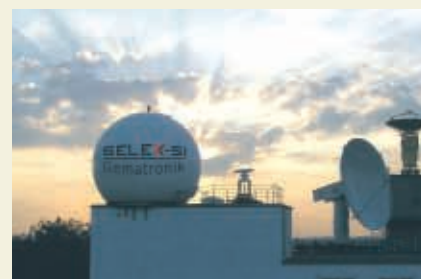
Radaranlage in Neuss