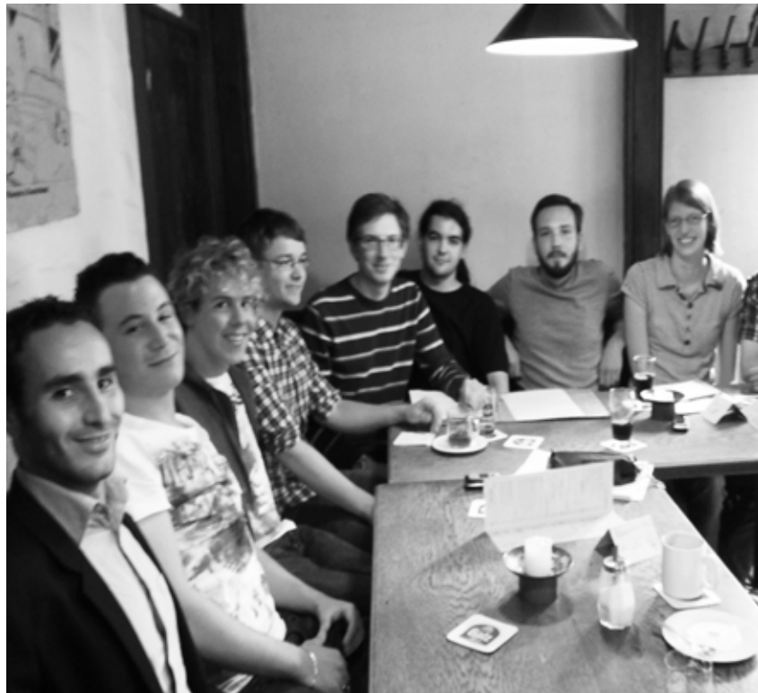
Der Führungszirkel der Jusos beim Treffen im Bilker „Tigges“.