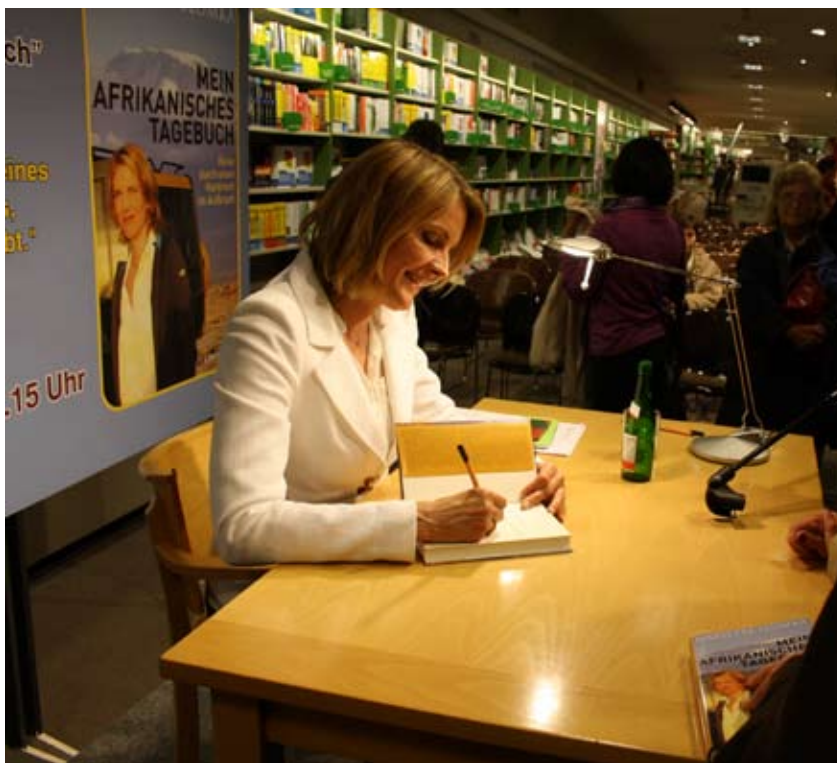
Beim Signieren ihrer Bücher im Sternverlag.

So hat sie in jedem Land einen Ansprechpartner, der sie durch „seine