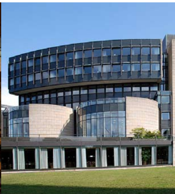
Der Landtag: Mit den Parlamentarierern, fotografiert aus der SPD-Fraktion, komplett leer und als Außenansicht

gefüllt werden will. Statt politischer Botschaften macht er Witze über den Namen des Innenministers Jäger. Kurzes Gelächter aus den sozialdemokratischen, hinteren Reihen. Kraft lacht kräftig mit, Löhrmann stimmt synchron mit ein. Ihnen ist alles recht: Hauptsache, die Linken enthalten sich.