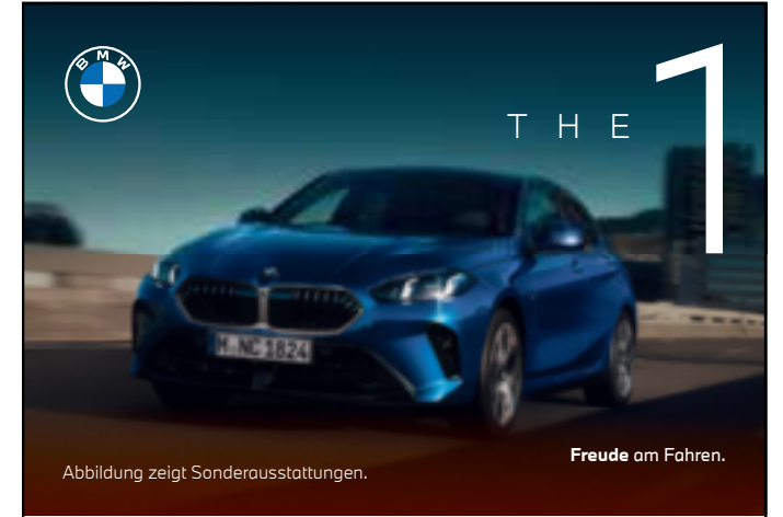
Abbildung zeigt Sonderausstattungen.

Nicht nur das Winterbaden, sondern auch Ausbrennen, Zweifel und Ängste sowie Achtsamkeit und Zuversicht spielen im Buch eine große Rolle. Nach der Lesung besteht die Möglichkeit, selbst ins achtsame Schreiben zu kommen. Die ausgebildete Schreibtherapeutin leitet dazu behutsam mit Impulsen an – Selbstfürsorge pur für Schreibanfänger:innen. Es wird um Voranmeldung gebeten; die Teilnahme kostet fünf Euro.