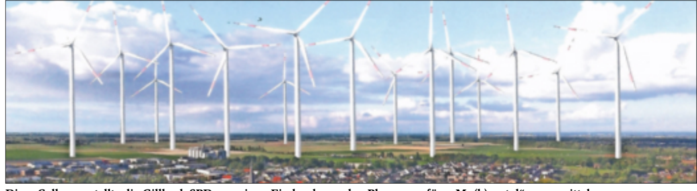
Diese Collage erstellte die Gillbach-SPD, um einen Eindruck von den Planungen fürs „Mu(h)rental“ zu vermitteln.