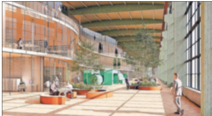
Eine RWE-Maschinenhalle und ihre künftige Nutzung in einer künstlerischen Illustration.

Flächeneigentümerin und der Zivilgesellschaft und schafft so eine hohe Akzeptanz für die Nutzungsziele und -visionen der Konversionsflächen. Zu den zukünftigen Konversionsflächen, die die PSW schon heute qualifiziert, gehören unter anderem das Neurather Kraftwerksgelände, das Areal Kraftwerk Niederaußem, der Kraftwerksstandort Frimmersdorf sowie die so genannten „Tagesanlagen“ des Tagebaus Hambach. All diese Standorte sind hervorragend infrastrukturell angebunden und eignen sich aufgrund ihrer baulichen und betrieblichen Vornutzung besonders für gewerbliche und industrielle Ansiedlungen.