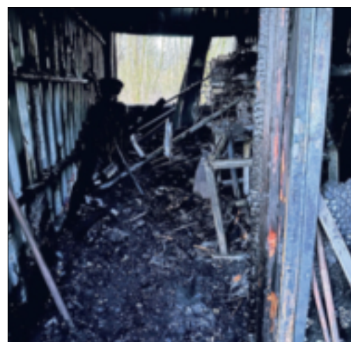
Ein Blick in den total verkohlten Container, in dem sich die „Sammlerstücke“ nur erahnen lassen.