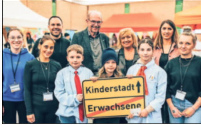
Die „Kinderstadt“ ist ein Ferienangebot des Jugendamtes für die Osterferien.

Ein weiteres spannendes Element sind die Bürgermeister-Wahlen sowie die Treffen eines selbst gewählten Stadtrates.