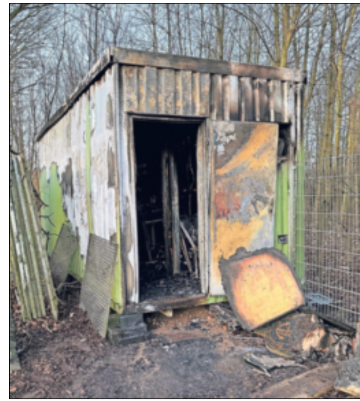
Oben der Container, der trotz des Engagements der Feuerwehr ausbrannte. Unten die Zugwappen, die zu einem Klumpen zerschmolzen.

„Im Einsatz war die hauptamtliche Wache mit dem Hilfeleistungslöschgruppenfahrzeug und dem Tanklöschfahrzeug mit sechs Einsatzkräften. Die Einheiten Stadtmitte und Wevelinghoven stellten in der Zeit eine Wachbesetzung. Einsatzende war gegen 2.30 Uhr“, schließt der Feuerwehrbericht. In Noithausen geht die Ansicht um, dass dort ein „Feuerteufel“ sein Unwesen treibe.