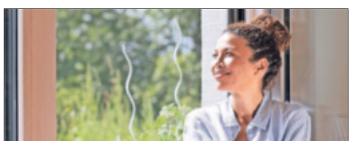
Pollenschutzfilter sind für Heuschnupfen-Geplagte eine wichtige Hilfe im Alltag.

vier Wänden so gut wie möglich fernzuhalten. Eine bewährte Maßnahme ist es, Fenster und Türen mit speziellen Pollenschutzgittern auszustatten. Hochwertige Gewebe aus dem Fachhandel sind so fein, dass sie für das menschliche Auge kaum sichtbar sind. Fachhandwerker finden für jede Fenster- und Türöffnung die passende Lösung. (-djd)