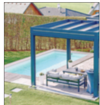
Schick und nützlich: ein Dach für die Terrasse.

schein ist der Platz unter dem geöffneten Dach ein lichtdurchfluteter und luftiger Wohlfühlort – die extrabreiten Lamellen lassen besonders viel Sonne durch. Wenn es etwas schattiger gewünscht wird, lassen sich die Lamellen per Fernbedienung oder Smart-Home-Anbindung schließen. Das verglaste Flachdach wird mit elektrischen Markisen zum Sonnenschutz. Auch eine Verwendung als Poolüberdachung ist möglich, um beispielsweise den Pool vor Verunreinigungen