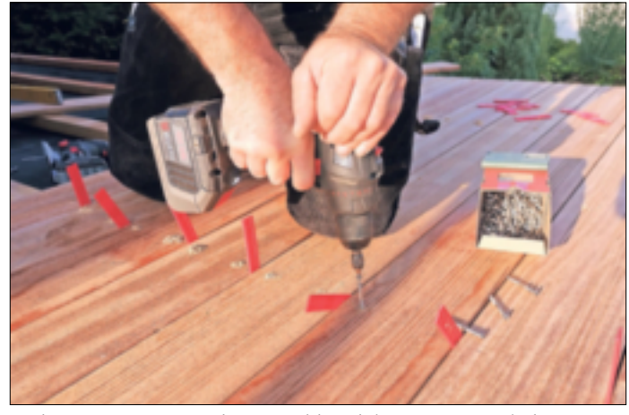
Holz zu Füßen: Für schöne und langlebige Terrassenbeläge ist das Naturmaterial oft die erste Wahl.

Grevenbroich. Ein Garten ohne Zäune, Terrassendielen oder Hochbeete aus Holz? Das wäre für die meisten Hauseigentümer kaum vorstellbar. Schließlich ist das nachwachsende Material seit langem für den Außenbereich bewährt. Es verbindet natürliche Ästhetik mit Funktionalität und kommt in verschiedenen Anwendungsbereichen zum Einsatz. Ob als Terrassenbelag, Sichtschutz, Hochbeet oder Fassadenverkleidung – die Wahl der Holzart spielt eine entscheidende Rolle für die Langlebigkeit und Widerstandsfähigkeit gegenüber Witterungseinflüssen. Eine Holzterrasse schafft eine warme Atmosphäre und fügt sich harmonisch in den Garten ein. Bewährt hat sich hier Lärchenholz, das aufgrund seiner natürlichen Widerstandsfähigkeit gegen Feuchtigkeit und Schädlinge häufig eingesetzt wird. Die aus Russland stammende Sibirische Lärche war lange eine bevorzugte Wahl, doch seit 2022 sind Importe aufgrund