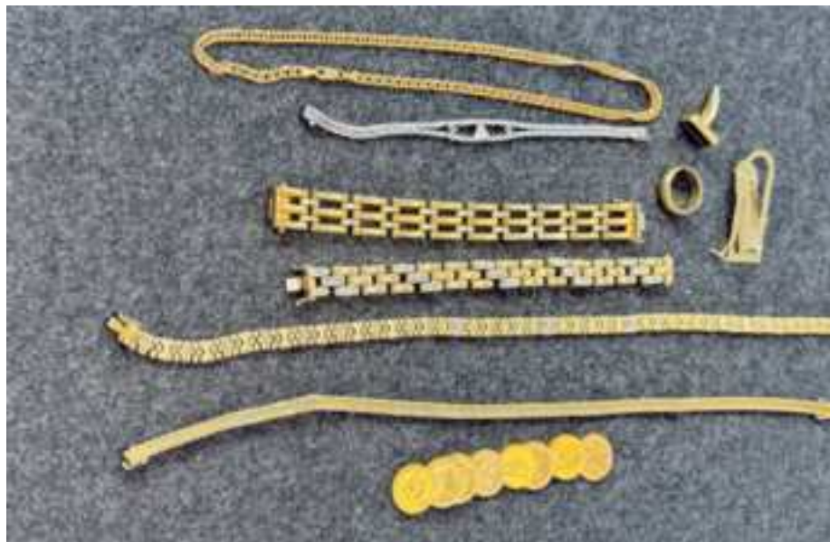
Ihr Gold ist mehr wert, als Sie denken! Dieses Bild zeigt Wertgegenstände, die Kunden erfolgreich verkauft haben – von Goldketten bis Münzen. Dank hoher Ankaufpreise und transparenter Bewertung lohnt sich der Verkauf jetzt besonders. Nutzen Sie die Gelegenheit, ungenutztes Gold in bares Geld umzuwandeln!

Das Foto, das in einer Filiale aufgenommen wurde, zeigt eine Auswahl hochwertiger Wertgegenstände, die von Kunden kürzlich verkauft wurden. Darunter befinden sich massive Goldketten, feine Manschettenknöpfe, Goldringe und mehrere Münzen aus reinem Gold. Diese Objekte sind nicht nur Erinnerungsstücke, sondern auch wahre Schätze, die zu attraktiven Preisen angekauft wurden. Laut den Experten vor Ort profitieren Verkäufer derzeit von besonders hohen Goldkursen und einer schnellen, unkomplizierten Abwicklung. Viele Menschen sind unsicher, wenn es um den Verkauf ihrer Wertgegenstände geht, da sie den genauen Wert nicht kennen. Hier wird auf Transparenz gesetzt: Alle Schmuckstücke, Münzen oder Barren werden vor den Augen der Kunden mit modernster Technik analysiert. Der Materialwert wird präzise ermittelt, ohne dass die Stücke eingeschickt werden müssen. Die Kunden erhalten auf Wunsch sofort ihr Geld – wahlweise in bar oder per Überweisung.