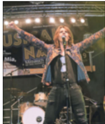
Große Auftritte werden quasi garantiert.