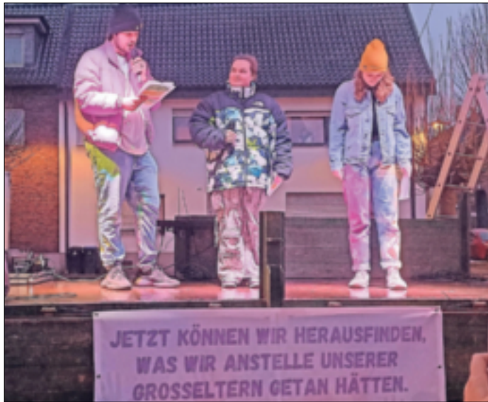
Ehrenamtler des Jugendcafés Bamm fanden starke Worte in ihrer gemeinsam verfassten Rede.

Die Ehrenamtler wurden deutlich: Sicherheit für alle komme nicht durch Hass und Hetze, was uns die Geschichte unseres Landes auf schmerzhaft Weise lehre. Jeden Tag sehe man Unmenschlichkeit, Menschen würden bedroht, weil sie die „falsche“ Sexualität, Herkunft oder Religion hätten. „Wir sind hier, weil wir diese Ungerechtigkeit nicht hinnehmen. Weil wir nicht akzeptieren, dass manche