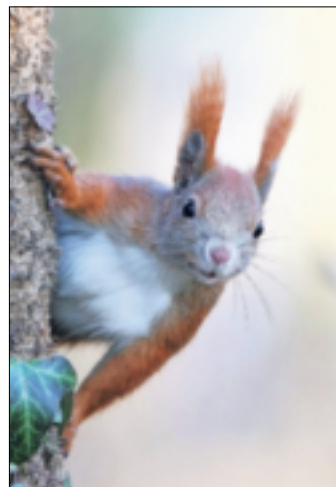
Eichhörnchen werden ebenso Thema der Seminarreihe sein wie Igel und Vögel.

Weitere Informationen und Anmeldung bei Anja Peltzer vom DRK-Kreisverband Grevenbroich, Familienbildungswerk, unter 02181/65 00 24 oder per Mail an apeltzer@drk-grevenbroich.de . Mehr auch auf der Homepage: www.drk-grevenbroich.de