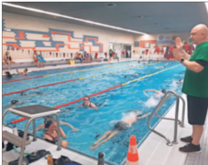
Erst Anfang des vergangenen Jahres feierte die Schwimmabteilung des TV Jüchen mit den „Beasts“ ein großes Kick-off unter dem Motto „Vom Pirat zum Beast“.