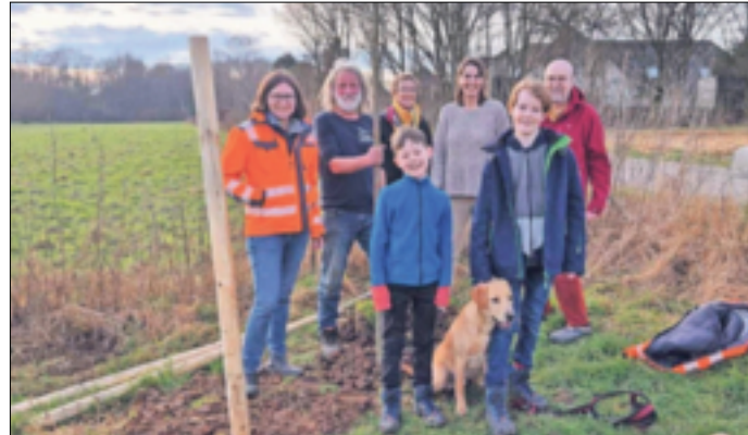
Dank Spenden können Mitglieder des NABU Jüchen mehrere neue Bäume pflanzen.

Rot Ahorn. Die über drei Meter hohen Bäume wurden von der Ortsgruppe bei schönstem Wetter in die Erde gebracht. Der NABU Jüchen ist sehr dankbar darüber, dass die Pflanzen ausschließlich über Spenden finanziert werden konnten.