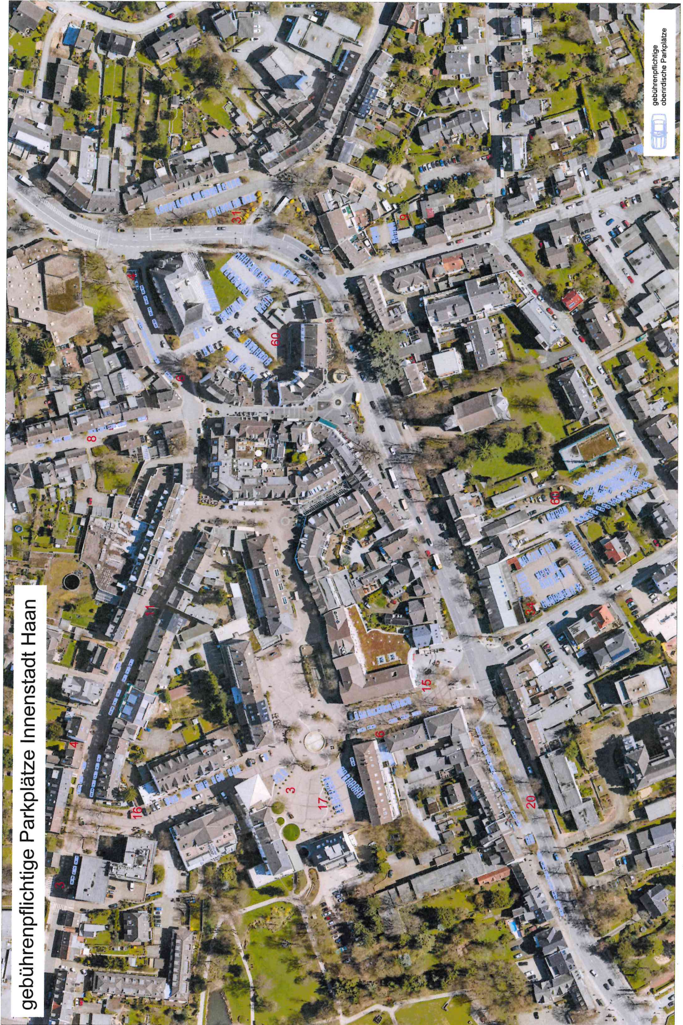
gebührenpflichtige Parkplätze Innenstadt Haan

gebührenpflichtige oberirdische Parkplätze