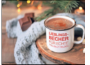
Jede Blutspende wird mit einem Emaillebecher belohnt.