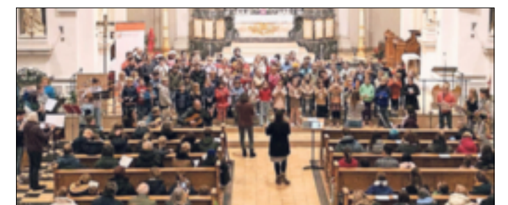
In der Pfarrkirche „St. Stephanus“ in Elsen fand eines der gut besuchten Mitsingkonzerte der Musikschule im Rhein-Kreis im Advent statt.