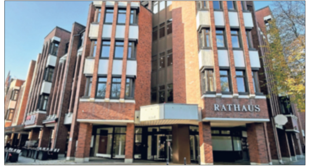
Wie soll die Zukunft der City aussehen?

Grevenbroich. Wie soll die Innenstadt von Grevenbroich in Zukunft aussehen? Diese Frage steht im Mittelpunkt des Projekts „Rahmenplanung Innenstadt Grevenbroich“. Das Ziel: Die Innenstadt lebendig, attraktiv und zukunftsfähig gestalten. Am Dienstag, 9. Januar, lädt das Stadtplanungsamt zusammen mit dem beauftragten Planungsbüro „De Zwarte Hond“ alle interessierten Bürger zu einem Abendspaziergang ein. Die Veranstaltung beginnt um 17.30 Uhr im Bernadussaal (Am Markt 3) mit einer kurzen Projektvorstellung. Danach folgt ein gemeinsamer Spaziergang in Kleingruppen durch die Innenstadt, bei dem Ideen und Anregungen gesammelt werden. Am Vormittag sind bereits Schüler eingeladen, ihre Perspektiven im Rahmen eines Stadtspaziergangs einzubringen. Jeder kann die Gelegenheit nutzen, aktiv