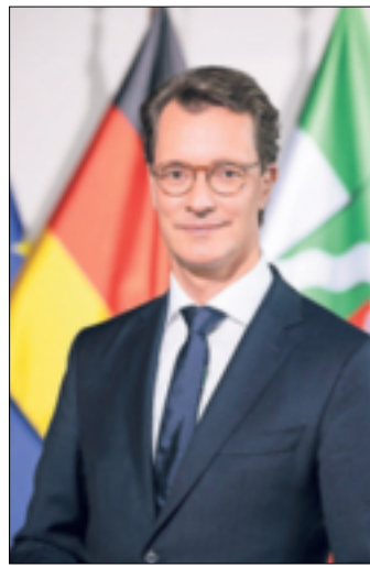
Ministerpräsident Hendrik Wüst schreibt exklusiv für den Erft-Kurier.

Potenziale sind enorm. Durch KI könnte allein in Deutschland die gesamte Wertschöpfung um 330 Milliarden Euro erhöht werden. Deshalb haben wir uns in Nordrhein-Westfalen auf den Weg in die Zukunft gemacht: von der Kohle zur KI. Hier in der Region wird das besonders deutlich: Milliarden-Investitionen treiben den Wandel im „Rheinischen Revier“ voran. Die Hyperscaler-Rechenzentren, die hier entstehen, sind für die digitale Infrastruktur in ganz Deutschland ein Meilenstein. Am ehemaligen Kohlekraftwerk Frimmersdorf wird die frühere Kohleinfrastruktur für Digital- und Technologieprojekte neu genutzt. Daraus entsteht eine gute Perspektive für die Region. Das zeigt, wie man beides schafft: Klima schützen und zugleich gute Arbeitsplätze, Wohlstand