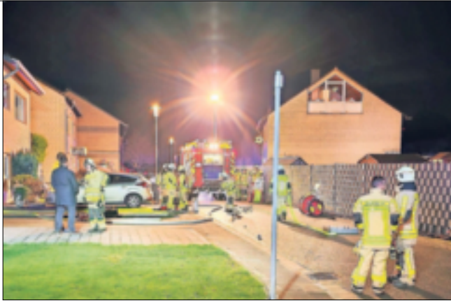
Rund 30 Einsatzkräfte waren am Sonntagabend im Einsatz, um den Kellerbrand, ausgelöst durch eine Waschmaschine, zu löschen.