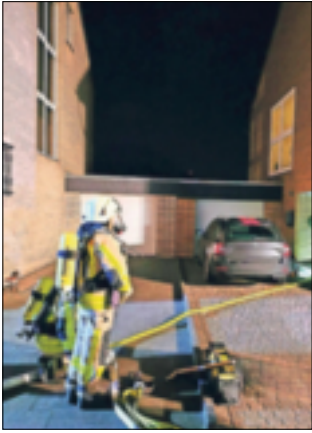
Der Einsatz an der Straße Am Blutgraben in Frimmersdorf verlief glimpflich.

Frimmersdorf. Glimpflich verlief am Sonntagabend, 22. Dezember, ein Kellerbrand an der Straße Am Blutgraben in Grevenbroich-Frimmersdorf. Gegen 18.50 Uhr alarmierte die Kreisleitstelle die Kräfte der Feuerwehr Grevenbroich zu dem Einfamilienhaus. Die Bewohner hatten einen Brand an ihrer Waschmaschine im Keller des Einfamilienhauses festgestellt. Verletzt wurde niemand.