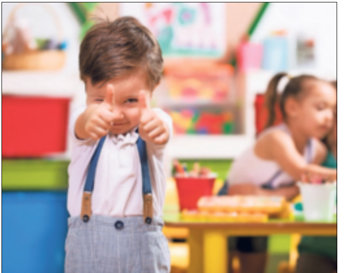
Das Jugendamt Rhein-Kreis Neuss lädt interessierte Eltern zu einer Info-Veranstaltung über Kindertagespflege ein.