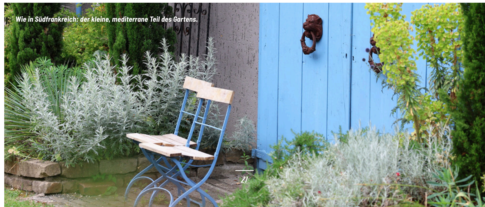
Wie in Südfrankreich: der kleine, mediterrane Teil des Gartens.

www.offene-gaerten-westfalen.de/gaerten/garten-ulbrich