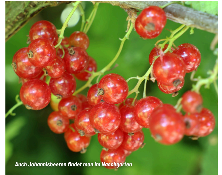
Auch Johannisbeeren findet man im Naschgarten