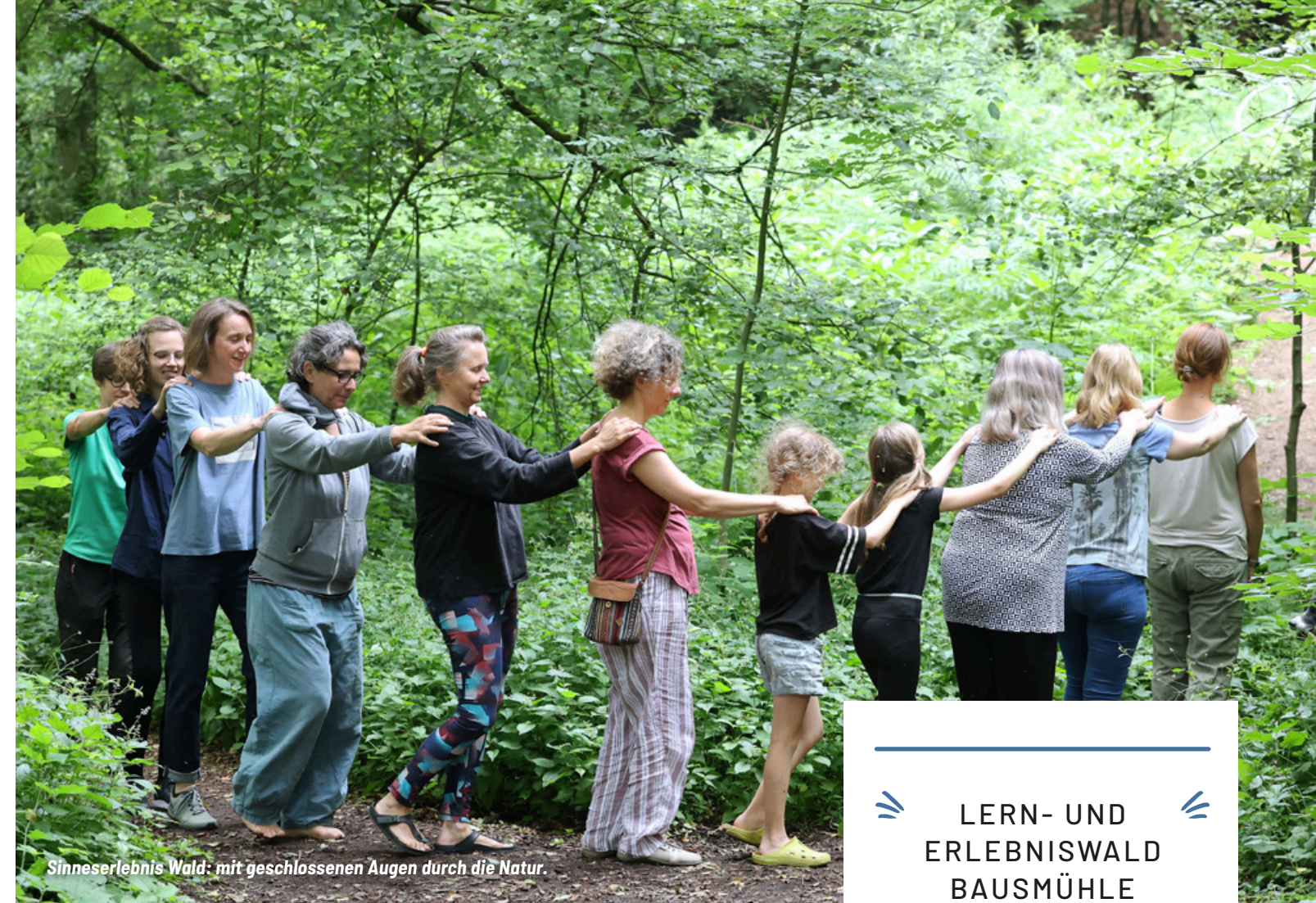
Sinneserlebnis Wald: mit geschlossenen Augen durch die Natur.