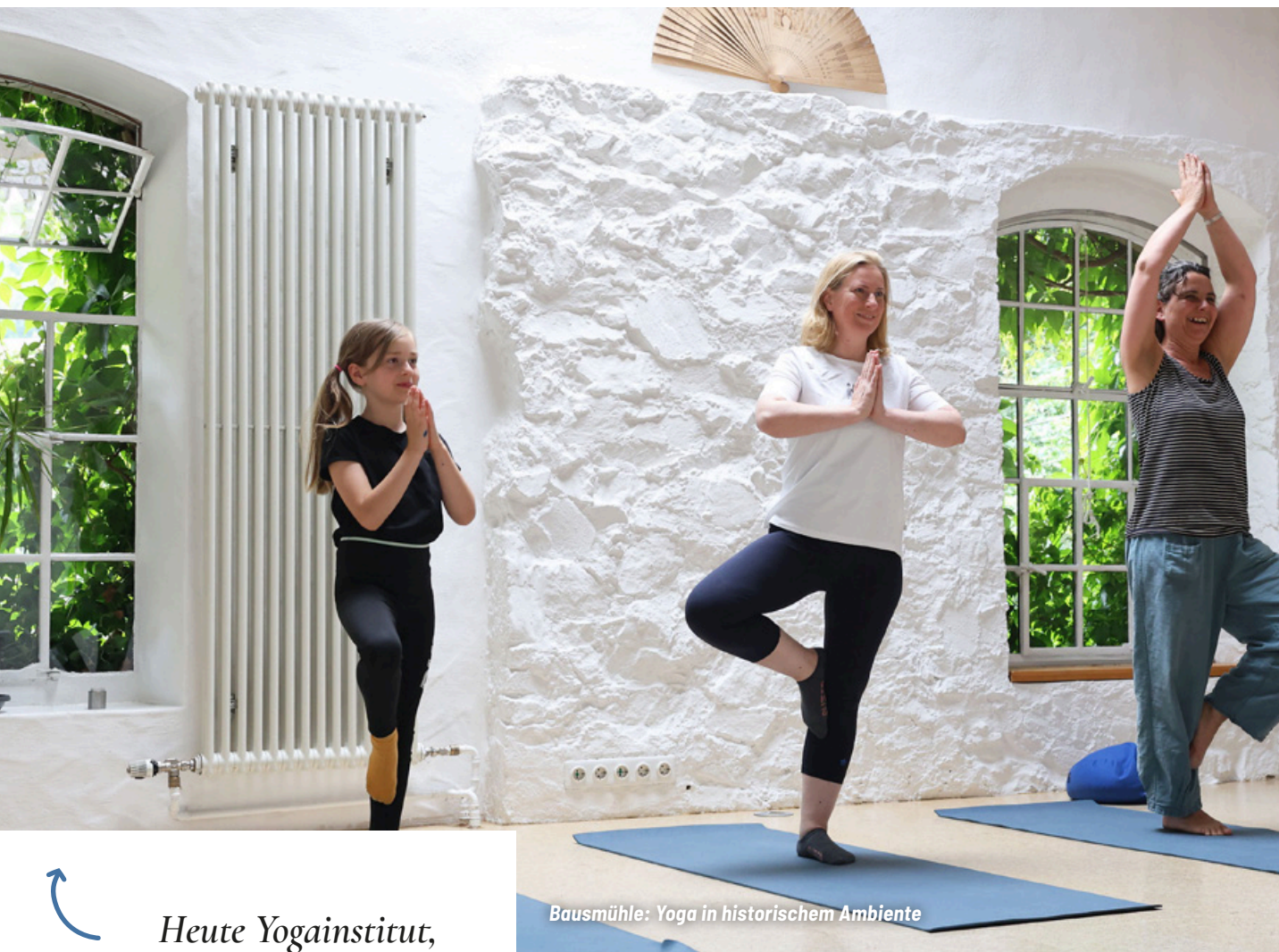
Baumühle: Yoga in historischem Ambiente