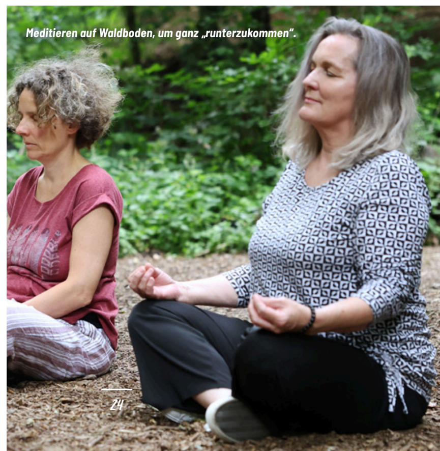
Meditieren auf Waldboden, um ganz „runterzukommen“.

jede Menge Termine, die allein dem Nachwuchs vorbehalten sind, etwa die Wald-Spielgruppen, die Bienenschule, das Basteln mit Naturmaterialien und der „Schnitzführerschein“. Alles Angebote, die auch gern für Kindergeburtstage in der Baumühle angefragt werden!