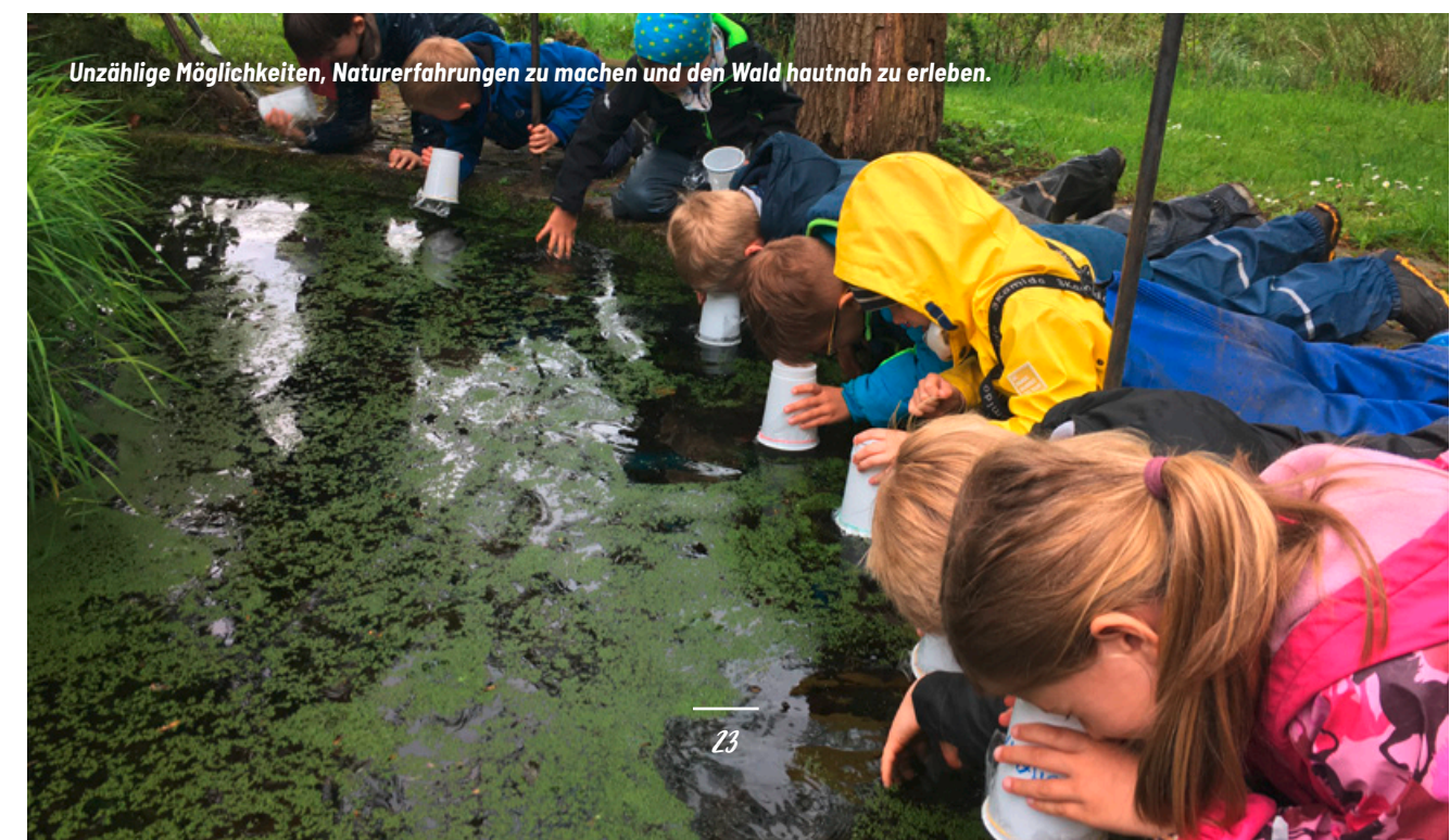
Unzählige Möglichkeiten, Naturerfahrungen zu machen und den Wald hautnah zu erleben.