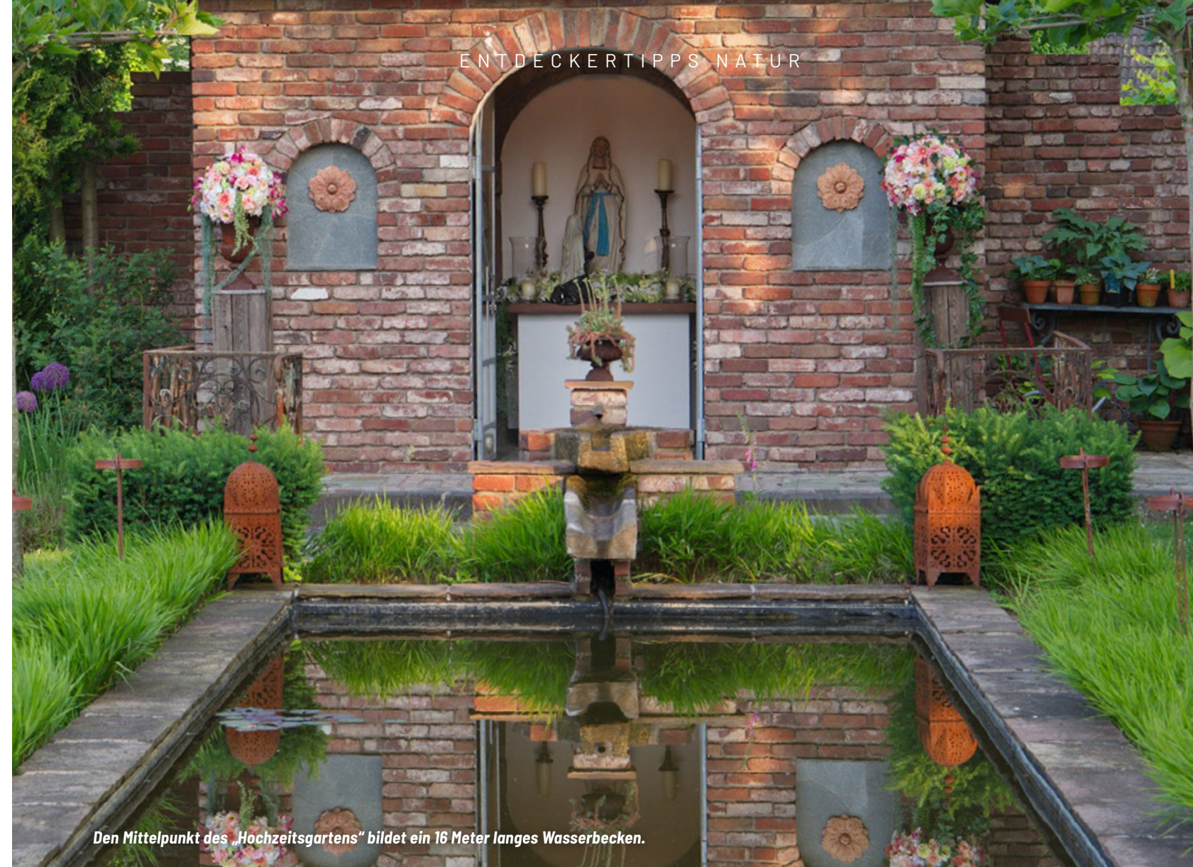
Den Mittelpunkt des „Hochzeitsgartens“ bildet ein 16 Meter langes Wasserbecken.

becken, das aus einem Elsässer Kloster hierhergebracht und stilvoll integriert wurde. Überall finden sich auch Skulpturen – hier klassische englische Büsten, dort solche von Engeln, mythischen Wesen oder von Ganesha, dem Hindugott mit Elefantenkopf. Und dazwischen stolzieren zwei Pfau – Enza und Luigi – umher.