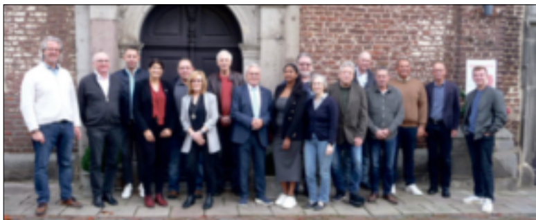
Die CDU-Fraktion Jüchen traf sich im Nikolauskloster zur Haushaltsklausur.

Die Stadt wird zeitnah die Auswirkungen der Erhöhung der Kreisumlage klären, damit bis zur nächsten Ratssitzung eine Aussage getroffen werden kann, welche Möglichkeiten zur Verhinderung des HSK gegeben sind.