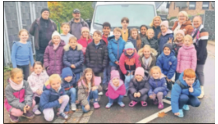
Die Kids der Konferenz übergaben stolz die Süßigkeiten an Mitarbeiter der Tafel.

Privatankauf: Kleidung aller Art, Pelze, Möbel, Handtaschen, Näh-/Schreibm., Geweihe, Lampen, Militaria, Kameras, Porzellan, Puppen, Krüge, Bleikristall, Teppiche, Gemälde, Zinn, Bücher, LP's, Römergläser, Silberbesteck, Münzen, Bernstein, Schmuck, Uhren, Nachlässe, kostenlose Hausbesuche. Fa. Sabine Traber ☎ 0163/4482746