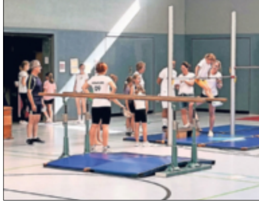
Ob draußen oder drinnen, es gibt ein sportliches Programm für die ganze Familie.