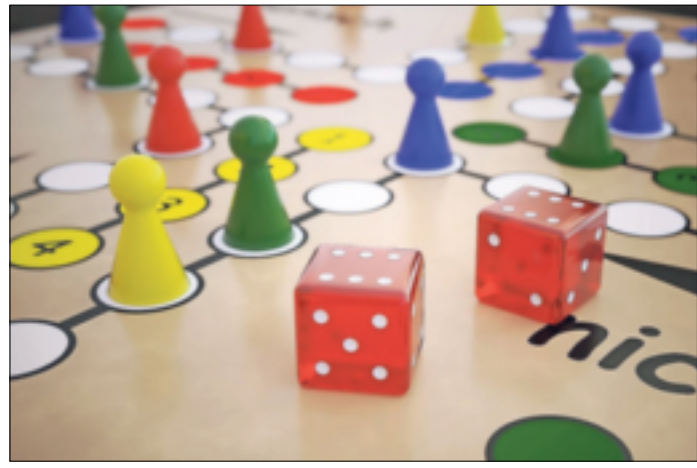
Es darf wieder gespielt werden!