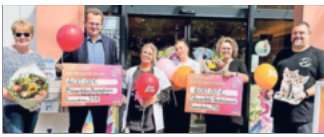
Die Bürgerstiftung Rommerskirchen konnte jetzt eine Spende für ihre Arbeit entgegen nehmen.