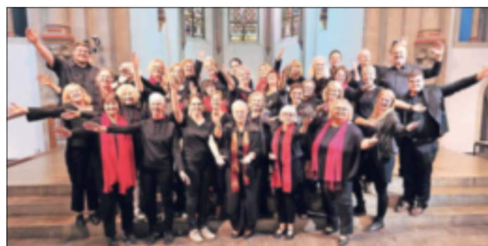
Die „RokiVoices“ laden zu einem außergewöhnlichen Konzert in die Samariterkirche ein.

nur in Klang, sondern auch mit Lichttechnik in Farbe getaucht, was für ein tolles Ambiente sorgen wird. Mit professionellen Technikern und einer motivierten Band wollen die RokiVoices den Besuchern einen unvergesslichen Abend bereiten, der mit Fingerfood und Getränken ausklingen wird. Der Eintritt ist an diesem Abend frei, Spenden, die der Finanzierung des Abends dienen, sind willkommen. Der Einlass beginnt um 18 Uhr. Plätze können reserviert werden unter platzreservierung-konzert@gmx.de . Weitere Infos sind auf der Homepage des Chores unter www.rokivoices.de zu finden.