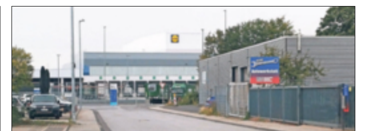
Das Industriegebiet Ost in Grevenbroich.