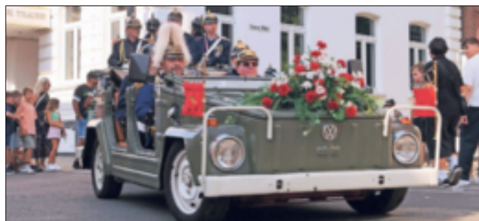
Die Temperaturen während des Schützenzuges am Sonntag verlangten sowohl den Zuschauern als auch den Schützen einiges ab, dafür gab es jede Menge zu sehen.