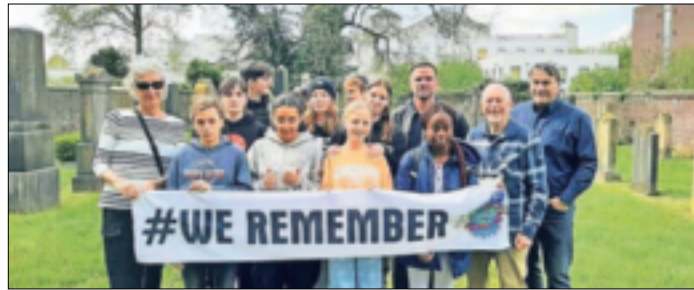
„KKG – Gegen das Vergessen“ und der Geschichtsverein Grevenbroich laden auf den jüdischen Friedhof ein.

Grevenbroich/Rommerskirchen. Am morgigen Sonntag, 8. September, findet wieder der „Tag des offenen Denkmals“ statt, die größte Kulturveranstaltung Deutschlands. Seit 1993 wird sie von der Deutschen Stiftung Denkmalschutz (DSD), die unter der Schirmherrschaft des Bundespräsidenten steht, bundesweit koordiniert. Der Tag des offenen Denkmals ist eine geschützte Marke der Deutschen Stiftung Denkmalschutz.