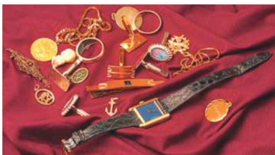
Viele Kunden verkaufen ihre Goldstücke unter Wert, weil der Händler nicht die richtige Analysemethode verwendet. Bei der Goldbörse GmbH profitieren Sie von modernster Analysetechnik, die dazu führt, dass Sie einen angemessenen Wert für Ihr Edelmetall erhalten!

Neuss/Kaarst In Deutschland werden Jahr für Jahr viele Milliarden Euro an Gegenwert vererbt und Wertgegenstände wechseln so den Eigentümer. Das gilt für alle möglichen Werte, angefangen von Guthaben auf Bankkonten, Bargeld, Immobilien und verschiedene Sachwerte, zu denen unter anderem Edelmetalle zählen. Diese werden in den unterschiedlichsten Formen vererbt, beispielsweise als Barren, Münzen, Schmuck und Uhren. Für die meisten Erben haben zum Beispiel Schmuckstücke aus Gold neben dem reinen Materialwert einen Erinnerungscharakter und somit einen hohen ideellen Wert.