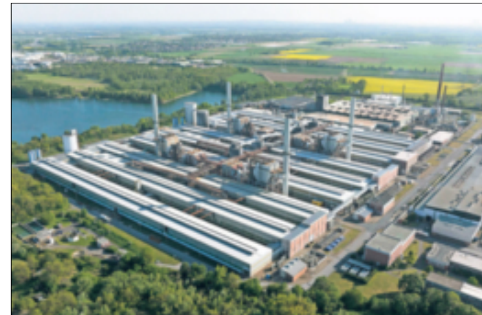
Das Rheinwerk ist das industrielle Herz des Gewerbegebietes Ost in Grevenbroich.

Grevenbroich. Unsere Stadt punktet mit hoher Lebensqualität, ist aber gleichzeitig auch ein bedeutsamer Industriestandort in der Region. Zahlreiche Gewerbegebiete wie das Industriegebiet an der Merkatorstraße, der „Industriepark Elsbachtal“ sowie die Gewerbeflächen an der ehemaligen Zuckerfabrik prägen das Stadtbild. Auch in den Stadtteilen Wevelinghoven und Kapellen sowie auf dem Areal des Kraftwerks in Frimmersdorf finden sich wichtige Industriestandorte. Über 200 Betriebe haben im Industriegebiet-Ost ihren Sitz, darunter namhafte Unternehmen wie der Aluminiumhersteller „Speira“, der Kohlestoffhersteller „Tokai Erftcarbon“ sowie die Einzelhandelskette „Lidl“ und die Deutsche Post. Diese