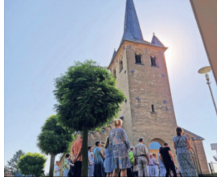
Sankt Briktius Oekoven war bereits beim Tag des offenen Denkmals 2023 ein Besuchermagnet.