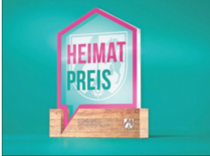
Der Heimat-Preis wird auch in Grevenbroich für besonderes Engagement um die lokale Heimat verliehen.

Die Stadt Grevenbroich freut sich, zum sechsten Mal den Heimatpreis ausloben zu können. Dieser wird im Rahmen des Förderprogramms „Heimat. Zukunft. Nordrhein-Westfalen. Wir fördern, was Menschen verbindet.“ vom Land Nordrhein-Westfalen unterstützt.