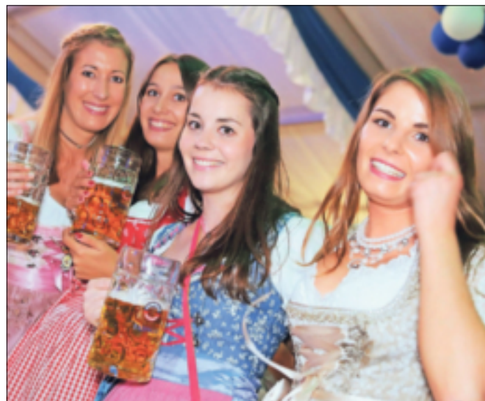
O'zapft is! Das größte Oktoberfest im Rhein-Kreis wird in Rommerskirchen gefeiert.

befürchten für das nächste halbe Jahr einen deutlichen Rückgang an Aufträgen und Umsätzen. IHK-Chef Jürgen Steinmetz weiß: „Unsere Region steht vor großen Herausforderungen. Da sind natürlich zum Einen die geopolitische Situation, gestiegene Zinsen, die Frage der sicheren Energieversorgung – und diese Liste ließe sich noch lange fortführen. Was aber noch hinzukommt, ist der Strukturwandel. Was passiert nach dem Braunkohleausstieg?“ Lesen Sie weiter auf Seite 5