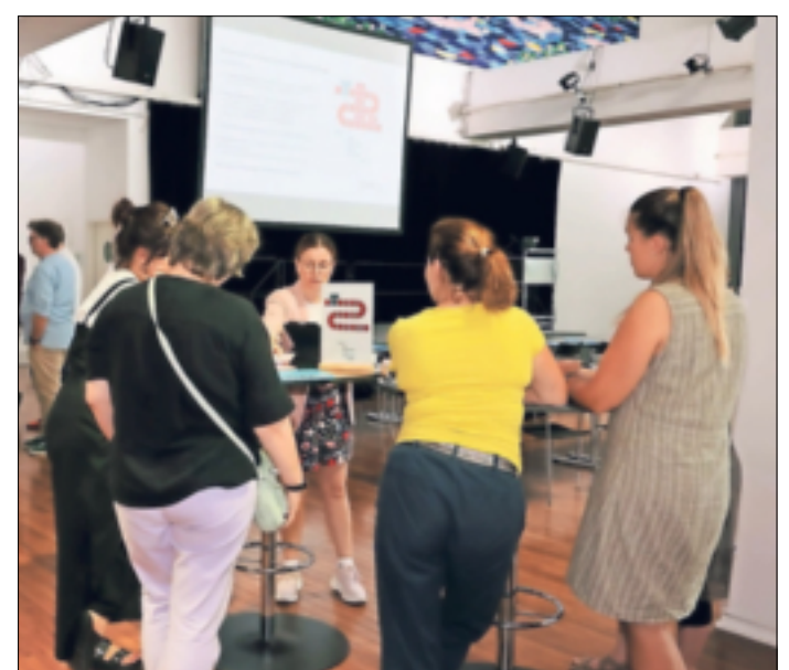
Lehrkräfte informierten sich beim Info-Tag der Kommunalen Koordinierung über Möglichkeiten, Jugendliche bei der Berufsorientierung zu unterstützen.