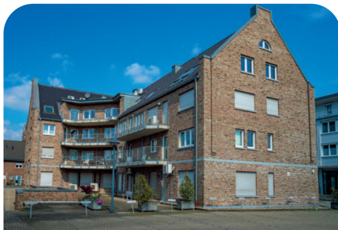
Das Eckhaus der WöGE Ruhr in Hückingen ist in ausgezeichnetem Zustand.