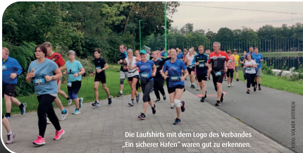
Die Laufshirts mit dem Logo des Verbandes „Ein sicherer Hafen“ waren gut zu erkennen.