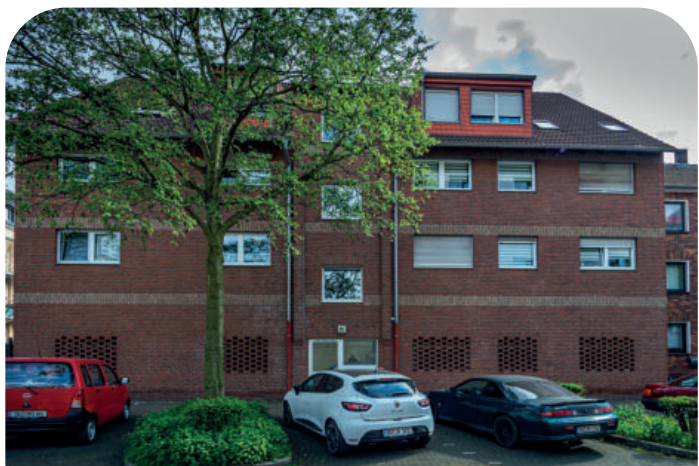
Das WOG Ruhr Haus an der Zwinglistraße findet sich im Duisburger Stadtteil Laar.

Die Namensnennung zur Sonderburger und zur Düppel-Straße muss im Zusammenhang mit dem preußisch-dänischen Krieg von 1864 gesehen werden. So ist Sonderborg eine Stadt am Alsensund in Dänemark. In unmittelbarer Nähe liegt die Düppelner Schanze, wo im Grunde die Entscheidungsschlacht in dem Kriegsgeschehen stattfand. Die beiden Straßen in Duisburg wurden beide im Jahr 1897 umbenannt und sollten wahrscheinlich die Freude über den Sieg in dieser Auseinandersetzung zum Ausdruck bringen. Auch die parallellaufende Alsenstraße muss in dem gleichen Zusammenhang aufgeführt werden. Für die damalige Umbenennung war jedoch nicht Duisburg zuständig, sondern die Stadt Meiderich, die 1894 das Stadtrecht erhalten hatte. Erst seit 1905 gehört Meiderich zu Duisburg. Das Eckhaus der WOG Ruhr an Düppel- und Sonderburger Straße präsentiert sich heute als verklinkertes, viergeschossiges Gebäude, dass insgesamt 19 Wohneinheiten verinnerlicht.