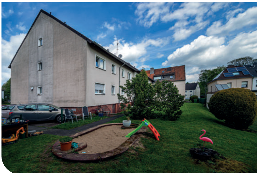
Hinter den Häusern an der Freiherr-vom-Stein-Straße gibt es viel Grün zur Entspannung.

Das Haus der Wohnungsgesellschaft Ruhrgebiet an der Zwinglistraße 21 könnte auch durchaus an der Rolandstraße stehen, hätte eine Polizeiverordnung von 1939 die doppelt vorhandene Straßennamen nach der Eingemeindung Hamborns nicht beseitigt. Warum man auf den Schweizer Kirchenreformer Huldrych Zwingli als Namensgeber kam, ist unbekannt. Vielleicht liegt es daran, dass die Zwinglistraße von Westen kommend an die evangelische Kirche stößt. Falls dies der Grund war, muss festgestellt werden, dass dies keine gute Begründung war. Denn obwohl Zwingli ein Kirchenreformer war, war er sich in we-