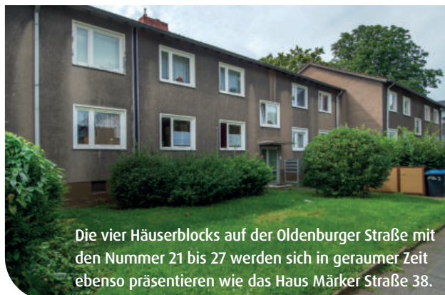
Die vier Häuserblocks auf der Oldenburger Straße mit den Nummer 21 bis 27 werden sich in geraumer Zeit ebenso präsentieren wie das Haus Märker Straße 38.