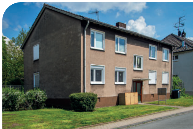
Das ist ein- und dasselbe Haus: Man kann es gar nicht glauben.

Und jetzt geht es weiter. Nach den positiven Erfahrungen mit dem Umbau Märker Straße, geht es übers Eck weiter. Die Häuser an der Oldenburger Straße 21 bis 27 werden im kommenden Jahr in der Art des Umbaus Märker Straße in Angriff genommen.