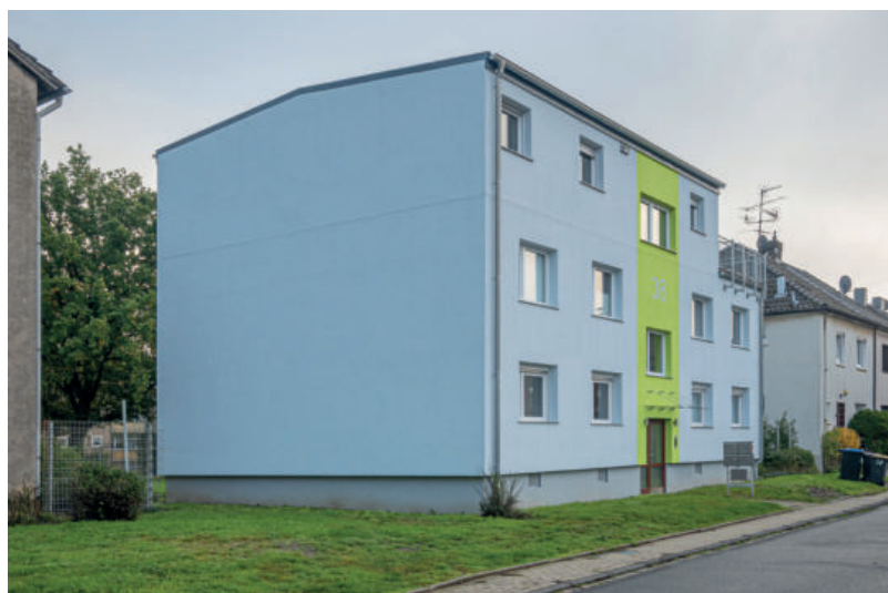
Besonders die kleine Dachterrasse auf der rechten Hausseite gibt dem Ursprungshaus aus den 50er Jahren einen besonderen Charme.