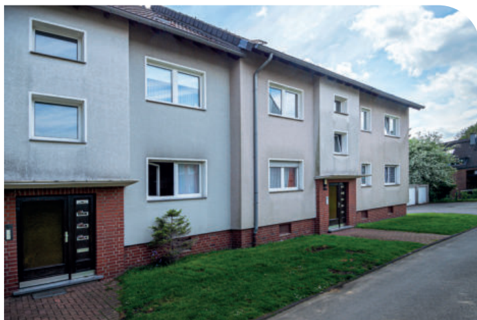
Die Häuser der WöGE Ruhr an der Freiherr-vom-Stein-Straße bieten in Mülheim guten Wohnkomfort.

Staaten auf dem Wiener Kongress gehört wurden. Am besten kann man den Freiherren wahrscheinlich als Kind seiner Zeit verstehen. Erste Ideen, der noch nicht begonnenen Aufklärung mit Selbstständigkeit sowie Bildung der Bürger und einem Nationsbegriff, der sich nicht auf ein gottgewolltes Königtum bezog, stehen im Widerspruch zu dem Denken eines reformkonservativen Beamten, der in den überkommenden Traditionen verhaftet ist.