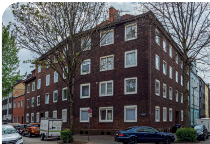
Das Eckhaus an der Düppel- und Sonderburger Straße bietet auf vier Geschossen Platz für 19 Wohneinheiten.