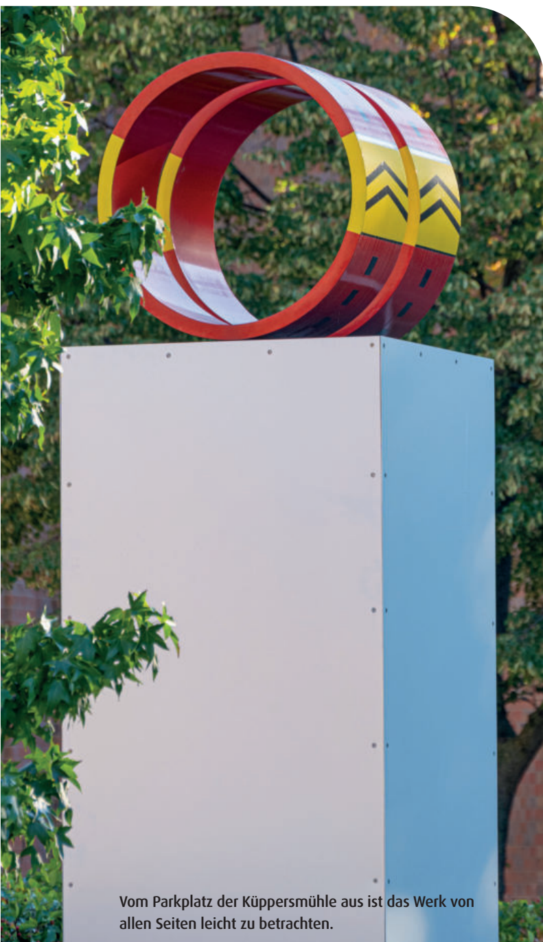
Vom Parkplatz der Küppersmühle aus ist das Werk von allen Seiten leicht zu betrachten.

Seit Dezember 2021 gibt es auf dem Parkplatz des Duisburger Museums Küppersmühle ein neues Denkmal. Auf einem Aluminiumsockel erheben sich dort zwei Ringe in Rot, die außen mit einer Art gelben „Bänderolen“ markiert sind. Auf diesen gelben Bereichen wiederum befinden sich zwei flache Pfeilzeichen, die aufwärts zeigen. Die roten Ringe sind zudem durch schwarze, regelmäßig unterbrochene Striche in der Mitte geteilt.