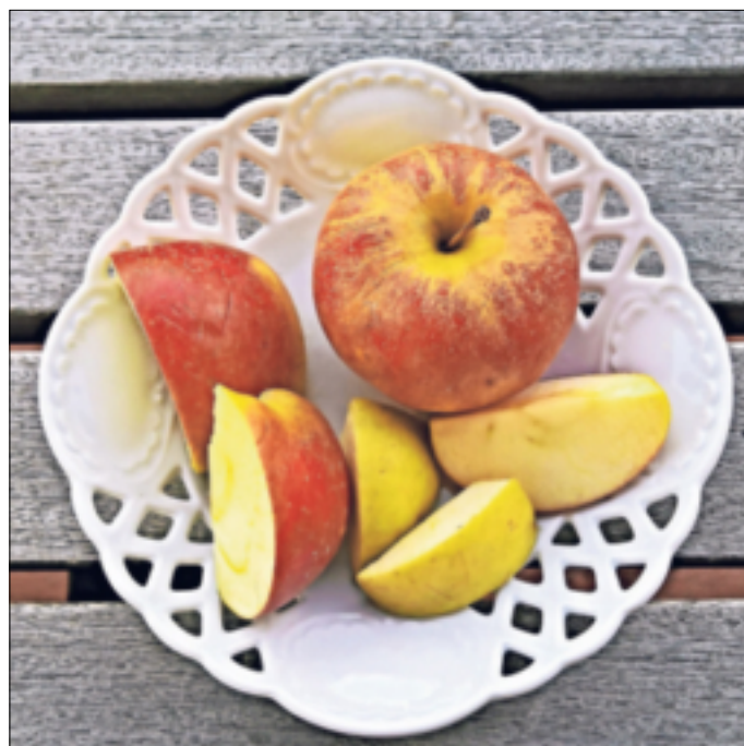
So ein Apfel ist eine wahre Vitaminquelle.

Zu den Sorten, die besonders gut verträglich sind, zählt die Sorte „Santana“. Aber auch Sorten wie „Wellant“, „Rubinette“, „Berlepsch“ oder „Boskoop“ werden von vielen Allergikern gut vertragen. Es ist allerdings notwendig, dass jeder Allergiker für sich testet, welche Apfelsorten er verträgt. Denn die Verträglichkeit ist von Person zu Person verschieden. Häufig wird behauptet, dass alte Apfelsorten verträglicher seien als neue. Diese Aussage kann so nicht bestätigt werden. Die Aneinanderreihung von Aminosäuren in der Apfelsorte ist entscheidend dafür, ob Allergiker diese Apfel-