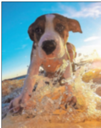
Ein Sommermoment mit Hund.

Grevenbroich. Das Handy oder den Fotoapparat gezückt und einen schönen Preis gewinnen: Der Erft-Kurier lädt vom 27. Juli bis zum 31. August zum Sommergewinnspiel ein. Die Teilnahme ist ganz einfach: Schicken Sie uns ein Foto Ihres schönsten Sommermoments und schon landen Sie im Lostopf! Egal, ob Urlaubsschnapschuss oder eine Aufnahme aus der heimischen Gartenanlage – eine Teilnahme lohnt sich, denn es winkt ein toller Preis. Von „Ikea Kaarst“ gibt es einen 200-Euro-Einkaufsgutschein zu gewin-