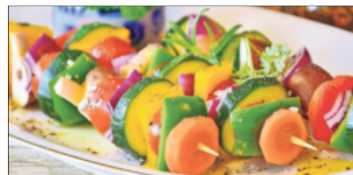
Schön bunt und gesund: Grillgemüse.

hervorragend zu Gegrilltem. Wie wäre es mit einem Salat aus frischem Spargel, Pfirsichen und gekochtem Ei? Schmeckt lecker und sieht gut aus! Oder ein Salat aus Rübstiel und Erdbeeren? Für jedes Grillbuffet ein Hingucker! Das Gemüse liefert nebenbei wichtige Vitamine und Mineralstoffe, die der Körper auch im Sommer braucht. Außerdem ist Gemüse kalorienarm und deshalb gut für die „Bikini-Figur“.