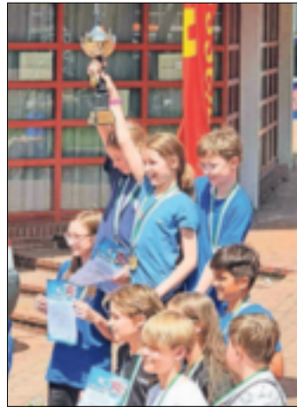
Das Team der DLRG Hochneukirch durfte sich über viele Plätze auf dem Siegereppchen freuen.