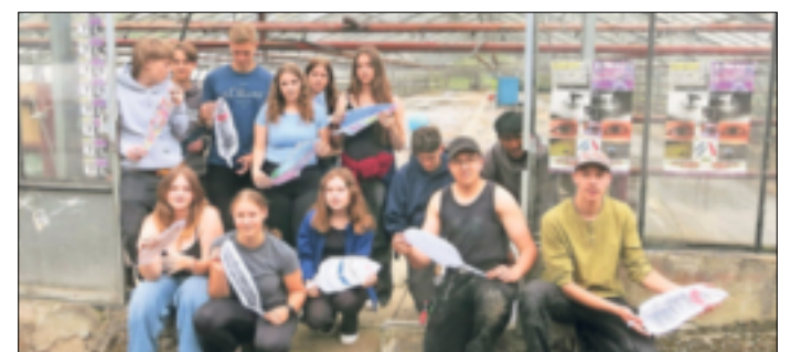
Das Orga-Team der Ausstellung „Licht im Glashaus“.