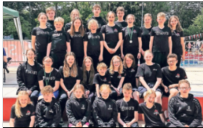
Die „Beasts“ waren wieder auf Medaillenjagd.

Die Pokale und Medaillen sind das eine, noch erfreulicher war, dass reichlich neue persönliche Bestzeiten mit in den nächsten Wettkampf an diesem Wochenende genommen werden, dem Swans-Cup in Bergheim.