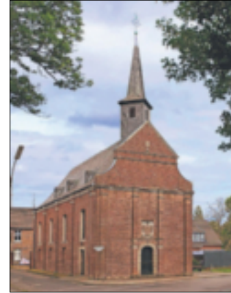
St. Georg Neuenhoven.

Neuenhoven. Traditionell lädt die Neuenhovener Pfarrgemeinde St. Georg auch in diesem Jahr wieder Anfang Juli zum Neuenhovener Fest ein, in dessen Mittelpunkt die Verehrung der Heiligen Vierzehn Nothelferinnen und Nothelfer steht. Traditionell gibt es in jeder der Wallfahrtsmessen einen geistlichen Impuls. Über den Ursprung der Wallfahrt zu den Heiligen Vierzehn Nothelfern von Neuenhoven ist nicht viel bekannt; sicher ist, dass seit über 640 Jahren Pilger in den Jüchener Ortsteil kommen und die Nothelferinnen und Nothelfer in vielerlei Anliegen um ihre Hilfe bitten. Das Leitwort der Wallfahrtsoktav „Geh' mit uns...“ möchte den Menschen wieder Mut machen, ihren Weg zu gehen – denn Jesus geht ihn in allen Lebenslagen mit. Hier die Gottesdienstordnung mit den einzelnen Impuls-Themen: Samstag, 6. Juli: 18 Uhr Eröffnung der Wallfahrt „Begleitung auf meinem Weg“ Sonntag, 7. Juli: 8 / 9.30 Uhr „Be-