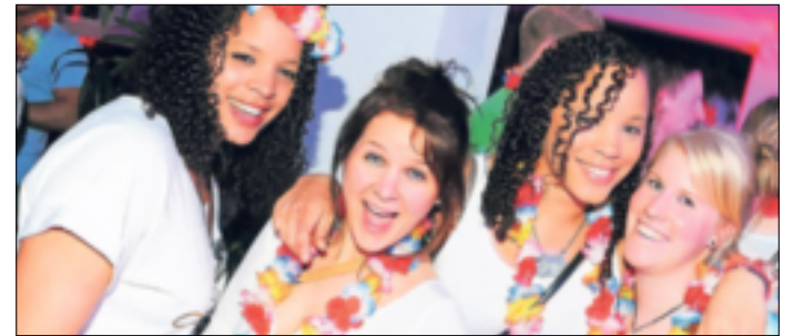
Die erste „Ritmo de la Noche“ lockt nach Holz.