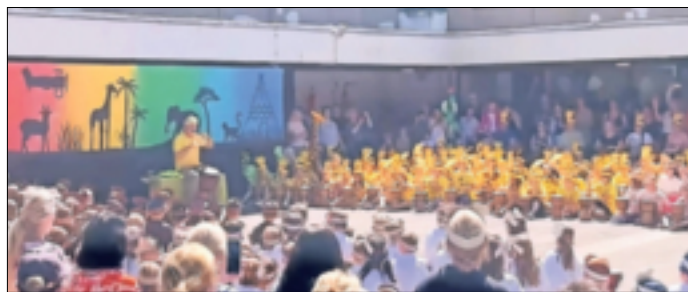
Am Ende der Projektwoche stand der große Auftritt der Kinder auf dem Plan.

Während der Projektwoche lernten die Kinder mit viel Spaß, dem Rhythmus zu folgen, wenn die Erst- und Zweitklässler etwas anderes spielten als die Dritt- und Viertklässler. „Es ist so schön, dass die Kinder in diesem Projekt musikalisch zusammenwachsen. Ich bekomme jeden Morgen eine Gänsehaut!“, so die Schulleiterin. Nach der Auf-führung kamen alle – Besucher und Mitwirkende – in den Genuss eines riesigen Buffets, welches durch die Eltern der Lindenschule organisiert wurde. Ferner sorgten eine durch die Eltern bereitgestellte Hüpfburg und Spielmöglichkeiten, die durch die OGS angeboten wurden, für viel Freude. Nachdem auch das Wetter in der Woche afrikanische Temperaturen hervorbrachte, war diese Projektwoche eine rundum gelungene Veranstaltung.