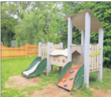
DAs U3-Gelände der Kita St. Martinus wurde neu gestaltet.

unseres Kindergartens. Den größten Anteil hat unser Träger übernommen. Dafür danken wir allen sehr!“ Die Kinder und das Team freuen sich riesig über die neue Gestaltung und den vergrößerten U3-Bereich.