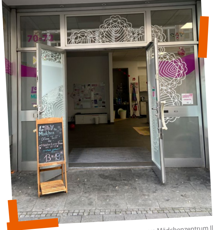
Barrierefreier Eingang zum Mädchenzentrum II

Die Erfahrung der letzten Jahre hat uns gezeigt, dass der Aufbau einer inklusiven Einrichtung der Offenen Kinder- und Jugendarbeit nur über die Verzahnung von verschiedenen Institutionen, niedrigschwelligen Angeboten und den Einbezug von Angehörigen und Bezugspersonen gelingt. Neben den strukturellen Rahmenbedingungen zum Abbau von Barrieren in der Offenen Kinder- und Jugendarbeit