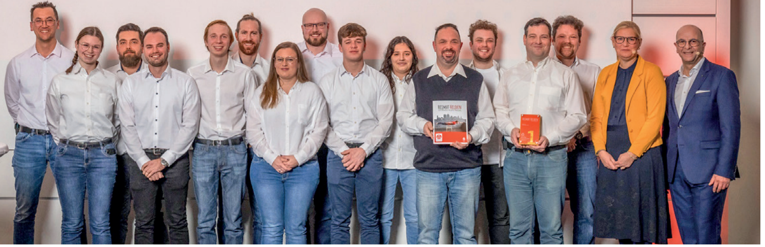
Der erste Platz ging an den Löschzug Grimlinghausen.