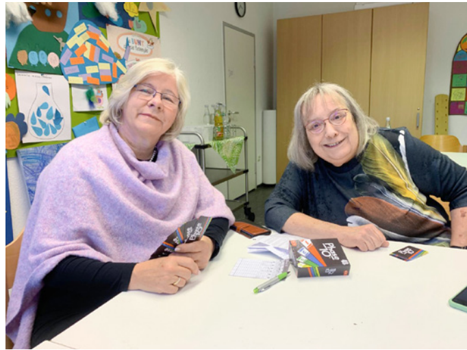
Das Angebot von „Miteinander digital“ ist bunt und vielfältig.