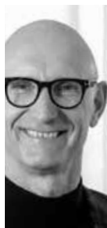
Thomas Rabe, Vorstandsvorsitzender und CEO Bertelsmann

Zugang zu und Teilhabe an Medien sicherstellen ist Auftrag der Telekom. Mit MagentaTV bieten wir zudem ein Fernsehangebot, das verschiedene Inhaberteilhaber auf einer Plattform bündelt. In NRW finden wir dafür starke Partner direkt vor der Haustür.