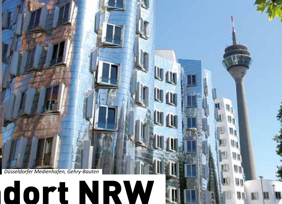
Düsseldorfer Medienhafen, Gehry-Bauten