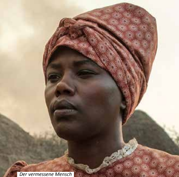
Der vermessene Mensch