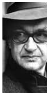
Margarethe von Trotta, Regisseurin

Nordrhein-Westfalen hat einen sensationellen Motivreichtum. Es gibt hervorragende Filmtechniker und Teams. Jedes Jahr vergibt die Wim Wenders Stiftung in Zusammenarbeit mit der Film- und Medienstiftung NRW ein Nachwuchs-Stipendium. Das innovative Filmschaffen hat in NRW also nicht nur Tradition, sondern auch Weitblick.