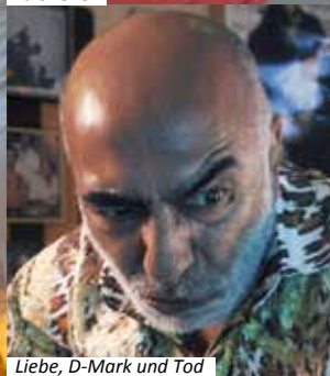
Liebe, D-Mark und Tod