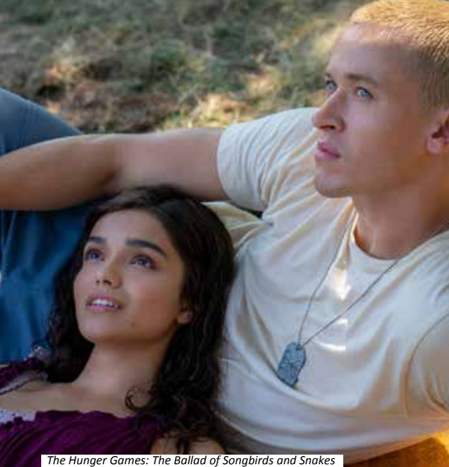
The Hunger Games: The Ballad of Songbirds and Snakes