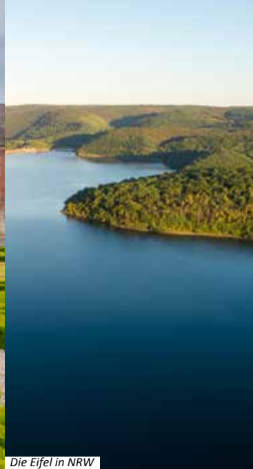
Die Eifel in NRW