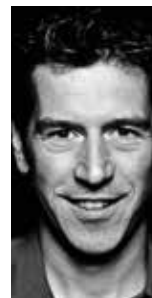
Sönke Wortmann, Regisseur

NRW ist so vielfältig wie keine andere Region in Deutschland. Daraus ergeben sich für mich immer wieder außergewöhnliche Drehorte und Motive. Ich glaube, das Besondere am Drehen in NRW sind aber auch die Menschen, die hier leben. Ich habe noch nie gehört, dass ein komplettes Filmteam nachts um halb zwei von einem Anwohner mit Grillwürsten versorgt wurde. In NRW hab' ich das erlebt.