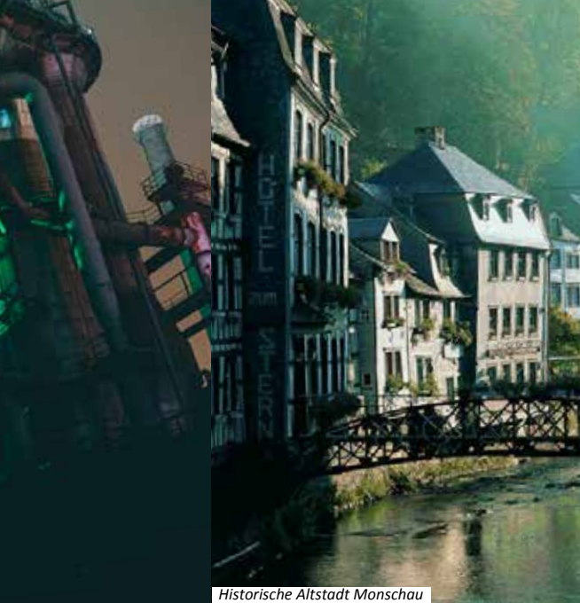
Historische Altstadt Monschau