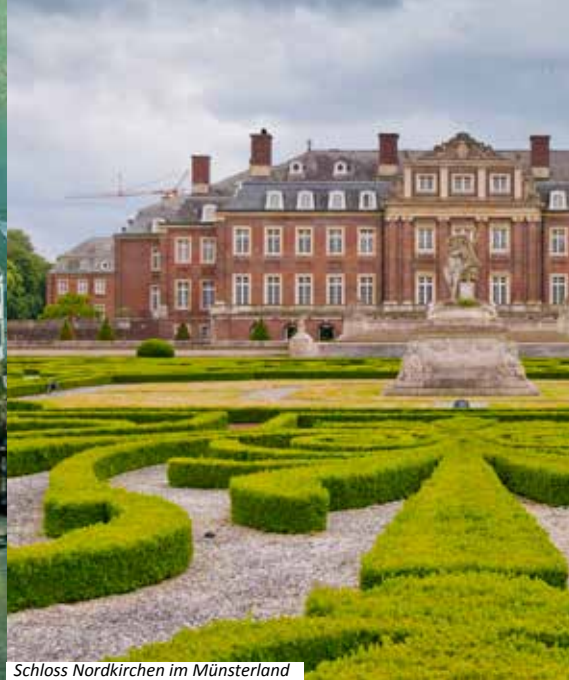
Schloss Nordkirchen im Münsterland