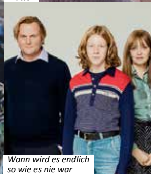
Wann wird es endlich so wie es nie war