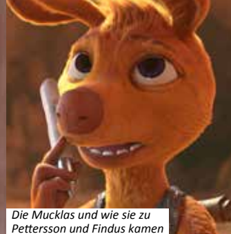
Die Mucklas und wie sie zu Pettersson und Findus kamen