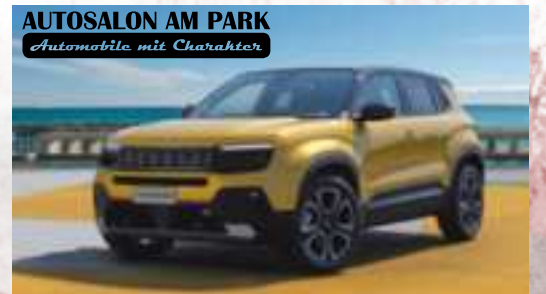
AUTOSALON AM PARK Automobile mit Charakter Modellbeispiel: Jeep® Avenger Altitude GSE 1,2l Turbo (Benzin) / 74 kW (100 PS); Kraftstoffverbrauch (kombiniert): 5,6 l/100 km; CO 2 -Emissionen (kombiniert): 125 g/km, CO 2 -Klasse: D.