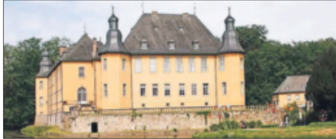
Am 20. Mai wird zum Schlosskonzert geladen.

Die Wahl fiel auf einen Frauenchor aus der nordfranzösischen Stadt Chalons en Champagne, die seit 1972 mit der Stadt Neuss durch eine vitale Städtepartnerschaft verbunden ist. Das „Ensemble Vocal Féminin: Thibaut de Champagne“ tritt bei der Open-Air-Matinee im Innenhof des Schlosses auf. Der französische Chor wurde 1986 gegründet, seit dieser Zeit erlebt Frankreich eine wahre