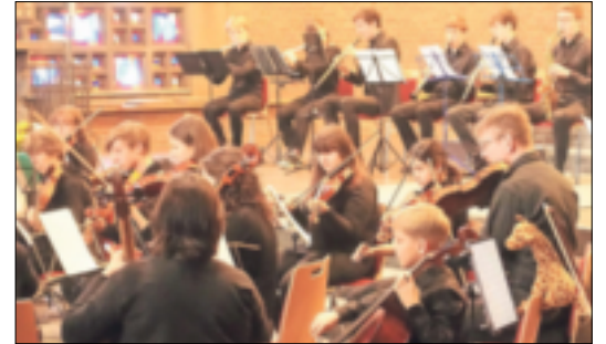
Viel Applaus erhielten die Musiker des Sinfonieorchesters.

aufgeführt und gehört zu den bekanntesten Orchesterwerken der Romantik: Grieg komponierte sie als Schauspielmusik zu Henrik Ibsens gleichnamigem Bühnenstück auf dessen Auftrag hin. Das Orchester stellte unter anderem bei den Sätzen „Morgenstimmung“, „Anitras Tanz“ und „In der Halle des Bergkönigs“ sein vielseitiges Können unter Beweis. Im zweiten Teil des Konzertes erklang die Sinfonie Nr. 7 in h-moll