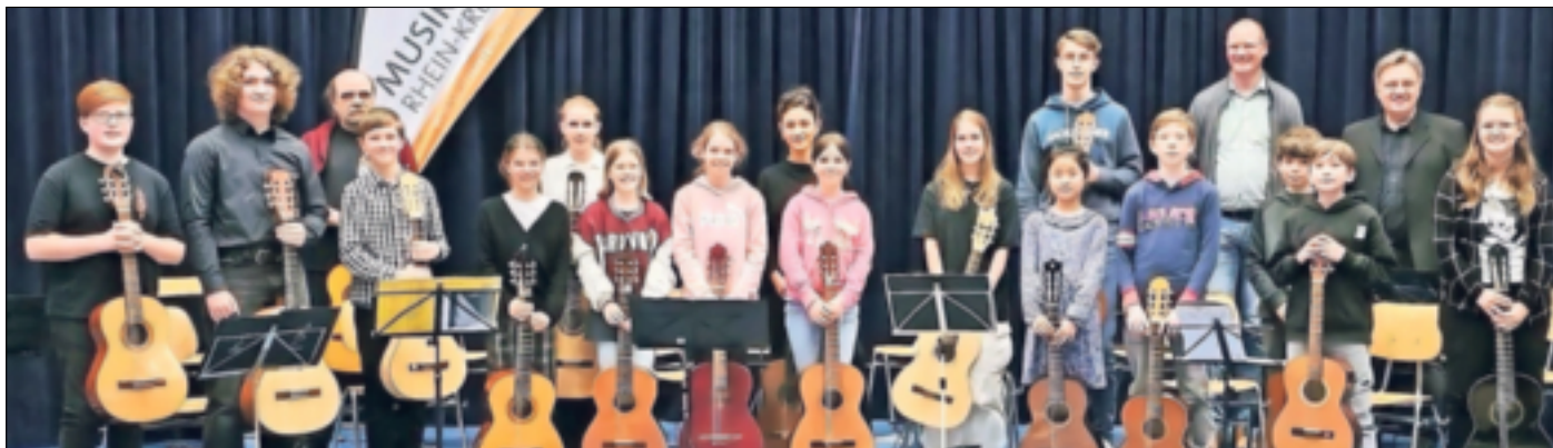
17 junge Musiker der Musikschule Rhein-Kreis Neuss begeisterten beim Konzert „Frisch gezupft“.