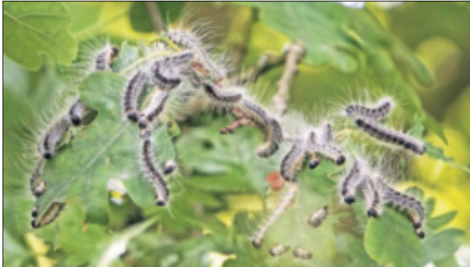
So sehen Eichenprozessionsspinner aus.

Es wird davor gewarnt, sich längere Zeit im Bereich von Eichen aufzuhalten, die vom Eichenprozessionsspinner befallen sind. Der Kontakt mit den mikroskopisch kleinen Gifthaaren der Raupe kann bei Menschen zu starken Reizungen und allergischen Reaktionen von Haut und Atemwegen führen und sollte daher unbedingt vermieden werden. Zu den Begleitsymptomen zählen Schwindelgefühl, Fieber und Müdigkeit. Abstandhalten zu den Raupen ist deshalb der beste Selbstschutz. Eine Bekämpfung der Schädlinge ist somit vor allem dort wichtig, wo Menschen leben und es unvermeidlich ist, mit den Brennhaaren in Berührung zu kommen. Der Befall ist durch die Bildung von Gespinsten in der Krone, am Stamm und in Astgabeln der Bäume leicht zu erkennen. Auch die Anordnung der Tiere während ihrer Prozes-