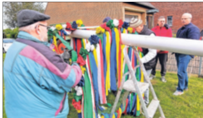
Nach einem Jahr Pause steht in Gubberath nun wieder ein Maibaum.

gemeinschaft haben bei der Aktion geholfen. Gefeierte wird allerdings erst beim Abschmücken nach einem Monat auf dem Brunnenplatz („Hans-Werner-Warsönke-Platz“) in Gubberath.