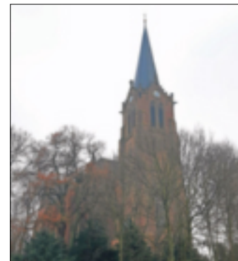
Die Pfarrkirche St. Jakobus.