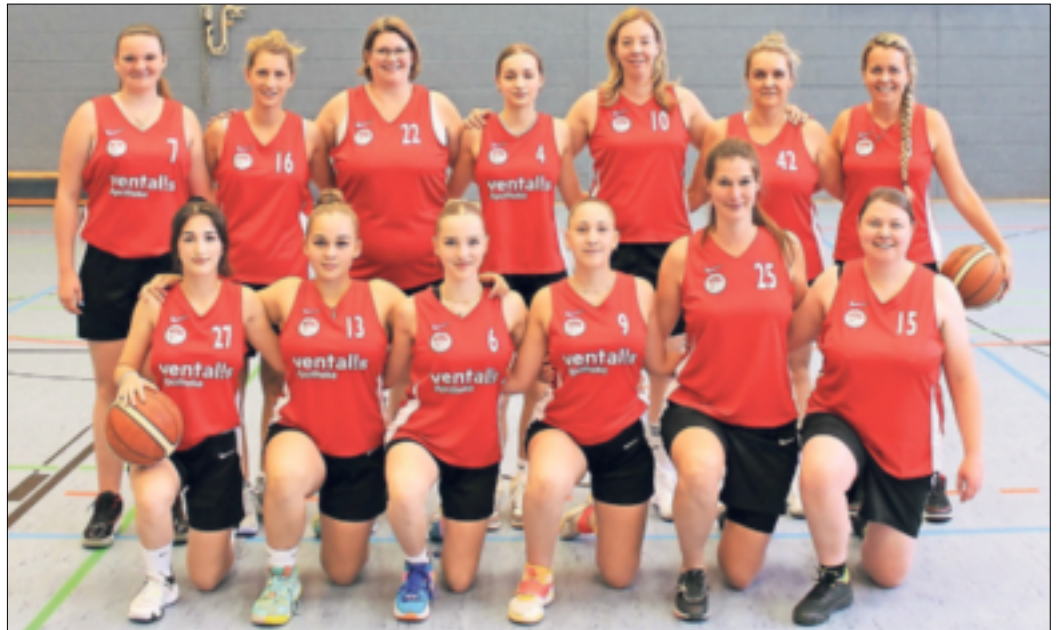
Die Damenmannschaft der „Scorpions“.