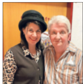
Gute Stimmung herrschte auch hinter der Bühne.