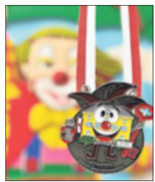
Der neue Karnevalsorden der Stadt.