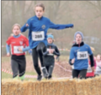
Der Schülerlauf im vergangenen Jahr.