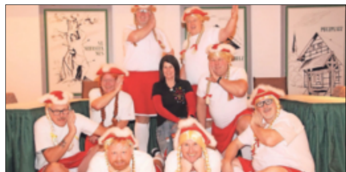
Man-Power stand auch auf der Bühne: mit weiblichen Charme und tollen Kostümen tanzten die „Sebastianer Elfen“.