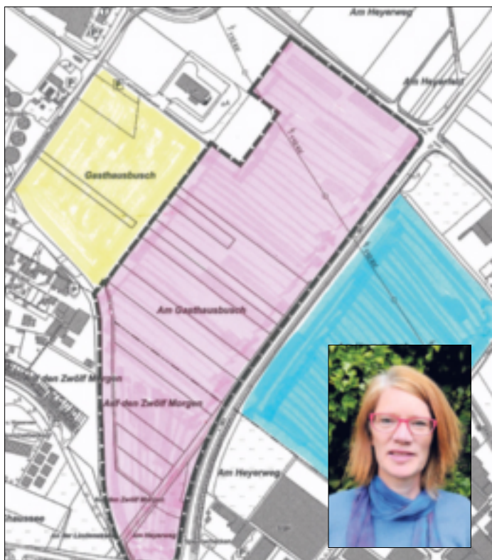
Hyperscale-Rechenzentrum am „Gasthausbusch“: Zur Petition von Beate Schmidt-Härten geht es über www.openpetition.de/hyperscaler .

vergleich extrem ertragreiche Ackerfläche.“ Angesichts der großen Fläche sei die Zahl der geschaffenen Arbeitsplätze dagegen verschwindend gering: „... nur 50, 60 Arbeitsplätze, überwiegend beim Wachpersonal“, schüttelt die Stadträtin den Kopf. Und Gassen ergänzt sarkastisch: „Und das sollen dann die Arbeitsplätze für die sein, die ihren durch den Strukturwandel beim RWE verlieren.“ Drittes Hauptargument ist der Stromverbrauch: Das Rechenzentrum würde allein 4,6 Mal so viel Strom verbrauchen wie bis dato die gesamte Stadt Grevenbroich. Widersinnig in den Augen von Beate Schmidt-Härten: „Die kleinen Leute finanzieren derzeit alle die Energiewende und dann siedelt sich so ein Unternehmen an, weil hier die Kohlekraftwerke stehen, die aber bald weg sein sollen.“ Dorothee Gassen betont: „Vom Land, der Bezirksregierung, den Verantwortlichen im ‚Rheinischen Revier‘, der Stadtverwaltung, dem Stadtrat und vor allem auch dem Bürgermeister werden die Interessen des Investors gehört und bedient, während die Bürger nur spärlich über das