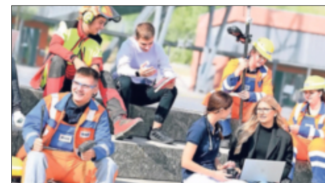
Die Energiewende aktiv mitgestalten: RWE bietet jungen Menschen die Möglichkeit dazu.

wende mitgestalten. Damit schaffen sie einen Wert. Einen Mehrwert – für uns alle und für sich selbst. Wer weiß, was er auch für sich selbst will, ist bei RWE richtig: mit einer hochwertigen Ausbildung. Junge Leute mit Sinn für Technik und Innovation und für echte Chancen. Teamplayer sind hier hochwillkommen. So eine Ausbildung bietet Sicherheit und zahlt sich aus: Sie ist der Fuß in der Tür der Zukunft Deutschlands. Wer bei RWE lernt, hat gut gewählt und beste Aussichten auf eine Übernahme.