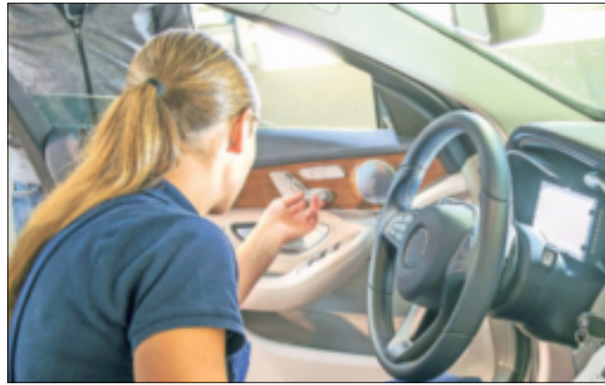
Ausbildungsberufe in der Kraftfahrzeugbranche bieten jungen Menschen gute Entwicklungschancen und zukunftssichere Arbeitsplätze.

Grevenbroich. Für Menschen, die einen Beruf in der Kfz-Branche anstreben, eröffnen Entwicklungen wie beispielsweise die Hinwendung zur Elektromobilität und die Digitalisierung neue Möglichkeiten und Chancen. Tatsächlich stehen Berufe rund um Fahrzeuge und Mobilität hoch im Kurs, berichtet das Deutsche Kfz-Gewerbe. Alleine 2022 haben sich mehr als 25.000 junge Menschen für einen Karriereestieg in der Kraftfahrzeugbranche entschieden. Bei Männern liegt das Berufsbild Kfz-Mechatroniker auf Platz 1 der beliebtesten Ausbildungs-