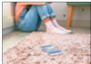
Der Rhein-Kreis bietet zu den Halbjahreszeugnissen ein Zeugnistelefon an.