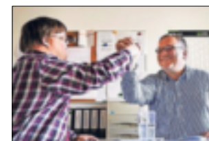
Soziales Miteinander und Teilhabe leben.

Seit mehr als 55 Jahren wird in den Varius Werkstätten soziales Miteinander und Teilhabe am Arbeitsleben für Menschen mit Behinderung gelebt und gefördert. Für rund 700 Mitarbeitende ist VARIUS ein bedeutender Arbeitgeber für den gesamten Rhein-Kreis Neuss.