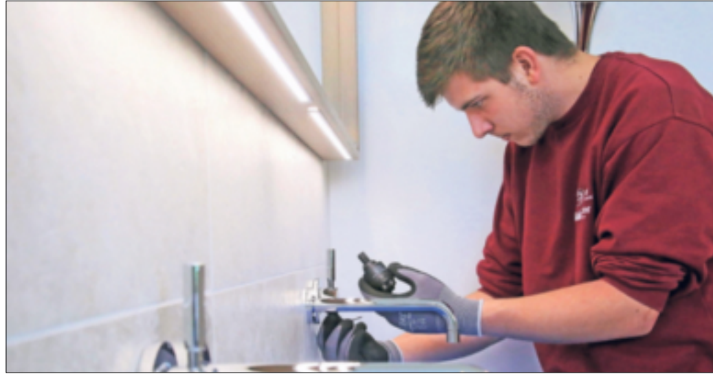
Berufsbilder in der SHK-Branche sind vielseitig und bieten sehr gute Entwicklungsperspektiven.

Mit einer dualen SHK-Ausbildung können junge Menschen auf ein Berufsfeld mit ausgezeichneten Entwicklungspers-