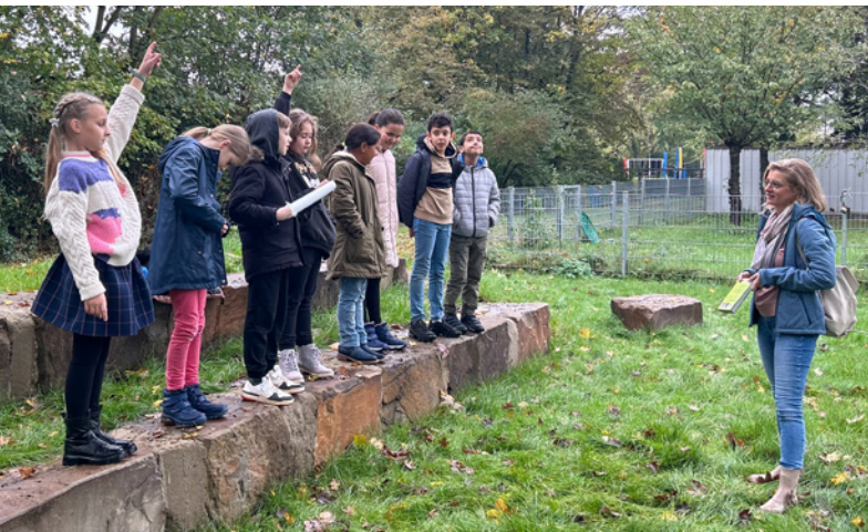
Im „Grünen Klassenzimmer“, direkt neben dem Schulgarten, treffen sich alle, bevor gegärtnert wird.