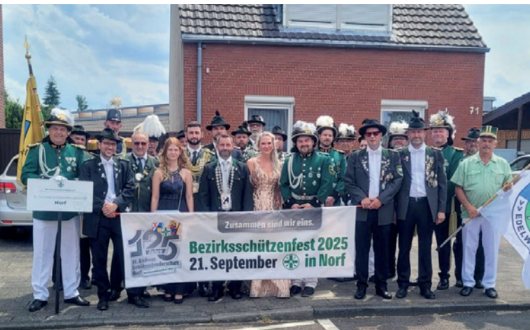
Erster Auftritt mit großer Botschaft: Die Norfer Abordnung im Juli 2023 beim Bezirksschützenfest in Nievenheim-Ückerath.

um das Motto: „ZUSAMMEN SIND WIR EINS.“ Darunter soll nicht nur das Wir-Gefühl im Doppeldorf aus Norf und Derikum verstanden werden. Die Schützenbruderschaft setzt sich aus insgesamt zwölf Einheiten zusammen. Dabei sind die Vorreiter mit drei Schützen die kleinste und das Edelknapenkorps stellt die Jüngsten.