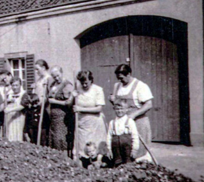
Im Sommer 1943 wurde der „Rheinhausener Deckungsgraben“ an der Von-Waldthausen-Straße gebaut. Frauen aus dem Ort machten die Erdarbeiten.

dabei war beispielsweise auch das Kriegstagebuch, das der damalige Pfarrer Löffelsend geführt hat. „Solche Zeugnisse sind selten und sehr wichtig. Sie sind authentisch und spiegeln sogar Emotionen wider“, freut sich Stefan Rosellen. Manchmal ist es aber auch ein glücklicher Zufall, wie die Ehrenamtler an neue Erkenntnisse kommen. So geschehen beim Vortragsabend über die Norfer Luftschutzanlagen, der vor Kurzem stattfand. Stefan Rosellen berichtete dort, dass ihnen überall bestimmte Lüftungsklappen über den Türen begegneten. Der Hintergrund dazu war unbekannt. Bis ein Teilnehmer des Vortrags, der in der chemischen Industrie arbeitet, sagte, dass es sich bei den Lüftungsklappen um Tankdeckelverschlüsse handele. „Also liegt die Vermutung nahe, dass jemand, der bei dieser Firma gearbeitet hat, die für die Dorfgemeinschaft organisiert hat“, erklärt Jörn Esposito. Mit der Dokumentation gut der Hälfte der Bunker in Norf haben die beiden Vereine schon einen wichtigen Schritt getan, ein Stück Norfer Geschichte festzuhalten. Wann und wie die restlichen Luftschutzanlagen dokumentiert werden können, wird sich zeigen. Für die Ehrenamtler fängt die eigentliche