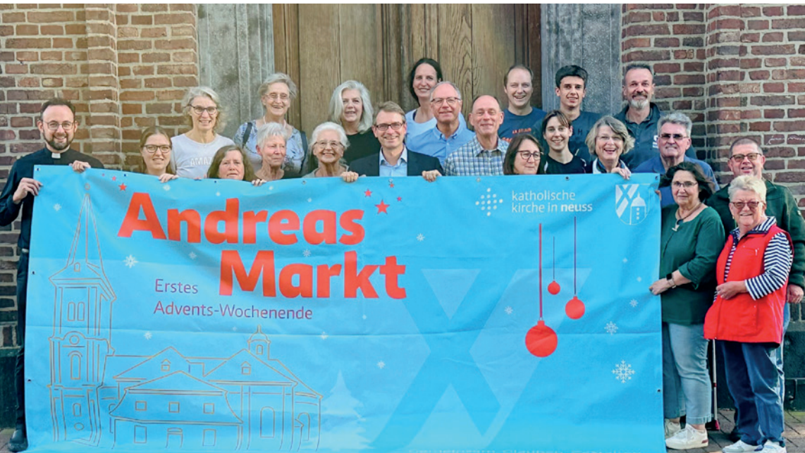
Die Organisatoren des Andreasmarkts laden am ersten Advents-Wochenende ein, gemeinsam die besinnliche Zeit einzuläuten.