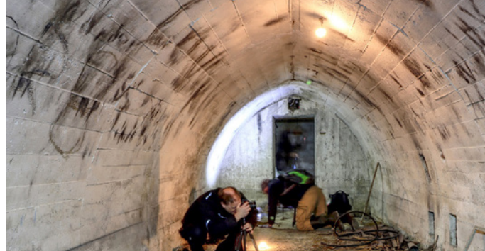
Der Verein „Luftschutzanlagen Rhein Kreis Neuss“ dokumentiert die Bunker in Norf.