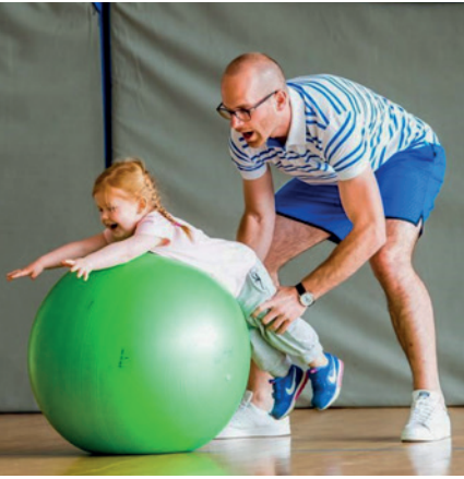
Beim Eltern-Kind-Turnen können sich die Kids richtig austoben.