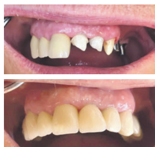
Implantatarbeit auf individuellen Abutments, professionell umgesetzt, sehr zur Freude unserer Patientin.