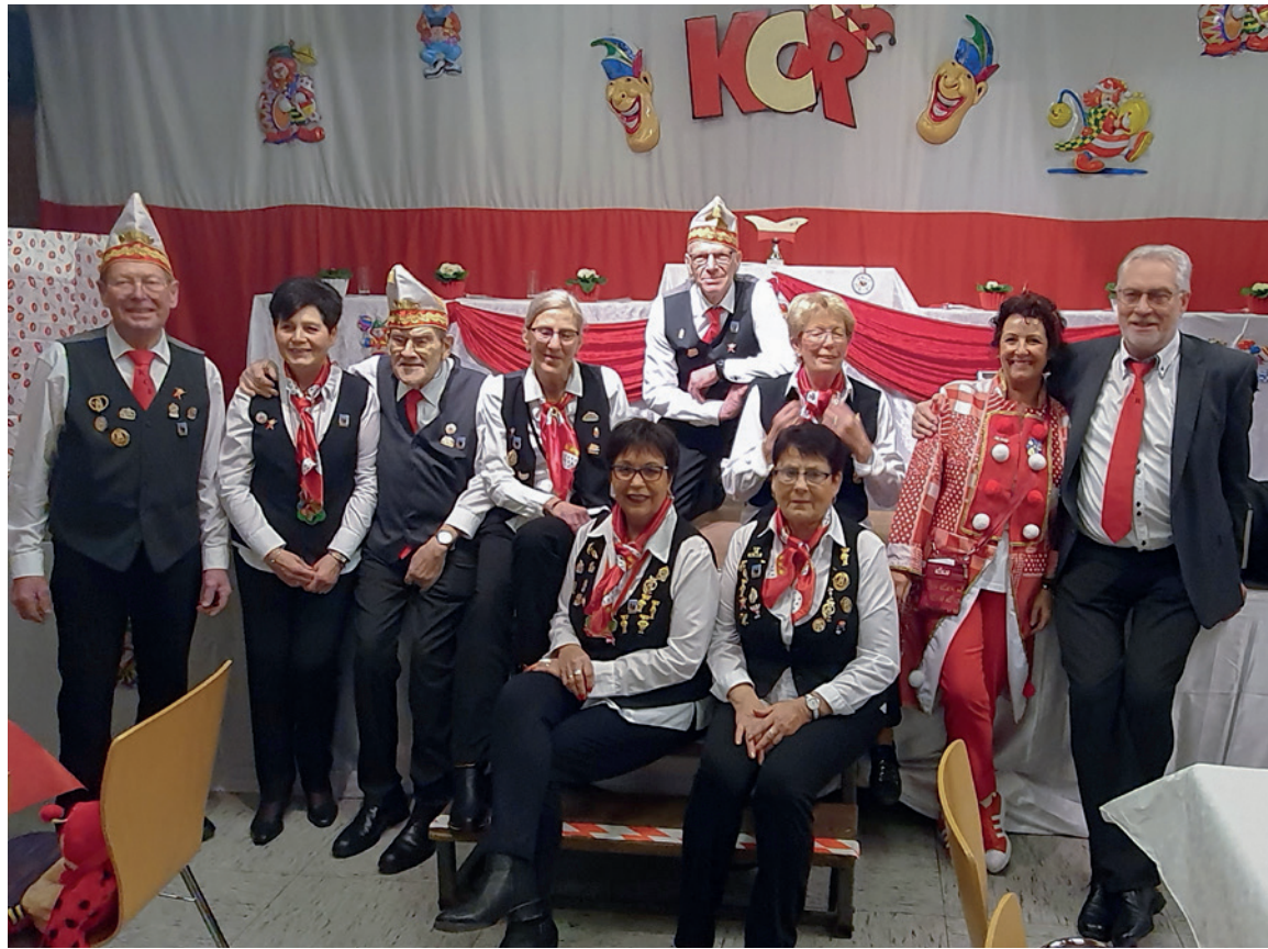
Der wohl kleinste Karnevalsverein der Stadt, der KCR Rosellerheide, stellt seit vielen Jahren die Karnevalssitzung im Heidezentrum auf die Beine.

nen Jahren kann der KCR Rosellerheide sich schon jetzt über ein volles Heidezentrum freuen: „Unsere Karten werden uns nach wie vor aus den Händen gerissen, das ist der absolute Wahnsinn.“ Für viele Karnevalisten ist die Sitzung seit Jahren ein fester Termin im Kalender. Auch große Gruppen wie beispielsweise die KG Alt-Severin aus Köln, die immer mit um die 15 Personen auflaufe, gehören zu den Stammgästen. Der Erfolg spricht für sich und so wünscht sich Thilly Meester, dass sich in den Dörfern mehr Leute finden, die etwas im Kleinen auf die Beine stellen: „Solche Dinge tragen zum Leben im Dorf bei. Viele Ältere sagen, dass sie nicht so weit fahren können, da sind solche Veranstaltungen im Kleinen ideal.“ Daniela Furth