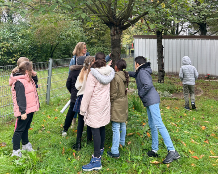
Die Stunden im Schulgarten stehen in der Regel unter einem bestimmten Thema, wie zum Beispiel die Baumlehre.

anstrengend die Gartenarbeit sein könne, und Franke habe auch schon von zwei Kindern zu hören bekommen, dass sie lieber Mathe hätten, wie sie lachend erzählt, aber im Großen und Ganzen hätten alle sichtlich Spaß. So habe eine Klasse beispielsweise die Kräuterspirale wieder aufgebaut und in der