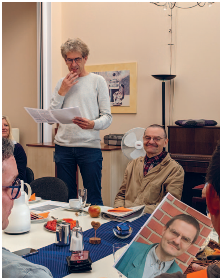
Abschied, aber richtig! Ein gedeckter Tisch und eine Rede – das wichtigste im Volksverein sind seine Menschen.