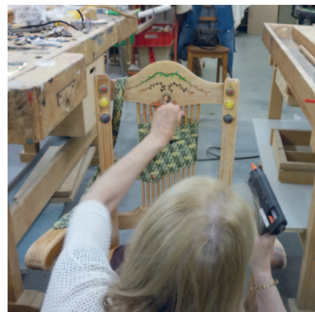
Die Stühle werden zu Geschichten