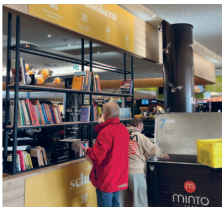
Der offene Bücherschrank im Minto wird vom Volksverein gepflegt.

Der Volksverein hat im Oktober die Pflege und Bestückung des offenen Bücherschranks im Minto übernommen. Es wurden bereits Kinderbücher, Sach- und Kochbücher sowie Romane in den offenen Bücherschrank gebracht. Der Bücherschrank befindet sich im Mintos Deli auf Ebene 4. Man kann sich an den Büchern kostenlos bedienen und diese auch mit nach Hause nehmen. |