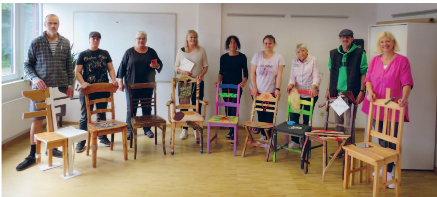
Und am Ende sind Lebensgeschichten sichtbar geworden – mit vielen Unterschieden und noch mehr Gemeinsamkeiten.