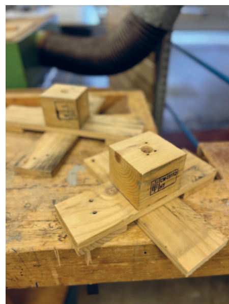
Der Reiz von Recycling durch die vielen Holzfarben entfaltet sich buchstäblich beim Aufbau des Christbaums, Ständer inklusive!