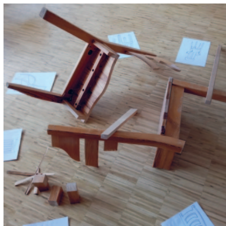
Zum Einstieg ins Thema: ein zerlegter Stuhl