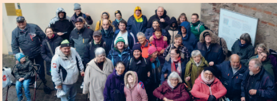
Gruppenfoto von Ausflug nach Xanten

führung „Der blaue Planet“ besucht. In thematischen Einheiten wurde erarbeitet, was jede*r konkret zum Klimaschutz beitragen kann und was es jeder*m ganz persönlich bringt. All das wurde festgehalten an einem „TaK-Schöpfungsbaum“. Dann stand im Oktober ein Kooperations-Ausflug mit den MitarbeiterInnen des Volksvereins nach Steyl auf dem Programm. Mit insgesamt 18 Personen wurde das Klosterdorf Steyl und die damit verbundenen Missionsgemeinschaften erkundet. Alle waren vor allem von den Grotten beeindruckt, die die Brüder von Materialresten der Häuser in den Gärten anlegten. Ein dritter Ausflug führte uns im November nach Xanten. Bei einer Stadtrundfahrt