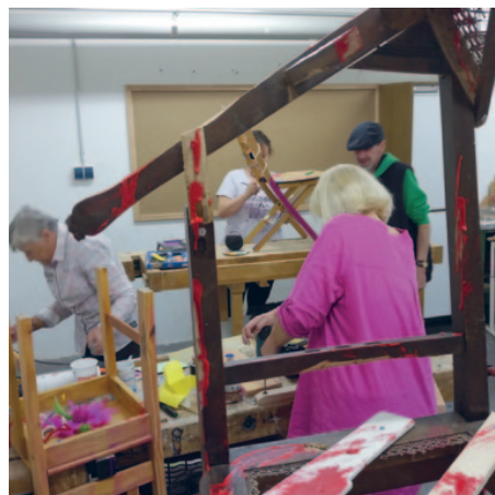
Rekonstruktion, Umbau, Ausschmückung