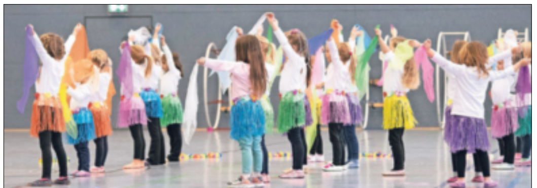
Und auch die Kleinen - hier die Tanzmäuse beim Kindertanz - bewegten sich mit.