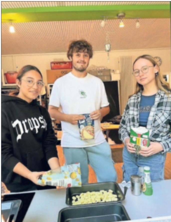
Das Team überlegt sich immer neue Angebote. Hier wurde zum Beispiel gekocht.

Im „Bamm“ stehen derweil die Zeichen auf der Vorweihnachtszeit: So sind die Heranwachsenden in dieser Woche gemeinsam zum Weihnachtsmarkt nach Mönchengladbach gefahren, das Team verkauft Waffeln beim Lichterfest des Weihnachtsbaumvereins Hochneukirch und ein Highlight wird der Mitsing-Abend am 23. Dezember sein: „Für uns und die Besucher die perfekte Einstimmung auf Weihnachten! Wir freuen uns auf viele Menschen, die mit uns singen möchten und unseren kleinen Weihnachtsmarkt besuchen!“ Los geht es am 23. Dezember um 17 Uhr im Jugendcafé „Bamm“ an der Mühlenstraße in Hochneukirch.