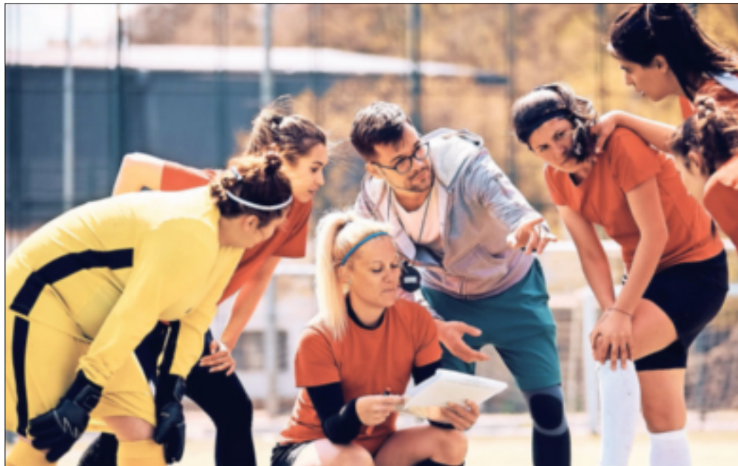
Der Rhein-Kreis erleiht jährlich im Rahmen seiner Ehrung der Sportler den Sportehrenamtspreis.

Jüchen. Der Rhein-Kreis verleiht jährlich im Rahmen seiner Ehrung der Sportler den Sportehrenamtspreis. Für die Preisverleihung 2024 können die Sportvereine aus dem Rhein-Kreis jeweils einen Vorschlag für die beiden Kategorien „Ehrenamt“ sowie „Freiwilliges Engagement im Sport“ noch bis zum 31. Januar 2024 einreichen. In der Kategorie Ehrenamt kann jeder Sportverein ein Vereinsmitglied vorschlagen, das über Jahre hinweg Verantwortung in unterschiedlichen Funktionen und Ämtern im Sport übernommen hat und den Sport, den Verein oder den Verband als Person sowie mit der geleisteten Arbeit deutlich geprägt hat. Der Preis kann als Würdigung mit Blick auf das geleistete Engagement betrachtet werden. Schon jetzt weist der Rhein-Kreis Neuss darauf hin, dass beim Ehrenamtspreis 2025 ein Preis in der Kategorie „Trainerinnen und Trainer“ vorgesehen ist. Der Preis „Freiwilliges Engagement im Sport“ wird als Motivation für weitere Aufgaben verliehen und soll ausdrücklich junge Menschen einschließen. Empfohlen werden kann eine Person, die mit temporärem Engagement Verantwortung für