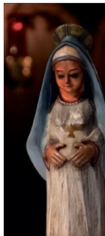
Marientragen Nikolauskloster Damm

Das gemeinsame Gebet, der Austausch miteinander stärkt im Glauben an den, der uns in