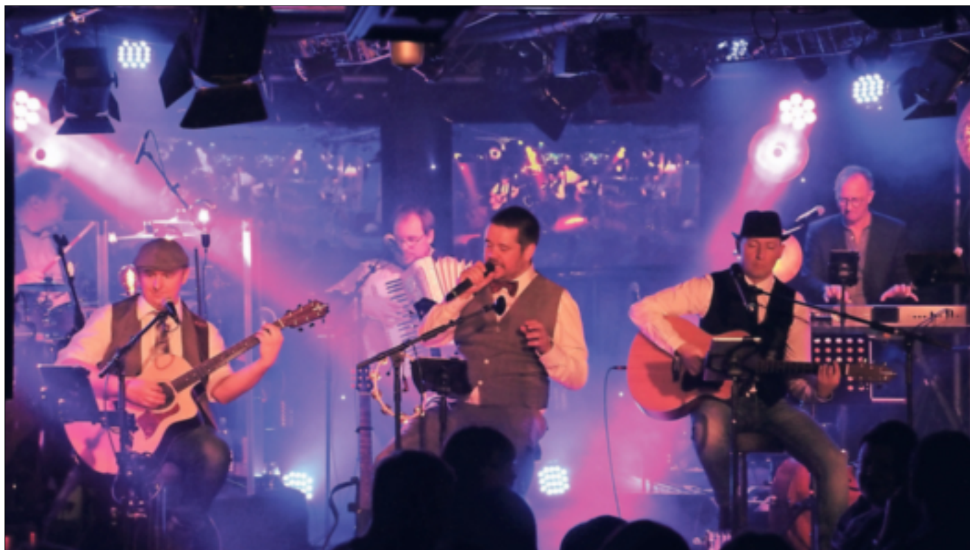
Die Band „Challenger“ wird in Jüchen mit Rock- und Popsongs für Stimmung sorgen. Auch erwartet die Gäste eine Show mit Lichteffekten, Live-Video und musikalischen Gästen.

„Einfach Challenger“ hat durch einen Zufall den Weg nach Jüchen gefunden. Nachdem die langjährige Location in Rheydt für diese besonderen Abende im vergangenen Jahr leider schließen musste, entstand im