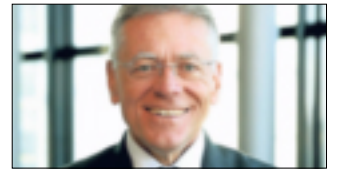
Landrat Petrauschke.

mittel. Er betont, dass das Geld zur Deckung der flüchtlingsbedingten Mehrkosten eingesetzt wird. „Hiervon profitieren auch die kreisangehörigen Kommunen, da dies bei der Berechnung der Höhe der Kreisumlage mit einbezogen wird.“