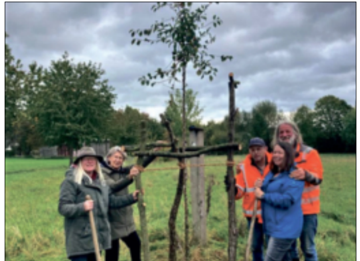
Gemeinsam mit dem NABU Jüchen pflanzten die Landfrauen den Zierapfelbaum.