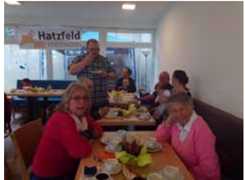
Einblick in den Gemeindefestpunkt während des Kaffeetrinkens.

Wirtschaftsstandorts Hatzfeld geleistet. Lärmbelästigungen durch die Produktion oder den Lieferverkehr sind bislang nicht aufgetreten.