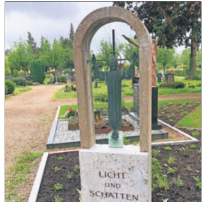
Auch auf dem Wevelinghovener Friedhof werden viele Gräber an Allerheiligen festlich geschmückt.

Allerheiligen ist jedoch nicht nur ein Tag des Trauerns, sondern auch ein Tag des Gedenkens an diejenigen, die uns in irgendeiner Weise positiv beeinflusst haben. Nicht nur die Verstorbenen, sondern auch bekannte Persönlichkeiten, Heilige und Märtyrer werden an diesem Tag verehrt und in Erinnerung behalten. Ihre Lebensgeschichten dienen als Inspiration und Vorbild für viele. In der heutigen Zeit bekommen auch soziale Medien eine immer größere Bedeutung an Allerheiligen. Viele Menschen teilen ihre Erinnerungen und Gefühle online. Sie posten Fotos, schreiben bewegende Texte oder erzählen Geschichten über die Verstorbenen, um ihre eigenen Empfindungen zu verarbeiten und anderen Menschen damit Trost zu spenden. Allerheiligen ist eine Gelegenheit, unsere Trauer zu teilen, aber auch zu erkennen, dass der Tod ein natürlicher Teil des Lebens ist. Es erinnert uns daran, wie kostbar und wertvoll unser Zusammensein ist und wie wichtig