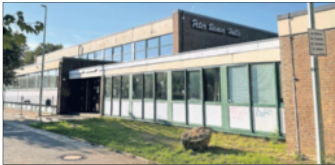
2021 starteten die Sanierungsarbeiten in und an der Peter-Bamm-Halle.

In mehreren Bauabschnitten wurde unter anderem das Lüftungskonzept des Gebäudes komplett überarbeitet, berichtet die Stadt. Dazu gehört die Belüftung der Duschen und Umkleieräume, die bereits im April 2023 in Betrieb genommen werden konnte, die Belüftung