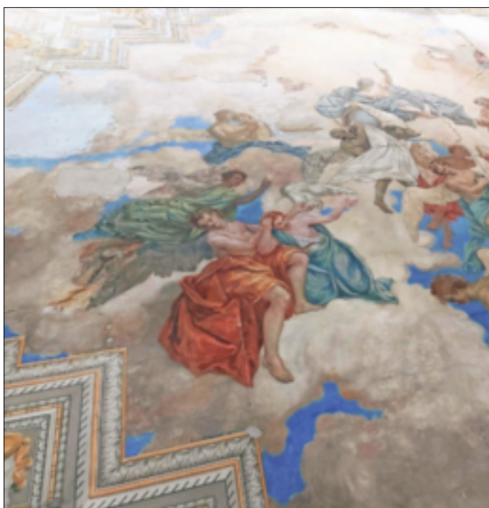
Ein Höhepunkt der Führung: das Deckengemälde im Petrusaal.