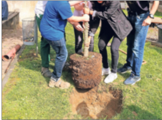
So ein Baumballen kann ganz schön schwer sein. Gemeinsam kann man ihn aber bewegen!

Die Arbeitsgruppe hat nach dem ersten Treffen einen Ort gefunden, der sehr wichtig ist: Der Eingangsbereich ist Wartezone, Pausenraum und Identifikationspunkt, aber er liegt in der vollen Mittagssonne und bietet keinen Schatten oder Regenschutz. Sonnensegel oder Pergola wurden als bauliche Maßnahme diskutiert, aber es sollte ja in der Umsetzung „möglich“ sein ... Aber einen Baum pflanzen, der nun nur noch wachsen muss, aber der in vier, fünf Jahren