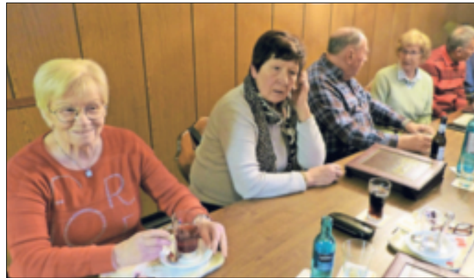
Die Kegelgruppe des Senioren-Netzwerk 55plus freut sich auf Interessierte Kegler.

guten Tropfen‘ in Garzweiler zum Kegeln mit anschließendem leckerem Essen.“ Der nächste Kegeltermin findet am 19. Oktober statt. Jeder ist herzlich eingeladen, zum Gastkegeln zu kommen, um die Gruppe kennenzulernen. Weitere Infos gibt es unter 0151/64 83 74 53.