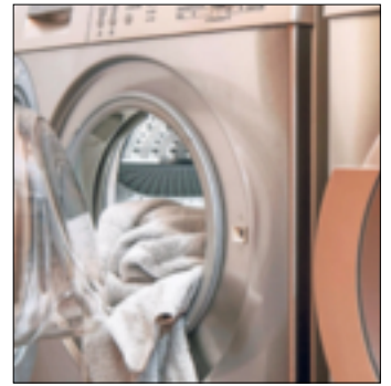
Bis zu zwei Elektrogroßgeräte je Haushalt können gegen energiesparendere Modelle getauscht werden.

elektrogeraetaetausch@caritas-neuss.de hergestellt werden. Die Caritas meldet sich anschließend zwecks Terminvereinbarung. Bei dem Termin wird der Antrag gemeinsam ausgefüllt und die Berechtigung geprüft. Wird positiv über den Antrag entschieden, erhalten die Berechtigten einen nicht übertragbaren personalisierten Gutschein, der bei einem teilnehmenden Elektrofachmarkt eingelöst werden kann.