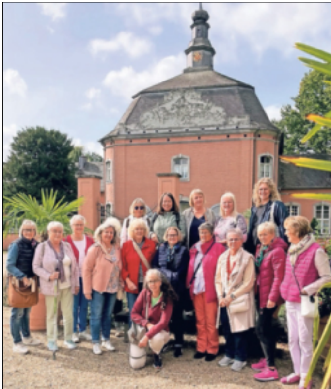
Die Jüchener Landfrauen genossen einen schönen Tag bei einer Stadttour Mönchengladbach.

Am Schloss Wickrath wurde Halt gemacht. Wir passierten die Pferdekopfbrücke und haben dann die schöne Anlage bestaunt und genossen. Hier erfuhren wir