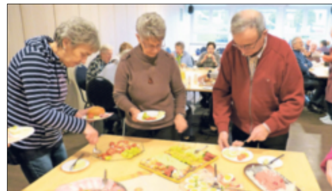
Das Senioren-Netzwerk Jüchen 55plus lädt herzlich zu einem liebevoll gestalteten und reichhaltigen Frühstücksbuffet im Marienheim ein.

Damit das Frühstücksteam planen kann, ist eine Anmeldung bis Freitag, 27. Oktober, unter 02165/16 25 erforderlich.