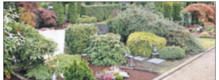
Schöne Grabbepflanzung auch im Herbst.