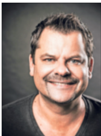
Ingo Appelt.

Jüchen. „Wo sind sie hin, die guten Jahre? Nichts ist, wie es war! Alles geht den Bach runter!“ Wenn alle jammern, läuft einer zur Höchstform auf und übernimmt das Steuer: Ingo Appelt! Der Letzte, ja, der Beste seiner Art, mit seinem besten Programm aller Zeiten. Vollgedopt mit „Ingosteron“ und einem „Hurra, uns geht's schlecht!“ auf den Lippen, zieht der Ritter des schonungslosen Humors los, dem allgemeinen Verdruss den Kopf abzuschlagen. Einer muss es ja machen, hilft ja nix – Appelt schon! Und wie jeder Ritter macht auch er das alles vor allem für die Frauen. Ingo feiert die Frauen und fordert das Matriarchat jetzt! Egal was die anderen sagen. Das nimmt er in Kauf, denn durch Reibung entsteht Wärme. Und die können wir doch gerade jetzt