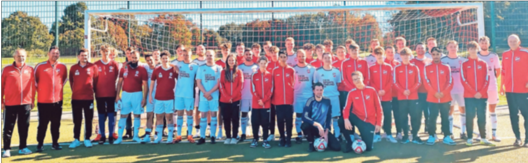
Eine starke Truppe: Wenn Jugendfußball und Seniorenabteilung der SG Neukirchen-Hülchrath mit der Perspektive Zukunft näher zusammenrücken, dann ergibt sich eine Gemeinschaft, die in der Tat beeindruckend kann.