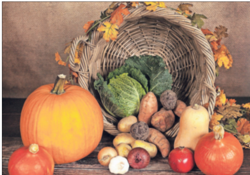
Traditionell wird der Tag des Erntedankfestes am ersten Oktobersonntag gefeiert, in diesem Jahr war es am 3. Oktober.

Grevenbroich. Als das Erntedankfest im Königreich Preußen 1773, also vor fast 250 Jahren, erstmalig auf seinen festen Termin festgelegt wurde, waren reiche Ernten nach Angaben des Rheinischen Landwirtschafts-Verbandes (RLV) selten, hingegen Missernten mit Preissteigerungen und Hungersnöten keineswegs ungewöhnlich. Eine gute Ernte habe als Glücksfall gegolten, für die Landwirte und Städter zutiefst dankbar gewesen seien. „Mit diesem Fest bringen wir traditionell unseren Dank für die eingefahrene Ernte zum Ausdruck. Auch wenn das große Angebot an Lebensmitteln eine Selbstverständlichkeit geworden ist, wenn die ständige Verfügbarkeit von Nahrungsmitteln in verschiedensten Formen, aus unterschiedlichsten Regionen der Welt und in höchster Qualität für die Allermeisten von uns