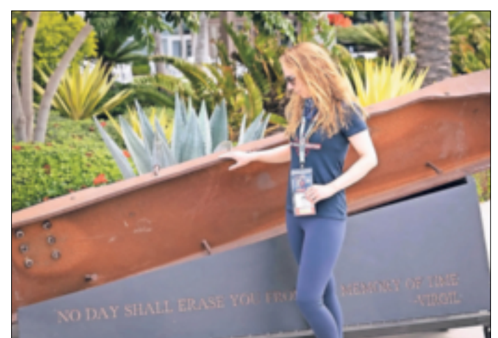
Ihr Motto: „Ehre unsere gefallenen Helden und gib denen etwas zurück, die uns heute beschützen“.