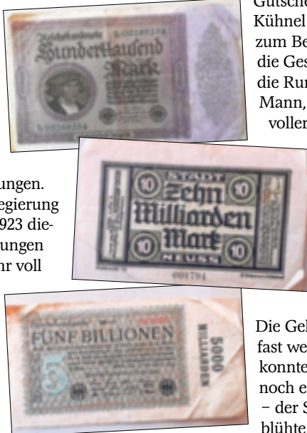
Vor hundert Jahren purzelten die Nullen nur so auf die Geldscheine.

Die Siegermächte verlangten zudem sehr hohe Reparationsleistungen. Als die Regierung Anfang 1923 diese Forderungen nicht mehr voll erfüllen konnte, marschieren belgische und französische Soldaten ins Ruhrgebiet ein, um den Forderungen Nachdruck zu verleihen. Die Regierung reagierte daraufhin mit dem „passiven Widerstand“, der Arbeiter, die Arbeit niederzulegen. Die Löhne wurden aber weiter bezahlt. Also wurde immer mehr Geld gedruckt: Über 100 Druckereien beschäftigten sich nur mit der Produktion von Geldscheinen mit immer höheren werdenden Zahlen darauf: Aus Millionen werden Milliarden, die Nullen passen schon nicht mehr auf einen Geldschein, und aus Milliarden