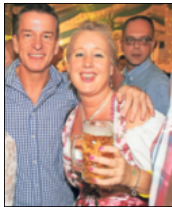
In Grevenbroich gibt es echte Wiesn-Stimmung.

In München ist das Oktoberfest seit zwei Wochen in vollem Gange – in Grevenbroich müssen die Menschen bis zum Wiesnstart noch warten. Am 21. Oktober ist es aber auch hier soweit – dann wird im großen „Volksbank Ertf“-Festzelt auf dem Kirmesplatz in der Grevenbroicher Stadtmitte gefeiert.