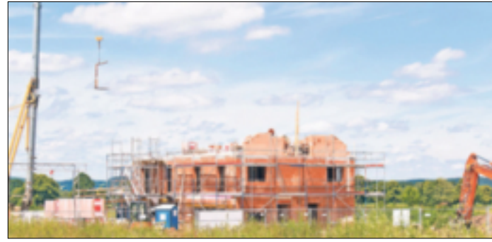
Wenn Leistungen zum Beispiel zur Erschließung eines Grundstücks im Bauvertrag als „bauseits“ vorausgesetzt werden, dann können auf den Bauherren unerwartete Zusatzkosten zukommen.

bereitgestellt werden müssen. Als typisches Beispiel für bauseitig geforderte Leistungen nennt Erik Stange, Pressereferent des Bauherren-Schutzbund e. V. (BSB), Anforderungen an das Bauland, die vom Unternehmen vertraglich vorausgesetzt werden oder vom Bauherrn zu erfüllen sind. Das können etwa die Anschlüsse ans öffentliche Strom-, Wasser-, Abwasser- und Telekommunikationsnetz, die Erschließung der Zufahrt für Baufahrzeuge oder Bereitstellung von Baustrom und anderen Baustelleneinrichtungen sein. Auch die Beseitigung von Hindernissen und Vegetation, das Einholen von Genehmigungen oder die Bauschuttentsorgung können als Bau-