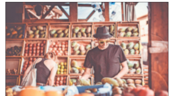
Einfach köstlich: Lokale Produkte sind gesund und besonders lecker.

Dies führt zu einem stärkeren Gefühl der Verantwortung und Sorge für die Qualität der Produkte. In einer Zeit, in der die Lebensmittelindustrie von großen Konzernen dominiert wird, gewinnen lokale Versorger und Hofläden wieder an Bedeutung. Sie bieten nicht nur frische, hochwertige Lebensmittel, sondern tragen auch zur Stärkung der Wirtschaft und des Gemeinschaftsgefühls bei. Die Wiederentdeckung kurzer Lieferketten ist ein Schritt in Richtung einer nachhaltigeren und gesünderen Zukunft der Lebensmittelversorgung. Die Bedeutung von lokalen Versorgern und Hofläden kann nicht überbetont werden. Wenn wir die Gesundheit unserer Gemeinden und unserer Umwelt fördern wollen, sollten wir diese Quellen der Nahrungsmittelproduktion unterstützen und sie zu einem festen Bestandteil unserer Einkaufsgewohnheiten machen. Es ist an der Zeit, sich mit den Wurzeln unserer Nahrungsmittelversorgung zu verbinden und die Vorteile kurzer Lieferketten zu genießen.