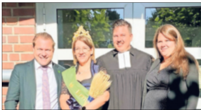
Bürgermeister, Erntekönigin und Pfarrer, glücklich vereint beim Erntedankfest am Gillbach.