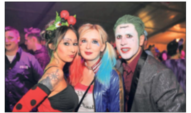
Zum Karnevalsstart am 11.11. sind Kostüme in der „Milchbar“ ausdrücklich erwünscht.

Neben den üblichen Getränken gibt es an diesem Abend auch leckere Cocktails an den verschiedenen Theken. Karten für die „Jecke Mietbar“ gibt es ebenfalls auf ticket.marcpesch.de – über die Hälfte der Karten ist bereits verkauft.