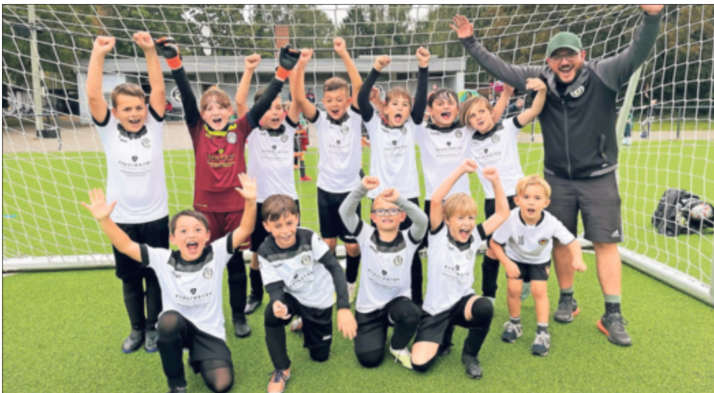
Das E3-Team hat ehrgeizige Pläne für die Zukunft, aber der Spaß am Fußball steht stets im Vordergrund, denn die Trainer sind davon überzeugt, dass Spaß, Freude und Teamgeist beim Spiel die besten Fortschritte ermöglichen.