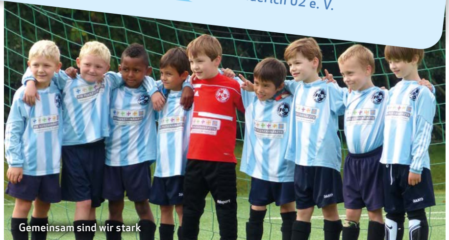
Gemeinsam sind wir stark

Das gute Miteinander macht unsere Heimatstadt Meerbusch zu einem ganz besonderen Ort. Gemeinsam schöne Momente gestalten und genießen – das ist ein Mehrwert, zu dem auch die Stadtwerke als Sponsor gern einen Beitrag leisten. Zum Beispiel im Zusammenspiel mit den Sportlern des FC Büderich 02 e. V.