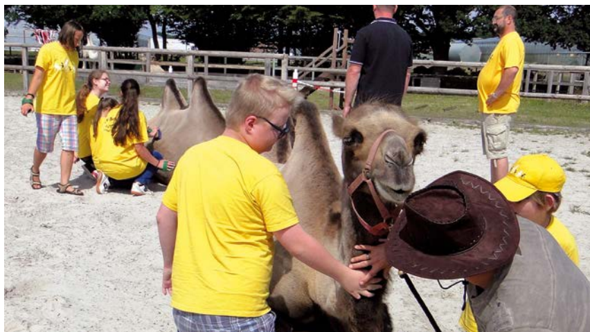
Die sanften Wüstenschiffe sind besonders bei kleinen Abenteurern beliebt