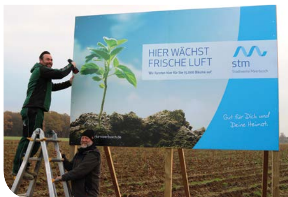
Vom Garten- und Landschaftsbau Spennes gut in Szene gesetzt: unser Schild zur Aufforstung am Kalverdongsweg