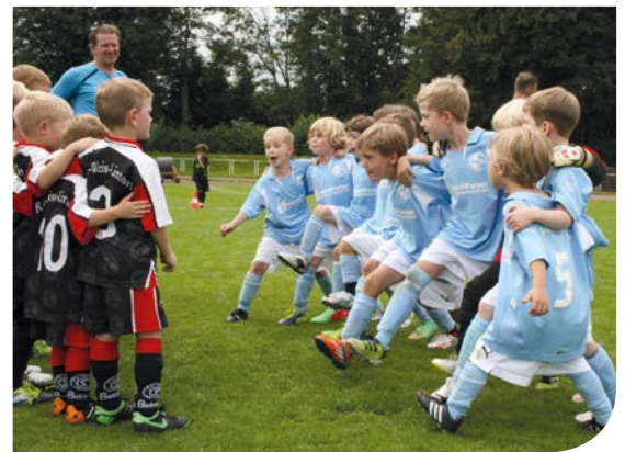
Kräftiges Anheizen vor dem Spiel