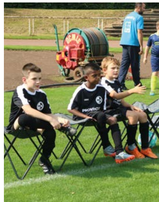
Taktik-Füchse unter sich