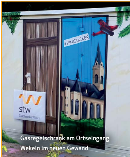
Gasregelschrank am Ortseingang Wekeln im neuen Gewand