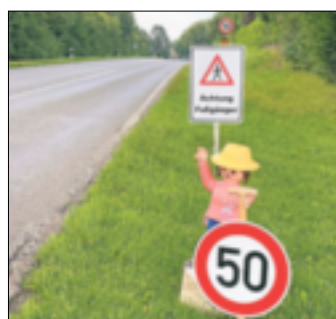
Die Playmobil-Figur wurde gewaltsam entfernt.

dem Ergebnis gekommen, dass weitere Maßnahmen nicht erforderlich seien. „Im Juli 2023 wurde die örtliche Situation durch eine erneute Beschwerde der Anwohner in unserem Hause wieder thematisiert. Da sich bis dato nichts an der Situation geändert hat, wurde in Absprache mit der Stadt Jüchen, auf die Stellungnahme aus dem Jahre 2021 verwiesen“, so der Landesbetrieb weiter. Warum beispielsweise eine Querungshilfe an dieser Stelle keine Option sei, erklärt die Stadt Jüchen: „Da es sich um einen Aussiedlerhof handelt, der im Bereich der freien Strecke an die Landstraße angebunden wurde, bestehen keine Rechtsansprüche auf den Bau von Querungshilfen, die im Außerortsbereich auch nicht zu realisieren sind.“ In den nächsten Tagen, Stand Dienstag, solle in dem Bereich ein Geschwindigkeitsmessgerät aufgestellt werden, mit dem die Verkehrsteilnehmer auf die zulässige Geschwindigkeit hingewiesen werden. „Die Auswertung wird dann an die Kreispolizeibehörde und den Rhein-Kreis Neuss weitergeleitet, damit von dort eine Geschwindigkeitsüberprüfung vorgenommen wird. Die Stadt Jüchen selbst darf keine Geschwindigkeitsmessungen vornehmen und diese ahnden“, so die Stadt weiter. Ob das etwas bringt, bleibt abzuwarten. Familie Beuters hofft es jedenfalls und appelliert an alle, umsichtig zu fahren. Daniela Furth