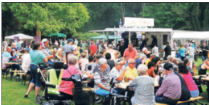
Der Heimatverein Hochneukirch lädt wieder zum traditionellen Sommerfest im Schmolderpark.