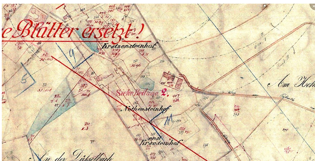
Abbildung 1: Ausschnitt aus der Ur-Katasterkarte 1830.