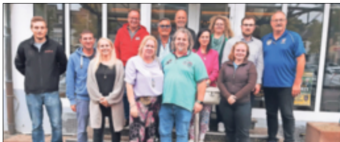
Beim „Runden Tisch“ kamen einige Akteure der „Sommersause – Jüchens Stadtfest“ zusammen.

Sonntag im September wieder ein buntes Programm rund um „Sommersause“ und Stadtlaf geben. Am 10. September ab 12 Uhr werden auf der Bühne unter anderem musikalische und tänzerische Darbietungen gezeigt, zahlreiche Jüchener Gewerbetreibende, aber auch Anbieter von außerhalb, sorgen mit ihren Ständen für Spiel, Spaß und das leibliche Wohl und natürlich kann auch wieder gebummelt werden. Sowohl an verschiedenen Ständen gibt es das eine oder andere zu entdecken und auch die Geschäfte laden beim verkaufsoffenen Sonntag zum shoppen ein. Daniela Furth