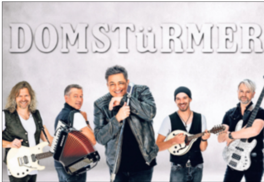
Die „Domstürmer“ werden Holz rocken.