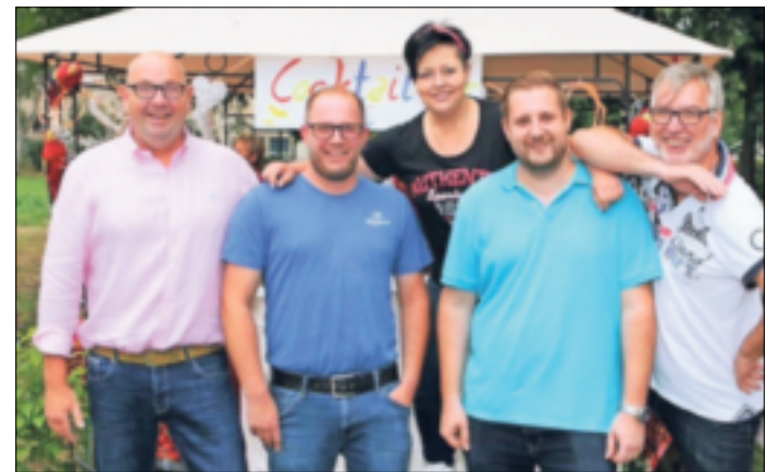
Die Band „CAEBO“ wird am Samstag und Sonntag für Stimmung sorgen.

10 Uhr: Antreten und Abmarsch zur Toten und Gefallenenehrung inklusive Zapfenstreich 11 Uhr: Gottesdienst 11.30 Uhr: Frühschoppen im Zelt inklusive Konzert der Jägerkapelle Hochneukirch