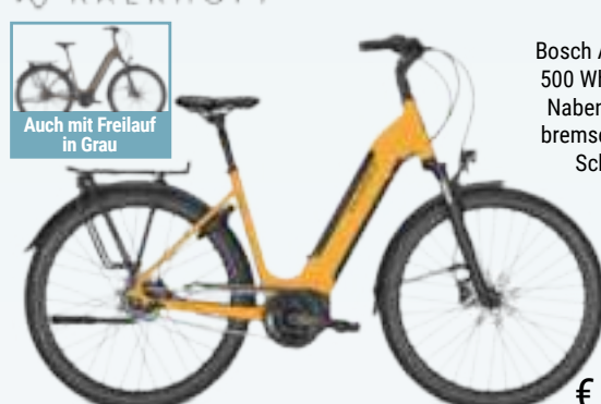
Auch mit Freilauf in Grau

E-CITY-BIKE 28" IMAGE 3.B MOVE RT Bosch Active Line Plus Antrieb, 500 Wh Akku, Shimano 8-Gang Nabenschaltung mit Rücktrittbremse, Shimano hydraulische Scheibenbremsen, Suntour Lockout Federgabel, gefederte Patent-sattelstütze