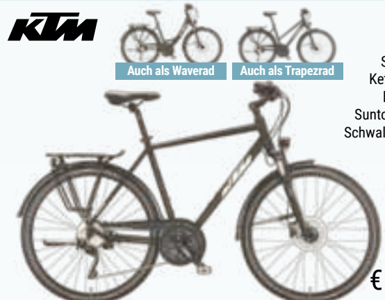
Auch als Waverad Auch als Trapezrad

TREKKING-BIKE 28" AVENZA 30 DISC Shimano Deore 30-Gang Kettenschaltung, Shimano hydr. Scheibenbremsen, Suntour Lockout-Federgabel, Schwalbe Marathon Bereifung, Alu-Rahmen