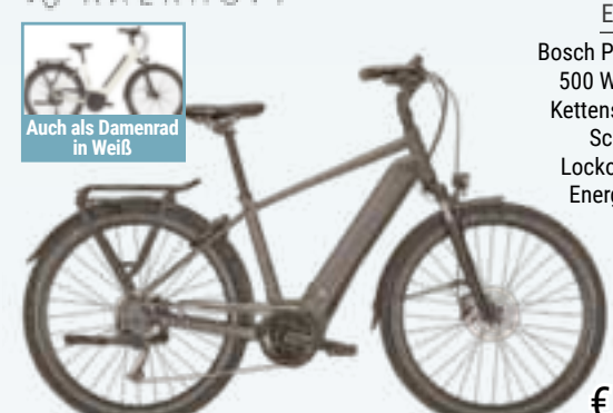
Auch als Damenrad in Weiß

E-TREKKING-BIKE 28" ENDEAVOUR 3.B MOVE Bosch Performance Line Antrieb, 500 Wh Akku, Shimano 9-Gang Kettenschaltung, Shimano hydr. Scheibenbremsen, Suntour Lockout Federgabel, Schwalbe Energizer Plus Tour Bereifung