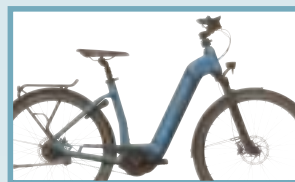
Auch in Blau mit Rücktrittbremse