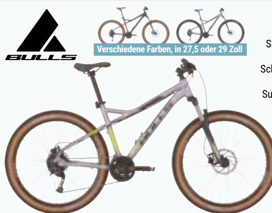
Verschiedene Farben, in 27,5 oder 29 Zoll

MTB 27,5" SHARPTAIL 3 DISC Shimano 27-Gang Kettenschaltung, Tektro hydr. Scheibenbremsen, Suntour Lockout-Federgabel, Supero Edge anti puncture Bereifung