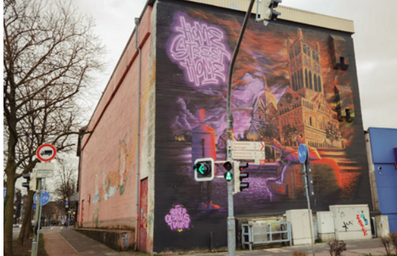
Der Hochbunker in der Neusser Innenstadt. Ein original