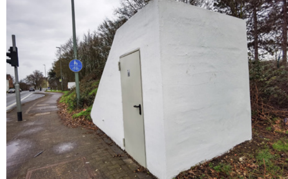
Der Uedesheimer Bunker.