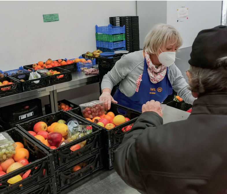
Die Arbeit der Ehrenamtler ist unverzichtbar.

E ine Welt ohne Armut ist ein ganz großer Menschheitstraum. Ein Staat, dem es gelingt, seine Notleidenden wenigstens ausreichend zu ernähren wäre immerhin noch ein wünschenswertes Ziel. Beides liegt jedoch noch in weiter Ferne, so dass Deutschland aktuell auf die Arbeit der Tafeln und deren ehrenamtlicher Mitarbeiter angewiesen ist. In NRW laufen die Fäden in