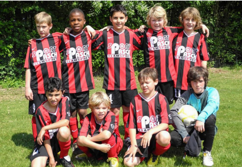
Hintere Reihe, 2. Von links: In seiner Jugend spielte der Nationalspieler Armel Bella-Kotchap beim SC Grimlinghausen.