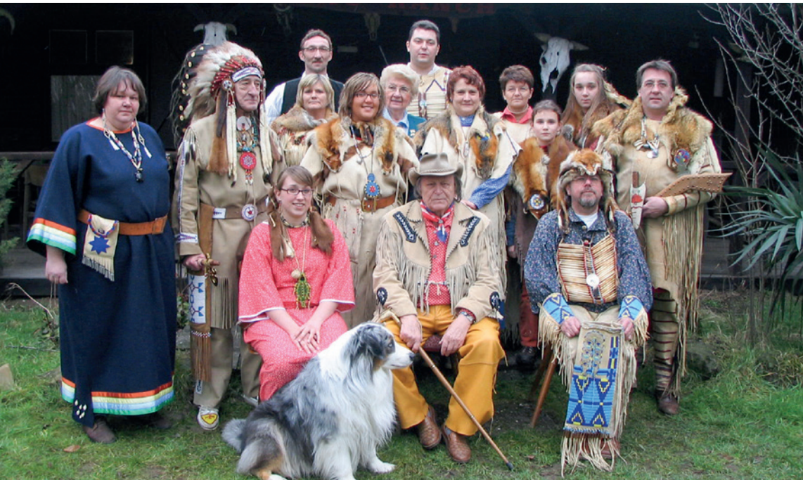
Auf der Ranch an der Bonner Straße wird der Wilde Westen wieder lebendig.

A pachen findet man in der Regel auf der anderen Seite des Atlantiks. Sie sind eine Gruppe von nordamerikanischen Ureinwohnern, die im Südwesten der USA und im Norden Mexikos beheimatet sind. Ihre Kultur, Geschichte und Traditionen haben eine wichtige Rolle in der amerikanischen Geschichte gespielt und sind bis heute relevant. Die Apachen lebten traditionell als Nomaden und waren hervorragende Jäger und Sammler. Sie lebten in kleinen Gruppen und waren in der Lage, sich schnell und effektiv zu bewegen, um Wildtiere zu jagen und Nah-