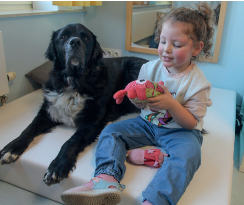
Bei ihren Logopädie-Einheiten arbeitet das Mädchen besonders gerne mit Piet zusammen.

„Piet, bringst du das Bällchen?“ So beginnt manch eine Therapiestunde für die Logopädin im Heilpädagogischen „Lukaskindergarten“. In Kaarst arbeitet sie mit insgesamt 24 Kindern zusammen, die einen besonderen Förder- und Teilhabebedarf haben. Die spezialisierte Tageseinrichtung besuchen unter anderem Kinder mit Autismus-Spektrum-Störung