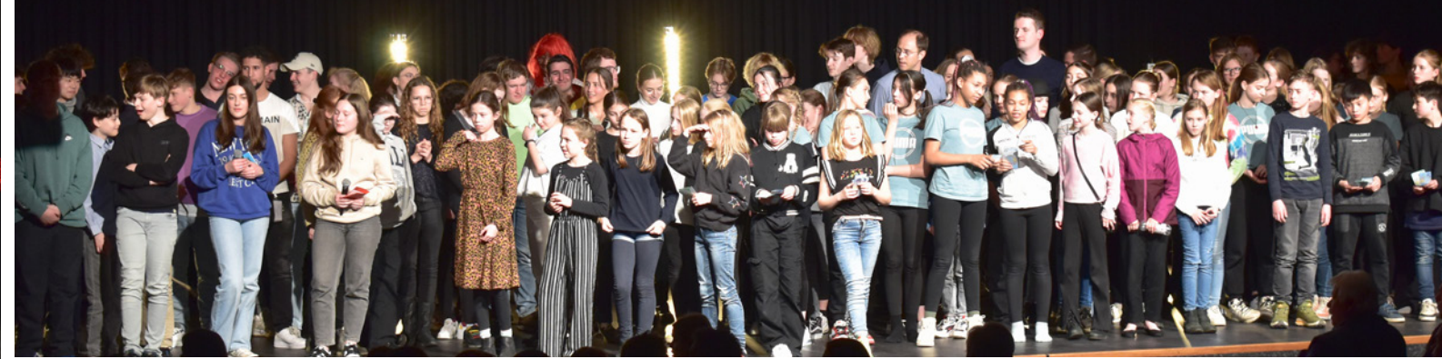
160 GBG-Schüler sämtlicher Jahrgangsstufen präsentieren ihre musikalischen, theatralen und tänzerischen Fähigkeiten am Bühner-Abend.

Ebenso gut kam der „Belly Dancer“ an, getanzt von Kindern aus dem Persönlichen Schwerpunkt Sport der Jahrgangsstufe 6. Zuvor las die Siegerin des Vorlesewettbewerbs der Stufe 6 aus dem Buch „Keeper of the Lost Cities“ von Shannon Messenger. Theatralisch wurde es mit „Langsam – eine Reise durch die Zeit“ und „Komm mit ins ... Land“, wo die Schüler aus dem Persönlichen Schwerpunkt Theater der Jahrgangsstufen 5 und 6 ihr dramatisches Können unter Beweis stellten. Der Differenzierungs-