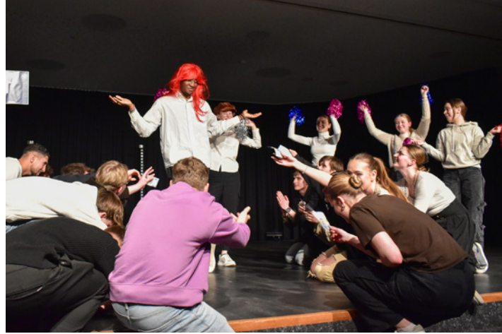
„Damenbesuch“ des Literaturkurses der Q1, frei nach „Der Besuch der alten Dame“ von Dürrenmatt.