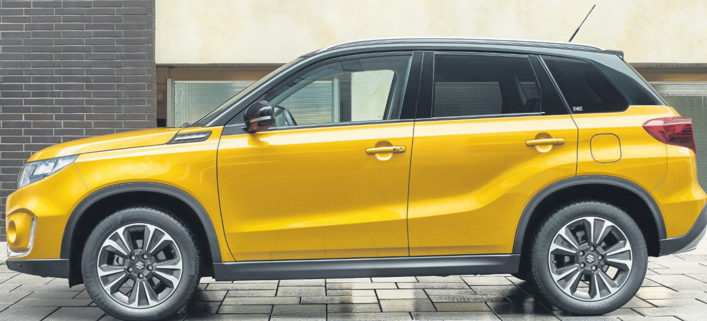
Abbildung zeigt aufpreispflichtige Sonderausstattung.