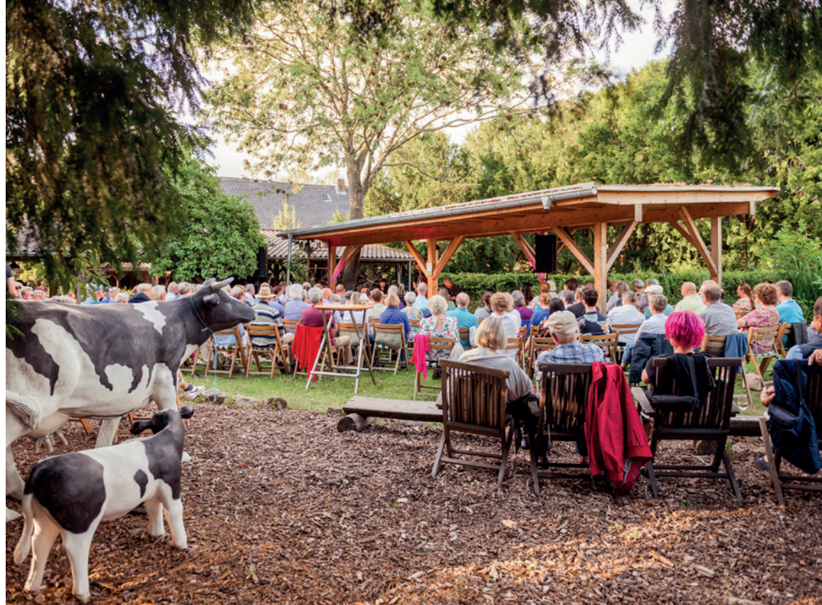
Kabarett unter freiem Himmel wird wieder im stimmungsvollen Ambiente des Tuppenhofs geboten.