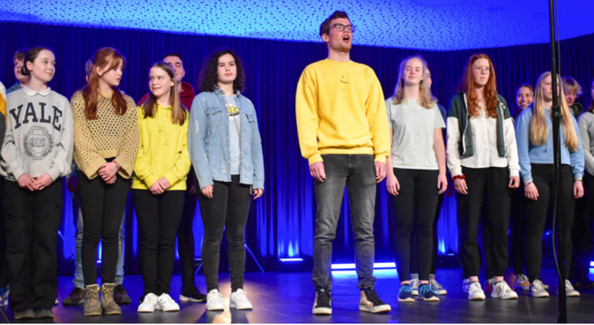
Der Große Chor des GBG mit Schülern aus der Mittel- und Oberstufe.