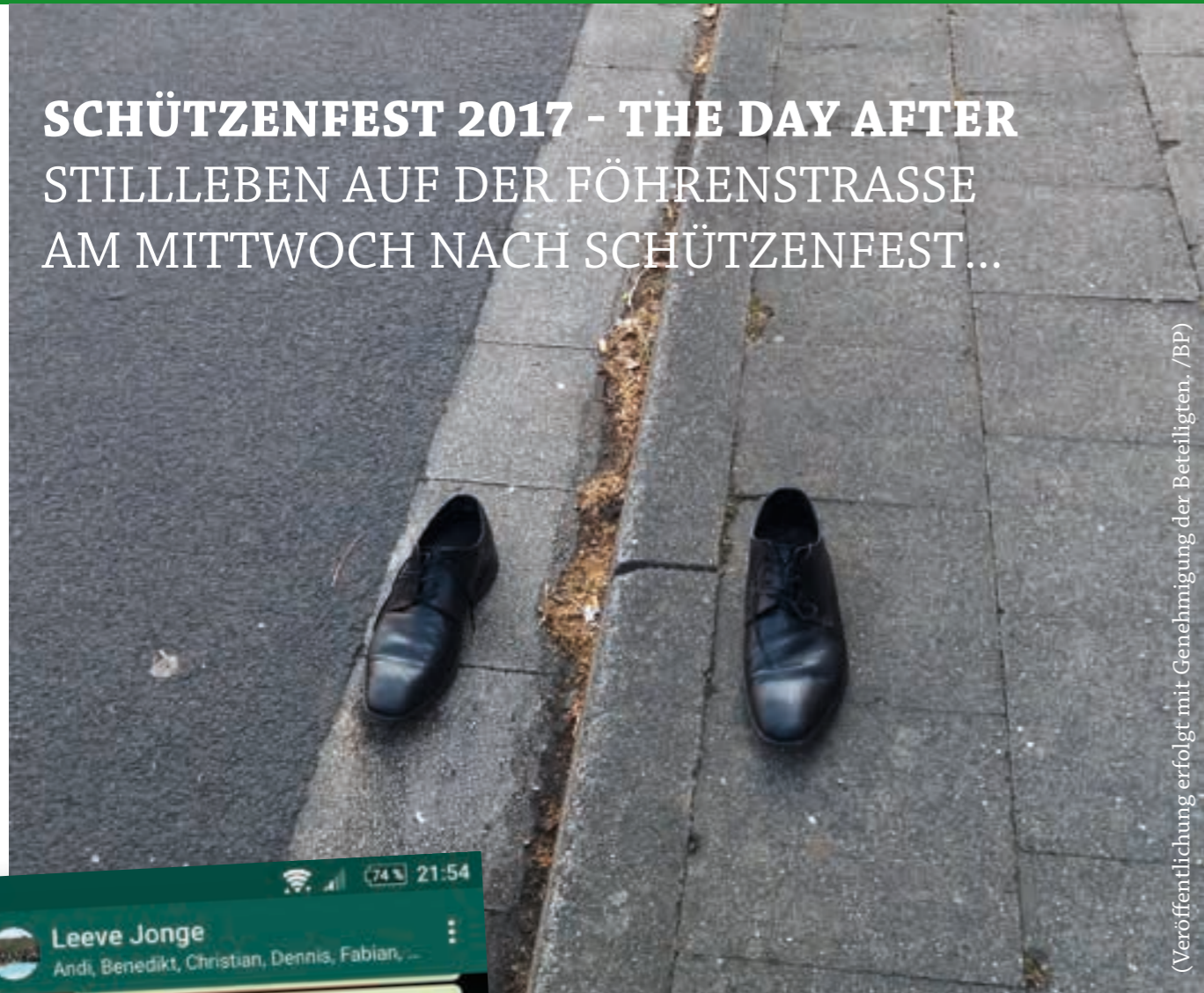
(Veröffentlichung erfolgt mit Genehmigung der Beteiligten, /BP)