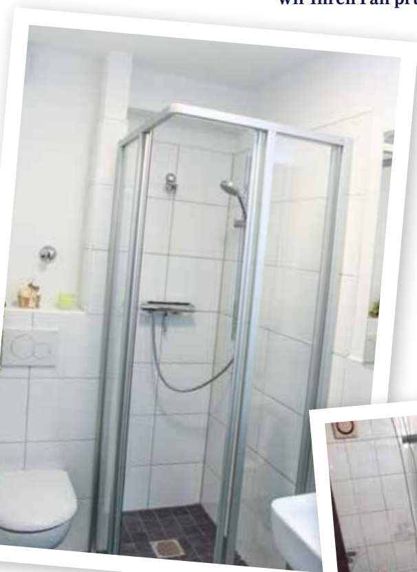
◀ Das neue Badezimmer mit Dusche nach der Sanierung

Wolfgang Müller, Mieter in der Adlerstraße