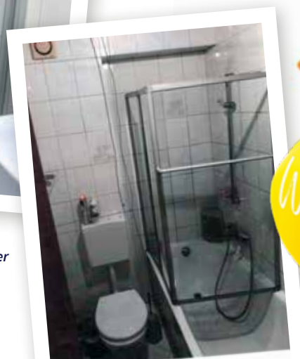
Das alte Badezimmer mit Badewanne vor der Sanierung ▶