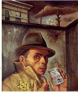
F. Nussbaum: Selbstporträt

„Zeitgleich zum 129. 'Else-Infobrief' (mit der Meldung über die Entdeckung der Übermalung des Nussbaum-Bildes ‚Rue trist‘ im Zentrum für verfolgte Künste) habe ich gerade den vierten Band der Comic-Reihe ‚Spirou oder die Hoffnung‘, 2022 neu erschienen, gelesen.