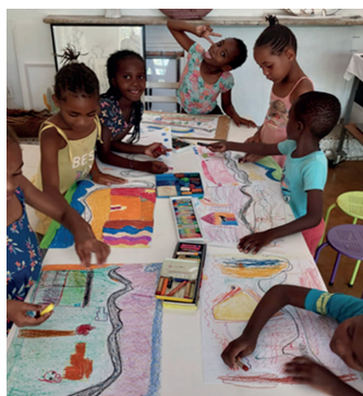
Begeistert von ELS