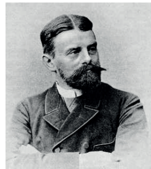
Detlev v. Liliencron um 1883

im Nachlass Dehmel, einsehbar in Dehmel digital: >Ein mir bisher unbekannter Walden, ein Musiker aus Berlin war nämlich bei mir mit seiner Frau - - früher Else Lasker. Ein klein Judenweiblein, elend, mager, mit großen Augen; Else die Tichterin ! [sic]