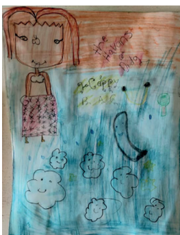
Blue for Paradise