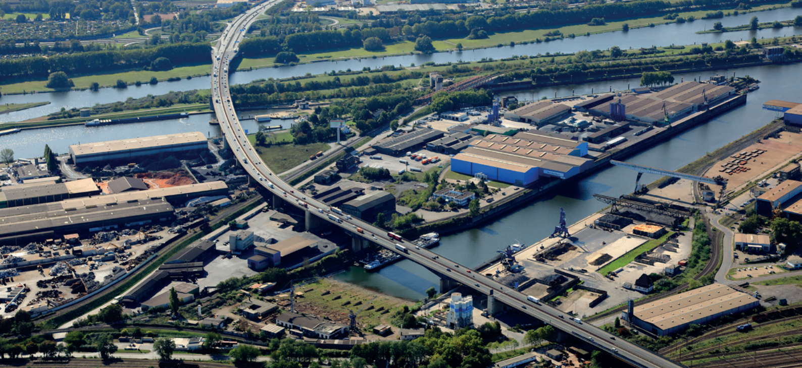
Die Berliner Brücke auf der A59 in Duisburg.