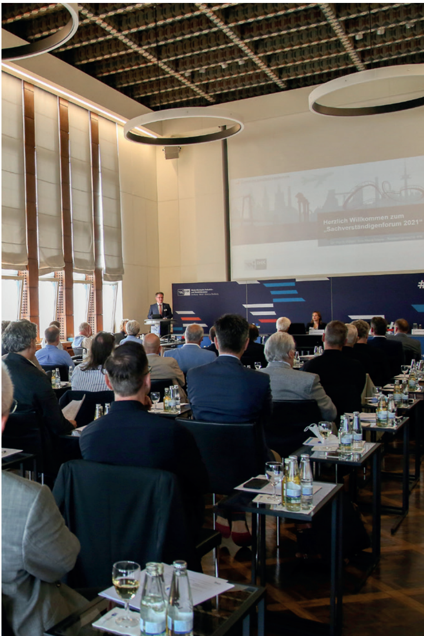
Unser Sachverständigenforum bot eine Plattform für den Austausch mit der lokalen Richterschaft.

2021 konnte im Rahmen ihrer hoheitlichen Aufgaben für den Erlaubnisbereich 133 neuen Vermittlern bzw. Beratern für Versicherungen, Immobiliendarlehen sowie Finanzanlagen mit einer Erlaubnis die Tür zur gewerblichen Tätigkeit geöffnet werden. Durch die Eintragung in das öffentlich einsehbare Vermittlerregister sorgen wir für die Marktgegenseite für die nötige Transparenz über die bestehenden Erlaubnisse. In diesem Zusammenhang liegt es der Niederrheinischen IHK am Herzen, den Informationsaustausch und die Netzwerkbildung weiter voranzutreiben. In einem Webinar zum Thema „Generation Z“ erhielten über 100 teilnehmende Vermittler eine Plattform für den Austausch.