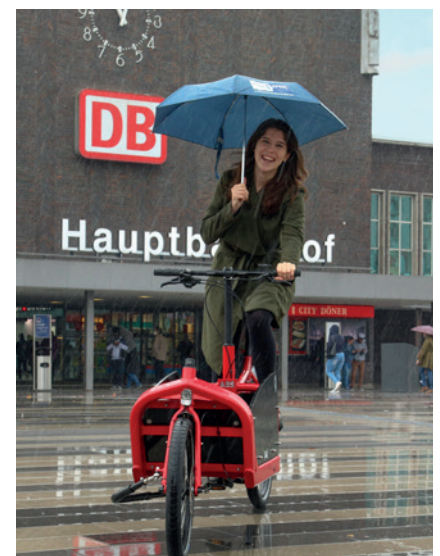
Probe fahren beim IHK-Lastenradtag.

Die Mobilität der Menschen spielt für die Unternehmen am Niederrhein eine große Rolle. Als Schwerpunkt-IHK des vom Land NRW geförderten Netzwerks „Betriebliche Mobilität NRW“ beraten wir Unternehmen und bieten den Zertifikatslehrgang „Betrieblicher Mobilitätsmanager“ an. Im Oktober 2021 haben wir bei unserem IHK-Lastenradtag auf die betrieblichen Einsatzmöglichkeiten dieser Transportfahräder aufmerksam gemacht und über Fördermöglichkeiten informiert.