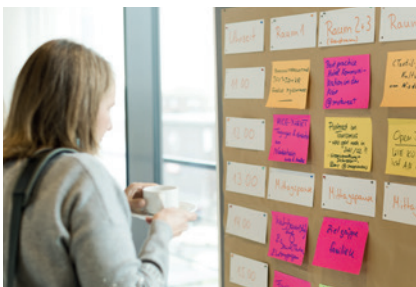
Beim „TourismusCamp Niederrhein“ in Duisburg gab es ausreichend Gelegenheit zum Austausch.

Die Digitalisierung eröffnet Handel, Gastronomie, Hotellerie und Tourismus wichtige Chancen, stellt die Betriebe aber auch vor große Herausforderungen. Mit den Förderprogrammen „NRW-Digitalzuschuss Handel“ und „NRW-Digitalzuschuss für die gast-