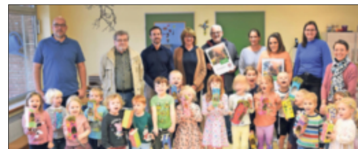
Die Mitglieder des Obst- und Gartenbauvereins und die Kinder des Kindergartens „St. Peter“ Königshoven waren die Gewinner des vorjährigen Klimaschutzpreises.

sich ebenfalls für den Umweltschutz stark zu machen“, betont Michael Kesternich, Kommunalmanager bei „Westenergie“. Bewerber können ihre Unterlagen bis zum 15. September unter https://klimaschutzpreis.westenergie.de/bewerbungsformular einreichen.