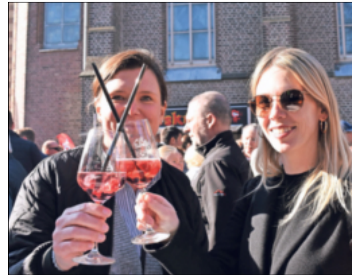
Natürlich gibt es zu den Köstlichkeiten von den Foodtrucks auch die passenden Getränke.

Bei der „Teufelsküche“ aus Willich gibt es Currywurst in verschiedenen Schärfegraden. „Ellis kölsche Küche“ möchte die Besucher mit kölschen Tapas und „Pulled Pork“ begeistern, aus Köln kommen „Daniels