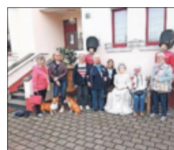
Die Damen der ehemals aktiven Kameraden grüßen vom „Little Britain“.

Auf dem Programm standen neben einer Gondelfahrt von der Festung Ehrenbreitstein zum „Deutschen Eck“ auch eine Schiffsrundfahrt, ein Besuch der Loreley sowie eine Besichtigung des höchsten Kaltwassergeysirs der Erde in Andernach. Eine Weinprobe und gemütliche Abende rundeten das tolle Programm ab. Da man größtenteils ausgesprochenes Glück mit dem Wetter hatte, war dieser Ausflug rundum ein voller Erfolg, waren sich alle einig.