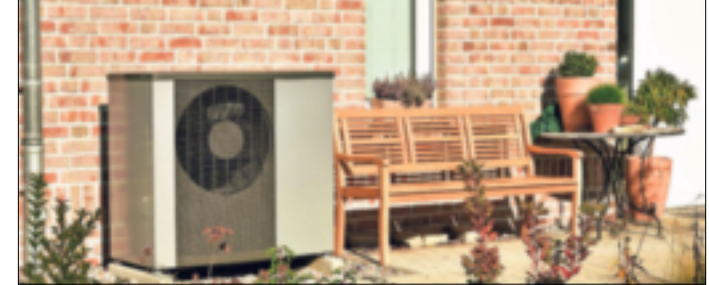
Auch im Bestandsbau kann eine Wärmepumpe ältere, ineffiziente Gas- oder Ölheizungen ersetzen.

Luft-Wasser-Wärmepumpe ist vergleichsweise teuer – die Alternative kann die Pacht sein. Energiedienstleister unterstützen Hauseigentümer mit entsprechenden Paketlösungen. Nutzer zahlen für eine vertraglich festgelegte Zeit von 15 Jahren ein monatlich festes Entgelt. Enthalten sind Anlagenkosten, Planung, Beantragung der Fördermittel, Einbau sowie Entsorgung der Altheizung. (djd)