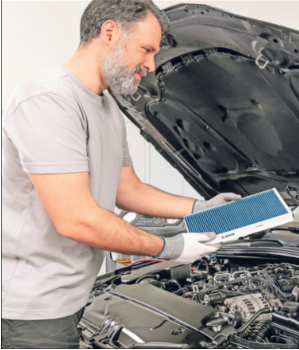
Entspannt Richtung Erholung starten: Die meisten nutzen das eigene Auto, um ihr Urlaubsziel zu erreichen.