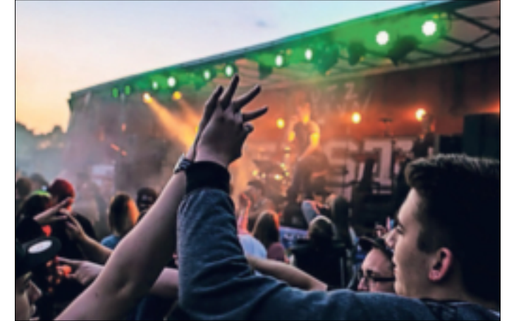
Erinnerungen an die Festival-Zeit vor Corona... Jetzt soll das Comeback gefeiert werden...

„Erft-Jägern“. Und siehe da: Weitere Licht-Elemente und eine noch bessere Anlage bringen großes Festival-feeling an den „Hemmedener Weg“. Ergänzend zum Neuen, zählt auch das Altbewährte: Leckere Biergetränke von „Erdinger“ werden dieses Jahr von leckerem Wein begleitet: „Die alle bei Sonnenschein besonders gut schmecken“, erklärt Drahs. Natürlich kann man während des Turniers auch etwas gewinnen. Neben den beiden Siegerpokalen steht der traditionelle „Gothaer-Elfer“ auf der Tagesordnung. Auch die „Kleinen“ kommen auf ihre Kosten: Hüpfburg und Fußballdarts schmücken den Sportplatz, genau wie ein Freundschaftsspiel der Edelknaben des BSV Wevelinghoven