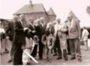
1982 Gründung des Förderkreises