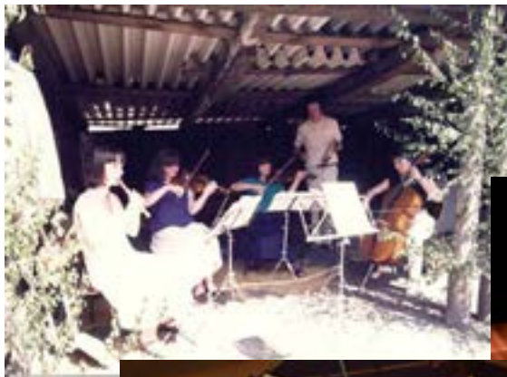
Konzerteröffnung in der noch „offenen“ Remise