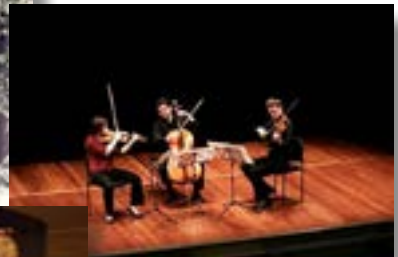
Streichtrio des Netherlands Symphony Orchestra