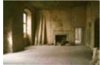
1985 Sanierung des Herrenhauses