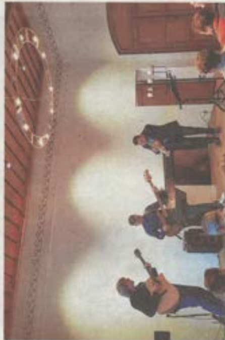
Jazzige Weihnachtslieder spielte – mal nicht in der Remise, sondern im Foyer des Haupthauses – das Trio „Chamber Jazz“.

„Chamber Jazz goes Christmas“ entwickelte einen eigenen swingender Sound; mal verspielt und tiefstimmig, mal frech und fröhlich, aber auch melancholisch und ganz zart – als kammermusikalischen Jazz für Gitarre, Trompete und E-Bass.