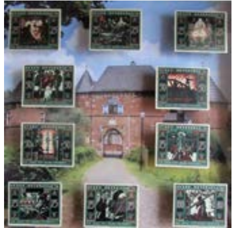
Notgeldrahmen der Stadtsparkasse Oberhausen für das Archiv

Der Förderverein Burg Vondern ist seit diesem Sommer reich. Eine ganze Serie von Geldscheinen liegt inzwischen im Archiv des Förderkreises. Aber einkaufen kann der Vorstand damit nicht. Notgeld hat nur für Sammler einen Wert. Notgeld ist aus der Not heraus geborenes Geld. Die im Archiv schlummernden Scheine erinnern an die harte Zeit des ersten Weltkrieges und der Weimarer Republik, als die Inflation galoppierte. Bei Notgeld handelt es sich um ein Stück Wirtschaftsgeschichte – hier im Besonderen die Phase zwischen 1916 und 1923. Ende des ersten Weltkrieges wurden die kleinen Geldmünzen aus Messing und Eisen für Kriegszwecke verwendet. Sie wurden eingeschmolzen, um daraus Rüstungsgüter herzustellen.