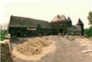
1986 Erneuerung des Burghofes mit dem Pflaster des Osterfelder Marktplatzes