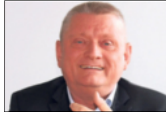
Liebe Leserinnen, liebe Leser,

haben Sie schon einmal mit aller Kraft geschrien, aber niemand hört Sie, fast so als wären Sie gar nicht da? So fühlen sich die Menschen im Iran seit Jahrzehnten. Doch nun ändert sich etwas. Für viele war der Tod von Masha Amini genug, vor allem mutige Frauen tragen Proteste quer durch das ganze Land. Ihren Ausruf „Frauen, Leben, Freiheit!“ hört auch das deutsche Parlament. Über 230 Abgeordnete haben politische Patenschaften übernommen. An eine derart große Initiative erinnere ich mich nicht. Unser Einsatz ist bitter nötig, das Regime geht mit brutaler Gewalt vor. Es sperrt Menschen ohne Beweise weg, führt Scheinverfahren, verhängt und vollstreckt Todesurteile, versucht Kritik mundtot zu machen. Genau hiervon berichtete mir auch eine Gruppe christlicher Iranerinnen und Iraner, die in und um Neuss Zuflucht und eine neue Heimat gefunden ha-