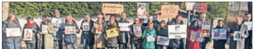
Hermann Gröhe (Fünfter von links) hat am Dienstag gemeinsam mit über 30 Bundestags-Abgeordneten vor der iranischen Botschaft in Berlin protestiert. Alle beteiligten Abgeordneten verbindet, dass sie politische Patenschaften für verfolgte, verurteilte oder mittlerweile hingerichtete Menschen im Iran übernommen haben.

Ihr Hermann Gröhe (MdB) Stellvertretender Vorsitzender der CDU/CSU-Bundestagsfraktion