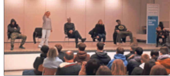
Schauspieler einer Theatergruppe aus Meerbusch trugen fünf Gewaltverfahrungen vor. Die Realschüler hörten gebannt zu.

Wevelinghoven. Einer von ihnen ist besonders auffällig und stellt sich den Jugendlichen schließlich selbst als „Nazi“ vor, der aufgrund einer Auflage des Gerichts an dieser Veranstaltung teilnehmen müsse. Ohne Reue berichtet er, wie er den vietnamesischen Ladenbesitzer, der seine Mutter kurz zuvor entlassen hat, mit