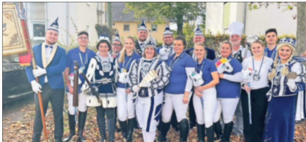
Das Orkener Dreigestirn mit seiner Entourage: „Wir sind sehr stolz so eine unglaubliche Crew hinter uns stehen zu haben, ohne die alles nur halb so viel Spaß machen würde.“