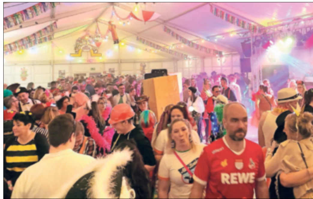
Beste Stimmung ist an den Karnevalstagen in den Rommerskirchener Partyzelten seit Jahren absolut garantiert.