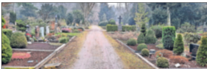
Der Friedhof – ein Ort der Ruhe und des Gedenkens: Ein selbstbestimmt gestalteter Abschied entlastet die Angehörigen im Trauerfall seelisch und finanziell.

malige Einzahlung, Teilzahlung möglich) oder einer Sterbegeldversicherung (wird in Raten angespart, Einmalzahlung möglich). Der Bestatter ist verpflichtet, auf Wunsch einen transparenten Kostenvorschlag zu erstellen. Das Angebot eines Bestattungsunternehmens setzt sich aus drei Kostenblöcken zusammen: – eigene Dienstleistungen und Lieferungen – Fremdleistungen (Todesanzeigen, Blumen usw.) – Friedhofs- und sonstige Gebühren Bei der Bestattung handelt es sich um eine sehr individuelle und hochkomplexe Dienstleistung, für die eine seriöse und eingehende Beratung nötig ist. Der Bundesverband Deutscher Bestatter rät, rechtzeitig bei einem Bestattungsinstitut einen Kostenvorschlag einzuholen, gegebenenfalls auch Vergleichsangebote. Unter www.bestatter.de steht online ein – vom Verbraucherportal „Finanztipp“ empfohlener – Bestattungskostenrechner zur unverbindlichen Vorab-Kostenschätzung zur Verfügung. Auf Wunsch können die in der Schätzung zusammengestellten Wünsche dann zu einem Bestatter nach Wahl weitergeleitet werden. Dieser erstellt dann ein individuelles Angebot. Weiterführende Informationen zur Bestattungsvorsorge gibt es unter www.bestatter.de/bestattungsvorsorge .