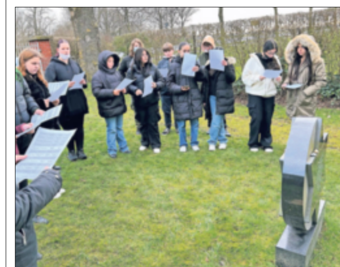
Die Namensverlesung der Holocaust-Opfer auf dem jüdischen Friedhof Wevelinghoven.