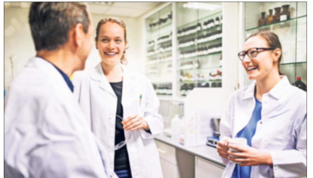
Teamarbeit und abwechslungsreiche Aufgaben machen den Beruf des pharmazeutisch-technischen Assistenten so interessant.

Rhein-Kreis. Zu gewissen Zeiten im Leben müssen die beruflichen Weichen (neu) gestellt werden – sei es nach dem Schulabschluss oder wenn man sich beispielsweise nach der Elternzeit umorientieren möchte. Allerdings ist es nicht immer leicht, den Traumjob zu finden, denn die Auswahl ist riesig. Viele können zudem nicht einschätzen, was sie konkret in einem Beruf erwarten, welche Möglichkeiten er eröffnet und wie es um die Zukunftsaussichten bestellt ist. Apotheker Matthias Fischer spricht sich für eine Ausbildung zum pharmazeutisch-technischen Assistenten aus: „Dieser Beruf bringt ein wirklich spannendes und breit gefächertes Betätigungsfeld mit sich.“ Das gilt besonders für die Arbeit in der Apotheke. „Die Aufgaben reichen hier von der Kundenberatung über die Hilfsmittelversorgung und Labortätigkeiten bis hin zu Dokumentation und Qualitätsmanagement – dadurch ist der Job immer wieder abwechslungsreich und anspruchsvoll“, erklärt der Experte. Zudem gibt es noch viele weitere Einsatzmöglichkeiten, zum Beispiel in der Pharmaindustrie, in Kliniken und Laboren sowie bei Krankenkassen oder Gesundheitsämtern. Matthias Fischer: „Gerade in der Apotheke jedoch machen der zwischenmenschliche Kontakt und das gute Gefühl, den Kunden zu helfen, den Job so reizvoll.“ Dabei genießt der Beruf ein hohes Ansehen und ist zukunftssicher. „PTAs haben keine Probleme, eine Stelle zu finden – sie werden sogar händelnd gesucht“, weiß