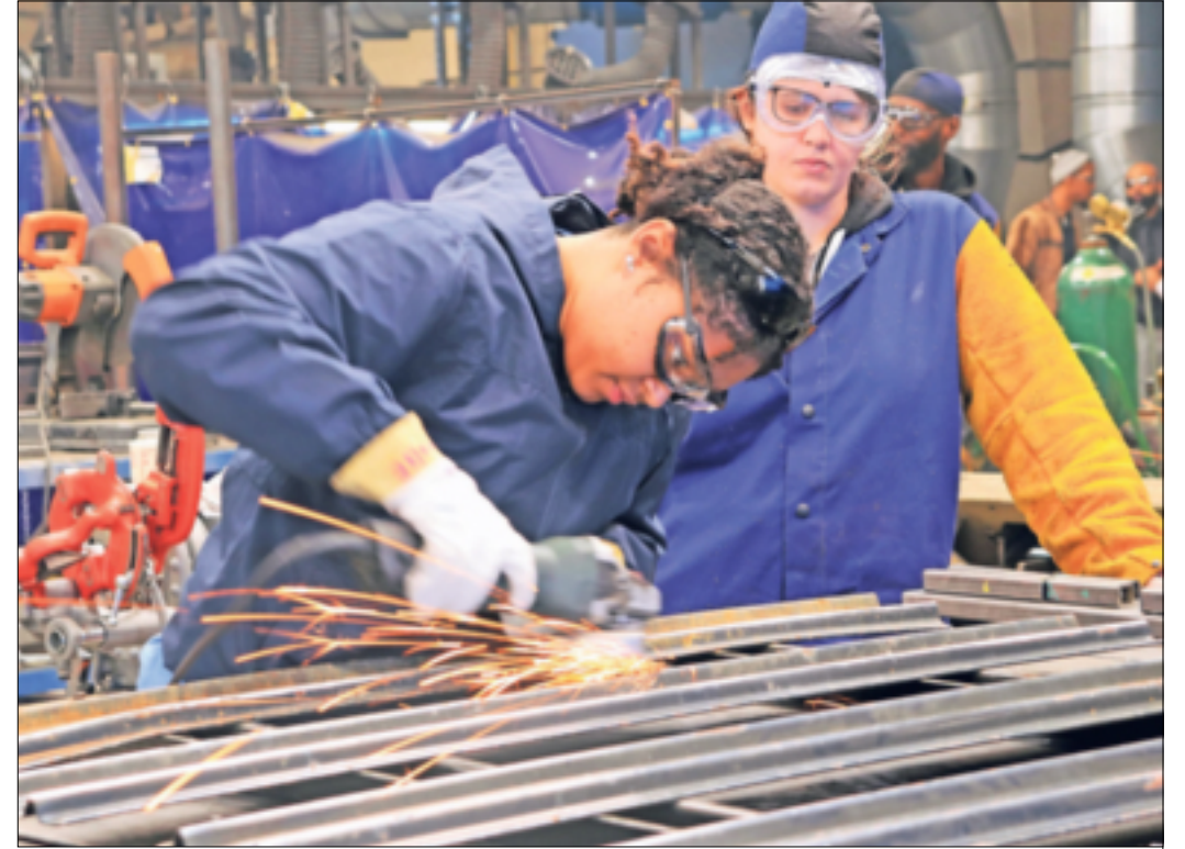
In vielen technischen und handwerklichen Berufen werden Fachkräfte händeringend gesucht. Das eröffnet vielfältige Chancen für einen Quereinstieg.

Der Fachkräftemangel in Deutschland erreicht neue Höchststände. Einer Studie der KfW Förderbank und des Instituts der deutschen Wirtschaft zufolge bremsen er mittlerweile die Geschäfte von fast jedem zweiten Unternehmen. Besonders betroffen sind der Gesundheitssektor mit der Alten- und Krankenpflege, aber auch technische Berufe und das Handwerk. Wer momentan auf der Suche nach einer neuen Stelle ist, hat gute Chancen, über einen Quereinstieg in einer anderen Branche neu zu starten.