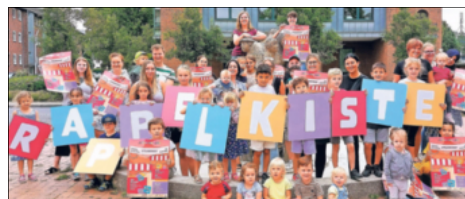
Sie alle stehen für und hinter der „Rappelkiste“.

begeistert: „Schon nach kurzer Zeit ist hier etwas Großartiges entstanden. Die ‚Rappelkiste‘ ist zu einem beliebten Ort geworden, der Begegnung und Austausch in angenehmer Atmosphäre für Familien möglich macht. Für die hohe Akzeptanz sind wir ausgesprochen dankbar.“ Das neue Programm reicht vom Geburts- und Elternvorbereitungskurs, von Babysmassage und Baby-Yoga über eine Stillgruppe bis hin zu Kindertanz und „Klangkiste“. Auf unterschiedliche Weise kann so der Familienalltag entlastet,