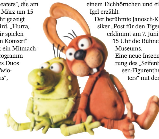
„Nulli & Priesemut“ sind nur zwei der beliebten Kinderfiguren, die in diesem Jahr im Museum zu Gast sind.

Finanziert wird die Reihe „Kinderkulturbühne“ durch den Förderverein des Museums. Alle Karten zu den Vorstellungen gibt es an der Museumskasse zum Preis von sechs Euro. Für Kindertagesstätten sind Vormittagsvorstellungen über die Telefonnummer 02181/608-654 buchbar.