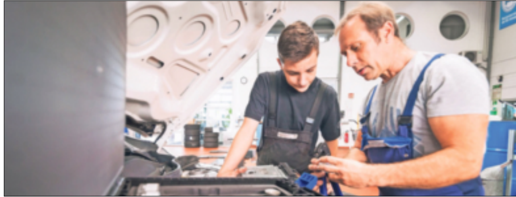
Eine Ausbildung im Kfz-Gewerbe eröffnet vielfältige Berufsbilder und Karriereoptionen.

Wer sich daher für eine Karriere im Kfz-Gewerbe entscheidet, leistet einen wichtigen Beitrag, um unsere Welt am Laufen zu halten. Vielleicht deshalb stehen Berufe rund um Fahrzeuge und Mobilität auch heute hoch im Kurs - alleine 2021 sind über 90.000 junge Menschen im Kfz-Gewerbe ins Berufsleben eingestiegen.