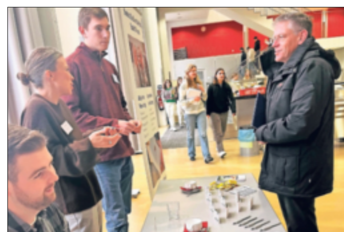
Berufsberatungstag in Neuss.