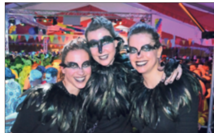
„Da simmer dabei“ kann schon auf eine sehr lange Tradition verweisen.

geboten. Vor dem Zelt wartet ein Imbiss auf die Besucher. Aus den allermeisten Grevenbroicher Stadtteilen wie Kapellen, Neukirchen, Stadtmitte, Orken, Gustorf, Frimmersdorf, Laach, Südstadt oder Neurath fahren Shuttle-Busse die Besucher für einen überschaubaren Fahrpreis zum Zelt und nachts auch wieder nach Hause. In den vergangenen 20 Jahren war „Da simmer dabei“ regelmäßig weit im Vorfeld ausverkauft – und das, obwohl die Veranstaltung regelmäßig im Stadtgebiet auf „Wanderschaft“ war. Die ersten Veranstaltungen von 2004 bis 2006 fanden in Wevelinghoven statt, anschließend von 2007 bis 2014 in Kapellen, danach zweimal in Noithausen und seitdem wieder in Wevelinghoven. Auch diesmal empfehlen die Veranstalter: Karten unbedingt im Vorfeld sichern – auf tickets.marc-pesch.de .