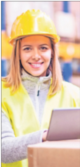
Glücklich im neuen Job: Eine Umschulung eröffnet langfristig berufliche Perspektiven. Den Weg zum Abschluss muss man nicht alleine beschreiten.

Gesundheitliche Probleme, Jobverlust oder eine veränderte Familiensituation: Die Umschulung in einen anderen Beruf kann aus verschiedenen Gründen notwendig werden. Sie wird bis zu 100 Prozent vom Staat gefördert - etwa durch einen Bildungsgutschein der Agentur für Arbeit oder des Jobcenters.