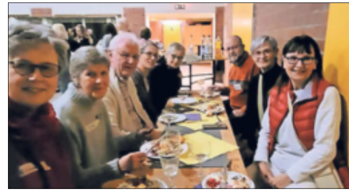
Das ist die Stamm-Mannschaft der Grevenbroicher Starthelfer, die sich für Flüchtlinge engagieren.

Die Tische bogen sich unter den vielen selbst gemachten landes- typischen Speisen. Anlass war das traditionelle Neujahrsfest, das in der Ukraine noch wich- tiger ist als Weihnachten. Etwa 70 Flüchtlinge aus der Ukraine waren in der GoT in der Süd- stadt zusammengelassen, um dieses bedeutende Fest gemein- sam zu feiern.