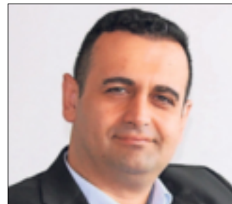
Bijan Djir-Sarai organisiert als Generalsekretär der FDP Deutschlands deren Zentrale in Berlin.

Ich kann verstehen, dass sich so mancher lieber in „Netflix“ und „Amazon“ flüchten möchte, anstatt sich mit der aktuellen Lage auseinander zu setzen. Doch wenn wir resignieren und ins Private fliehen, überlassen wir das Feld denjenigen, die dies ausnutzen. Wir überlassen es dann den autoritären Regimen, die ihre Bevölkerung weiter abschlachten, weil sie meinen, es schaue ohnehin keiner zu.