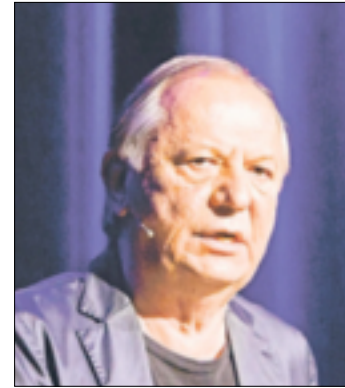
Wilfried Schmickler ist einer der großen Politikabertisten dieses Landes.

dem Optimist!“. Der virtuose Sprachjongleur zeigt sich diesmal von einer ungewöhnlich versöhnlichen wie humorvollen und philosophischen Seite. Sein Versprechen: „Diesmal sind die Lieder so hinreißend schön, dass nur die ganz Aufmerksamen merken, wie frech die Texte wirklich sind.“