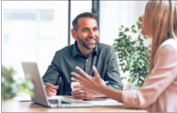
Endlich den persönlichen Traumjob finden: dabei kann ein Bewerbungscoaching helfen und etwa ein selbstbewusstes Auftreten trainieren.

Ein umfassender Lebenslauf und ein ansprechendes Motivationsschreiben allein reichen heutzutage oft nicht mehr aus, um einen Traumjob zu ergattern. Wenn es mit der Einladung zum Bewerbungsgespräch nicht richtig klappen will, obwohl alle Anforderungen an die ausgeschriebene Stelle erfüllt sind, kann es am Bewerben selbst liegen - denn das ist ein ganzheitlicher und komplexer Prozess. Vielen Jobsuchenden hilft deshalb ein Bewerbungscoaching.