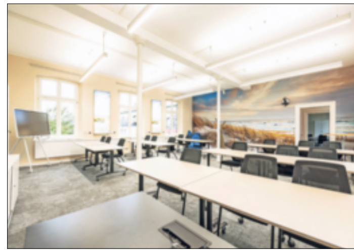
Seminare, Lehrgänge und individuelle Coachings finden in den Räumen des Technologiezentrums statt.

Qualifizierung und persönliche Entwicklung als Erfolgsfaktor für Arbeitnehmer/innen Wer sich von seinen Mitbewer-