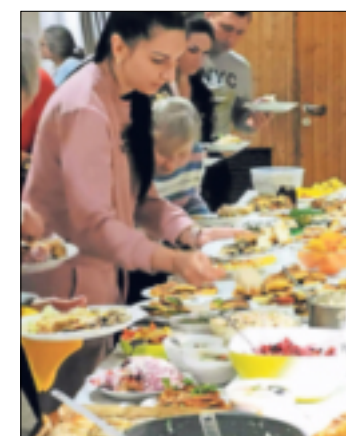
Ukrainische Köstlichkeiten kamen auf den Tisch.