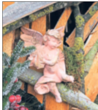
Dieser Engel hat schon seinen festen Platz in der aktuellen Krippe gefunden.