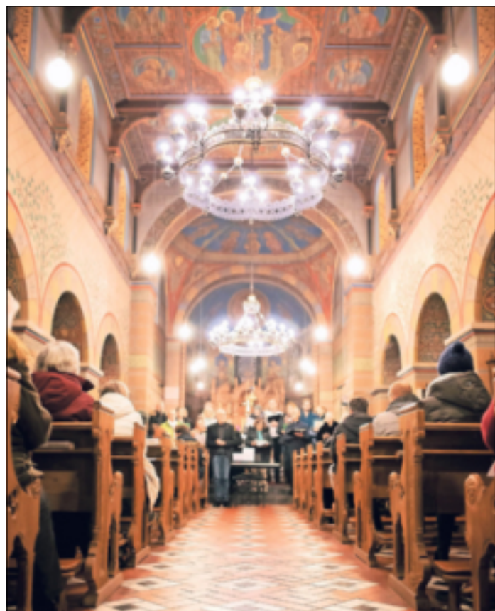
Ob es im nächsten Jahr auch wieder ein Weihnachtssingen mit Weihnachtsmarkt in Oekoven geben wird? Wenn es nach den leuchtenden Kinderaugen geht – unbedingt!