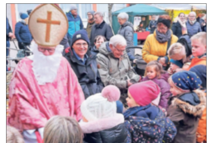
Der Nikolaus hatte beim Einschaltfest der „Kapellener Jonge“ für jeden etwas dabei.

die Hälfte der Sterne verzichtet. Dabei ist der Wunsch, dass man die weihnachtliche Beleuchtung mit den Sternen gar noch ausweitete, bei den Kapellenern doch sehr präsent“, resümiert Tim Altrogge, Sprecher der „Kapellener Jonge“. Er bedankt sich bei dem „Regenbogenchor“ für die stimmungsvolle Einleitung in einen vorweihnachtlichen Nachmittag und für die freundliche Unterstützung des BSV, der AWO und des TV „Jahn“.