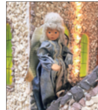
Noch ein aus der Politik gestifteter Engel: Annegret Kramp-Karrenbauer schickte ihn spät!