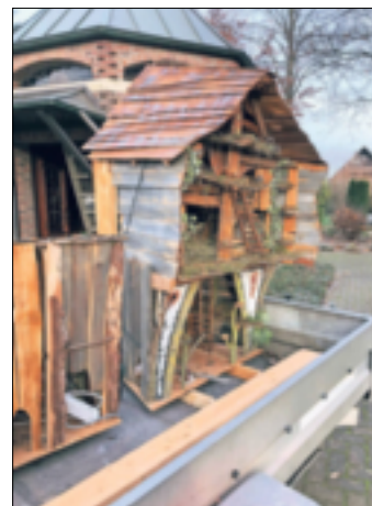
Teile der aktuellen Krippe noch auf dem Anhänger.

Kapellen. Viele der Vorläufer-Krippen hütet Günter Pesch in