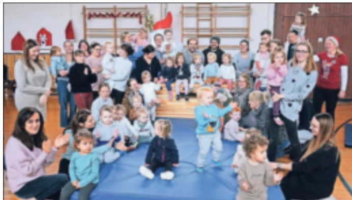
stättliche Gruppe Ninjas machten Station in der heimischen Halle.

Hemmerden. Der Beginn mit den Kleinsten im Verein war praktisch Programm: „Da sind wir wieder“. Nach drei Jahren Corona-Pause endlich wieder Nikolausturnen beim TV Hemmerden. Im Geräteparkour wurde geklettert, gesprungen und gerutscht.