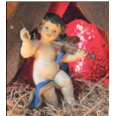
Ein klassisches Putten-Engelchen. Die Sammlung von Günter Pesch ist vielfältig.