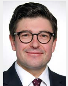
GERICHT IN KÜRZE zusammengestellt von Referent Carl Georg Müller, StGB NRW

Der Eingriff in die Berufsfreiheit der Beschwerdeführerinnen aus Art. 12 Abs. 1 GG durch deren Indienstnahme als Zahlstelle für die Übernachtungsteuer sei ebenfalls gerechtfertigt. Eine für die Beschwerdeführerinnen weniger belastende Bestimmung zum Steuerentrichtungspflichtigen stelle kein gleich geeignetes Mittel dar, da die Haftung als Steuerschuldner für die Durchsetzung der Steuerpflicht offensichtlich effektiver ist. Eine direkte Erhebung bei den Übernachtungsgästen wäre nicht praktikabel. Den Beschwerdeführerinnen sei es insgesamt zumutbar, die Steuererhebung durch ihre Mitwirkung zu ermöglichen. Durch die Pflichten insbesondere zur Steueranmeldung sowie zur Abführung der Steuer entstehe ihnen zwar ein zusätzlicher, allein der Übernachtungsteuer geschuldeter Aufwand. Diese zusätzlichen Pflichten im Besteuerungsverfahren stellten aber eine unternehmenstypische Tätigkeit dar, die über ähnli-