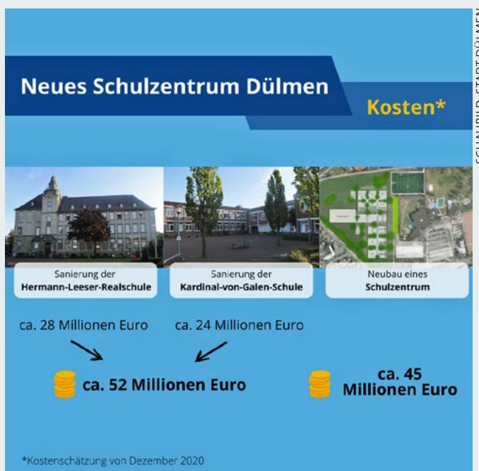
SCHAUBILD: STADT DÜLMEN

(André Siemes, Pressesprecher der Stadt Dülmen)