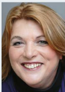
EUROPA-NEWS zusammengestellt von Barbara Baltsch, Europa-Journalistin, E-Mail: barbara.baltsch @kommunen.nrw

von verschiedenen Finanzierungsquellen entwickeln und testen sowie regionale und nationale Programme mit EU-Initiativen für den ökologischen und digitalen Wandel vernetzen. Die Partnerschaften werden in die neue Agenda für Innovation für Europa einfließen, die den Wandel hin zur Nachhaltigkeit durch Innovation vorantreiben und lokale Strategien mit Initiativen auf EU-Ebene verknüpfen soll.