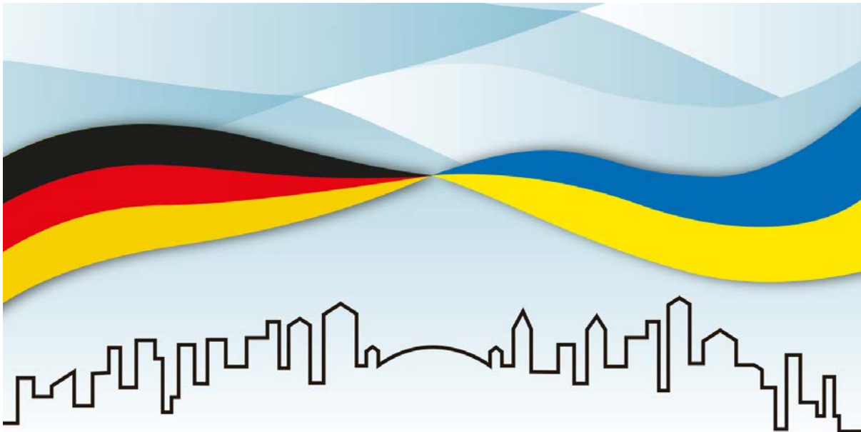
Die Servicestelle Kommunen in der Einen Welt unterstützt deutsch-ukrainische kommunale Partnerschaften