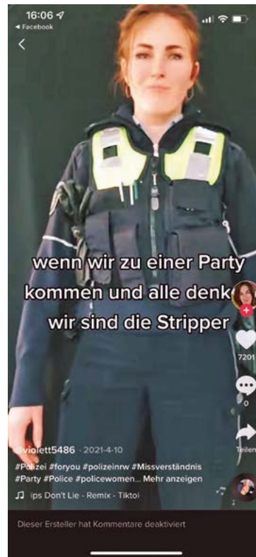
Die Polizei NRW gibt auf TikTok persönliche Einblicke in den beruflichen Alltag ihrer Polizistinnen und Polizisten

Ihr Partner für die Erstellung ländlicher Wegenetzkonzepte