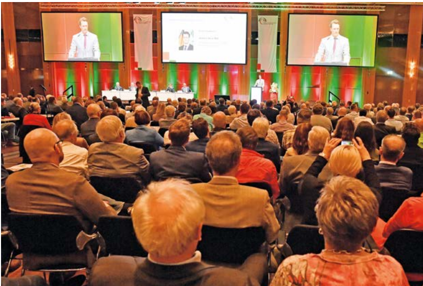
Rund 1000 Delegierte und Gäste aus der Kommunal-, Landes- und Bundespolitik verfolgten im Kongresszentrum Düsseldorf die Rede des Ministerpräsidenten

halten, dann machen es uns andere Länder nach. Andersherum eben aber auch nicht“, gab Wüst zu bedenken. Diese Ziele zusammenzubringen, sei eine zentrale Herausforderung für jeden, der Politik mache. Erfolgreich sein könne das Land dabei nur im Schulterchluss mit den Kommunen. Eine enge Zusammen-