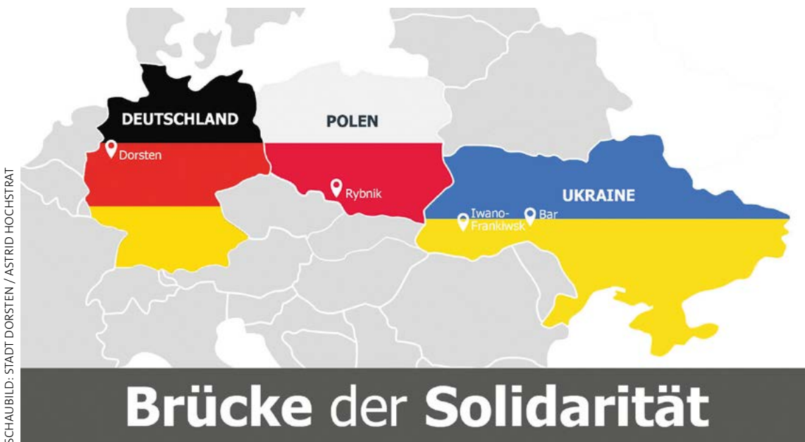
Die Stadt Dorsten und ihre polnische Partnerstadt Rybnik koordinieren gemeinsam Hilfe für Bar und Ivano-Frankivsk

Sachspenden aus Hürth „Wir in Hürth haben uns der Frage gestellt, was Kommunen leisten können, um die Identifikation mit der europäischen Idee zu