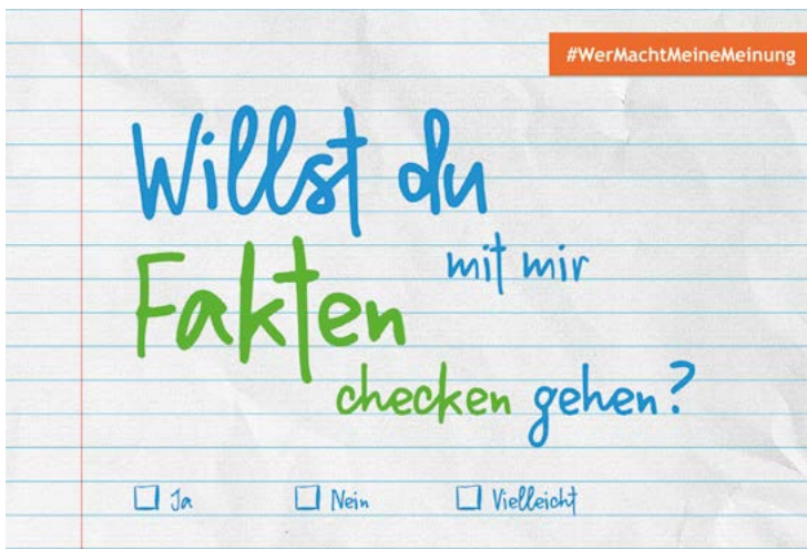
KARTE: EU-INITIATIVE KLICKSAFE

Eine Bilder-Rückwärtssuche mit Hilfe von Suchmaschinen kann dabei helfen herauszufinden, ob es aus dem Kontext gerissen wurde.