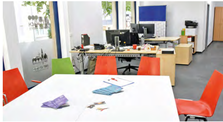
Die Büroräume sind lichtdurchflutet und geräumig

Koordinierung durch Stadt Die Koordinierungsstellen Beteiligung und Ehrenamt der Stadt Schwerte managen das MitMachBüro und das MitMachPortal sowie die Begleitung des Gesamtprozesses. Sie beraten, vernetzen und informieren. Sie sind zuständig für