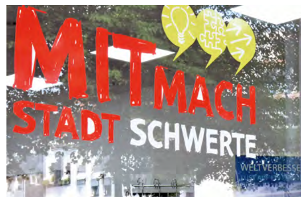
Das Schaufenster des MitMachBüros zeigt, dass es um Bürgerbeteiligung geht

Gremium für Mitarbeit Es liegt im Prinzip der MitMachStadt, Engagement und Beteiligung von Einwohnerinnen und Einwohnern an der Entwicklung