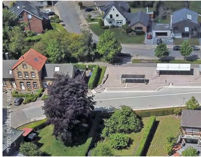
Der zentrale Omnibusbahnhof in Wettringen ist für Pendlerinnen und Pendler gut und schnell zu erreichen

Nutzen wir die Chance und bauen wir die Städte und Gemeinden so um, dass der Fuß- und Radverkehr zukünftig die ihm gebührende Rolle spielen kann. Die Krisen unserer Zeit machen es immer wieder deutlich: Es gilt, die vorhandenen Mobilitätsstrukturen zu überdenken und wortwörtlich neue Wege zu entwickeln, auf denen wir gestärkt in die Zukunft gehen können.