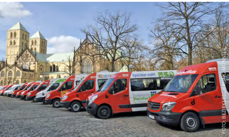
Das 30-jährige Bestehen der Bürgerbusse in NRW feierten Vereine aus dem Regierungsbezirk Münster 2015 auf dem Domplatz in Münster