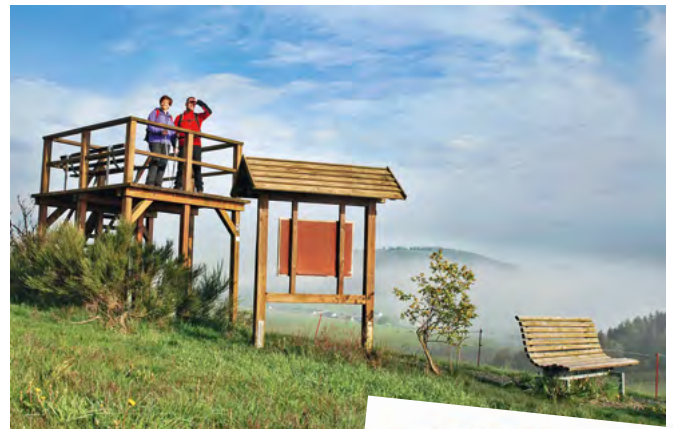
Aussichtspunkte bieten einen wundervollen Blick auf die Landschaft

chenspur“, der im vergangenen Herbst als erster Premium-Spazierwanderweg in Südwestfalen zertifiziert wurde.