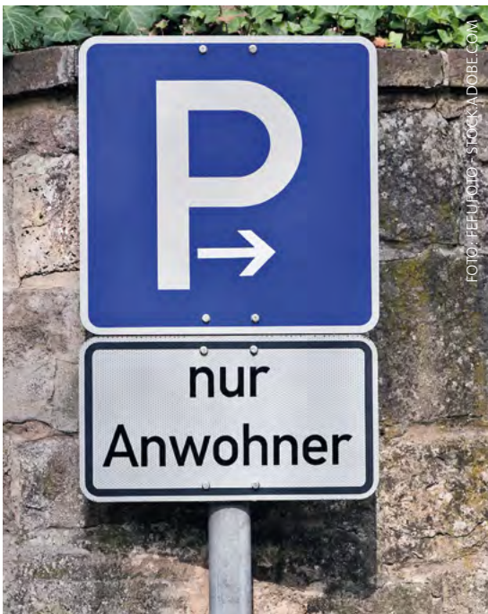
In vielen Städten und Gemeinden gibt es spezielle Zonen für Bewohnerparken

Eine Neuordnung der öffentlichen Parkplätze in den Innenstadtquartieren ermöglicht darüber hinaus die Neuaufteilung des Straßenraums zugunsten der Abschaffung des Gehwegparkens, des Ausbaus von Rad- und Fußverkehrsanlagen, der Gestaltung von Anwohnertreffpunkten sowie der Verbesserung der Klimaresilienz der Quartiere. ●