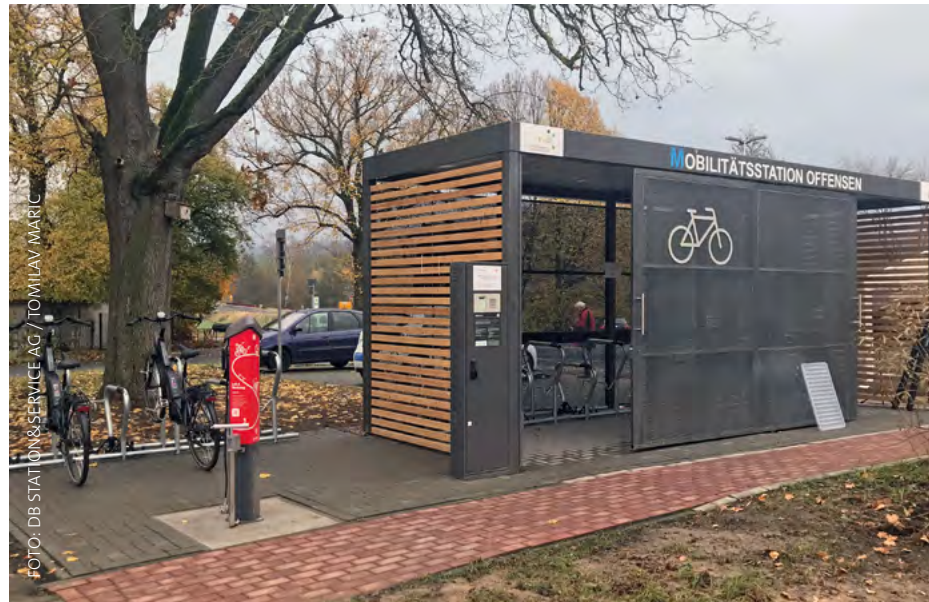
In Sammelschließanlagen an Bahnhöfen können Pendlerinnen und Pendler ihre Fahrräder abstellen und mit der Bahn weiterfahren