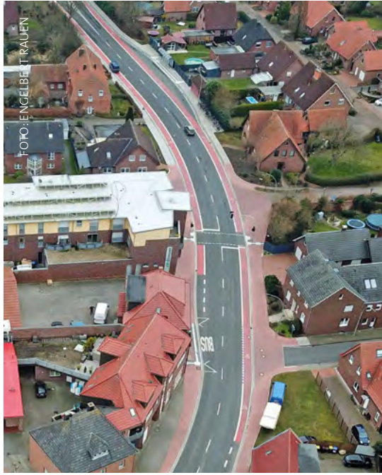
Die Radwege in und um Wettlingen sind breit und rot markiert

Durch zwei Radwegebaumaßnahmen auf einer Gesamtlänge von rund zwei Kilometern wurden 2020 das Naherholungsgebiet Haddorfer Seen in Wettlingen mit einem vier Sterne Campingpark und dem Wochenendhausgebiet stärker an das gemeindliche Radwegenetz angebunden. Als letzte fehlende Radwegeverbindung zu einer Nachbarkommune wurde 2021 eine Radwegeverbindung zwischen Wettlingen und der Stadt Steinfurt errichtet. Hierbei wurde der Querschnitt der Straße für die Anlegung eines Radweges reduziert.