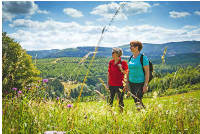
Rund um Bad Berleburg laden zahlreiche Themen- und Rundwege zum Wandern ein

An der Auszeichnung zum Premium-Wanderort hat die Stadt der Dörfer entschlossen und konstruktiv gearbeitet. Rund um Bad Berleburg gibt es aktuell vier Premiumwanderwege: Wittgensteiner Schieferpfad, Via Adrina, Via Celtica und „Bei de Hullerkeppe“. Hinzu kommt der Themenweg „Mär-