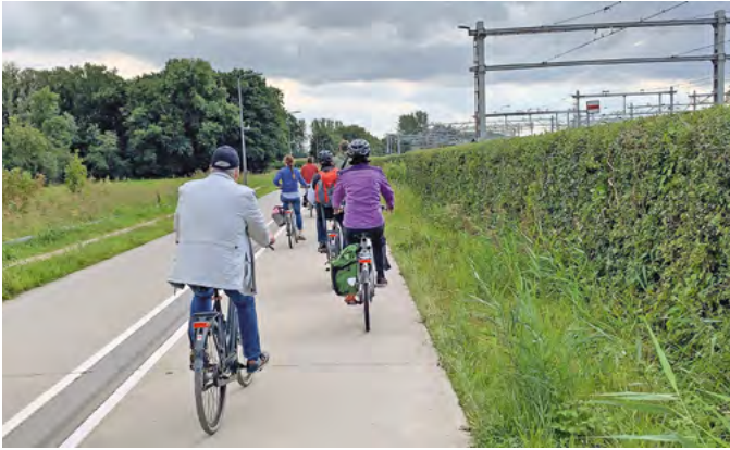
Ein Rad-schnellweg führt vom Zentrum von Zwolle direkt zum Campus der Fachhochschule Windesheim

Für Radfahrerinnen und Radfahrer in den Niederlanden gibt es in der Regel sichere Strecken entlang speziell angelegter Radwege